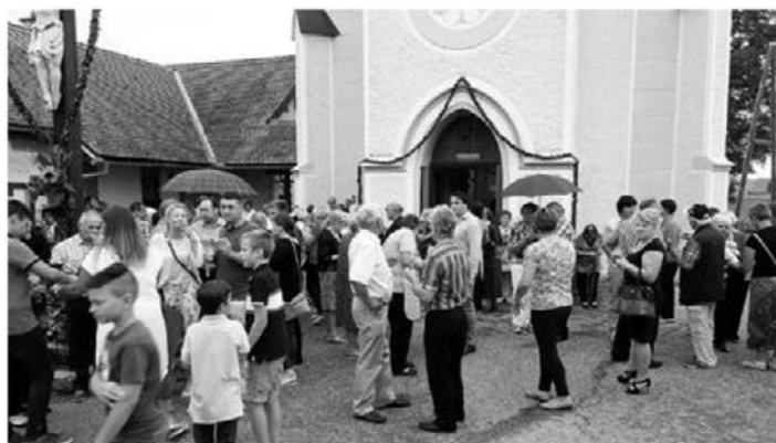
Praznovanje se je že po tradiciji nadaljevalo ob skupnem druženju pred cerkvijo.

lahko vzgled zaupanja in vztrajnosti. Slovesnost je obogatil Mešani cerkveni pevski zbor pod vodstvom Sandija Potočnika, cerkev pa je bila tudi letos nadvse lepo ozaljšana s številnimi venci iz žingerla.