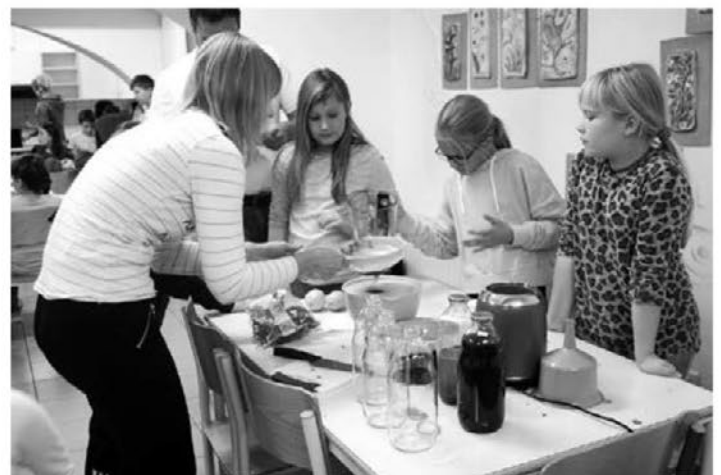
Na OŠ Leskovec so izdelovali tudi metin sok.

Učenci so bili razdeljeni v skupine, v vsaki so bili tudi starši in stari straši, ki so učence vodili in jim pomagali pri delu. Ustvarjali so iz jesenskih plodov in v avli pripravili čudovito razstavo izdelkov iz divjih kostanjev. Izdelali so mazilo Dr. Divji kostanj in prikazali praktično uporabo le-tega. Kuhali so juho iz kostanjev ter izdelali kostanjevo kremo in sok iz mete (brez sladkorja). Ena skupina je izdelala majhne šopke iz mete, melise, sivke, peteršilja in kostanjev. Celotno prireditev so učenci popestrili s petjem in igranjem na glasbila; igrali so