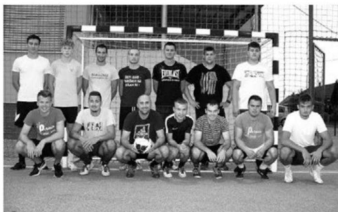
Z vaškega nogometnega turnirja v KS Sela