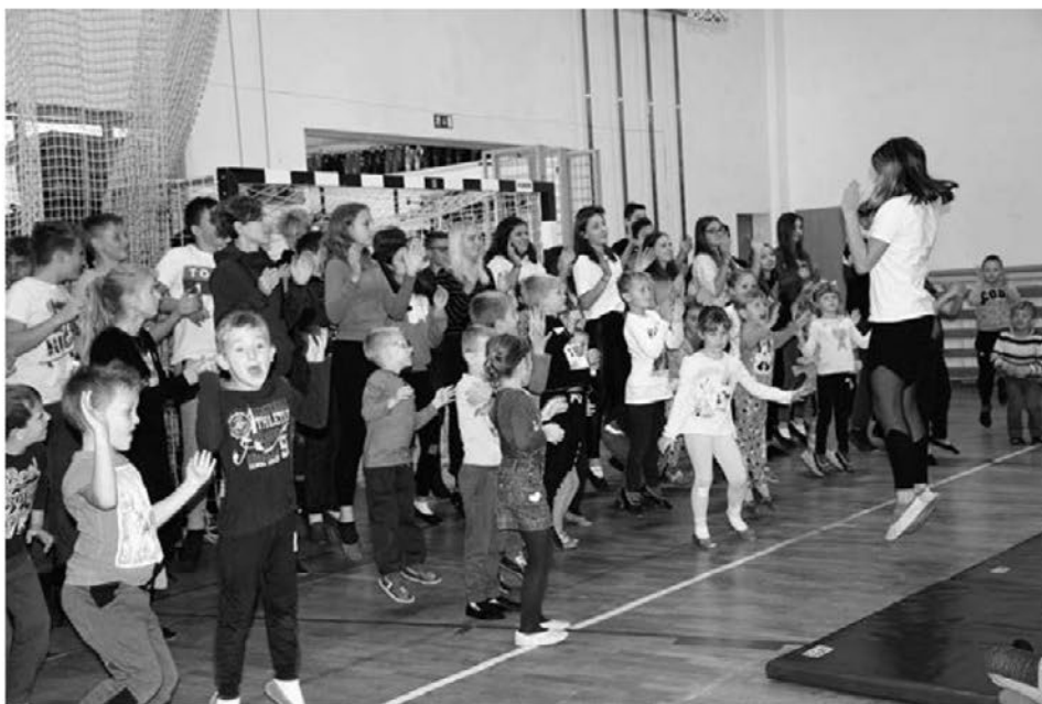
Učence 1. razreda so sprejeli v šolsko skupnost.