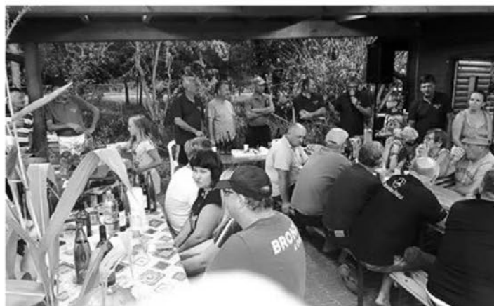
Pobrežani na tradicionalnem druženju ob golažu in dobri kapljici