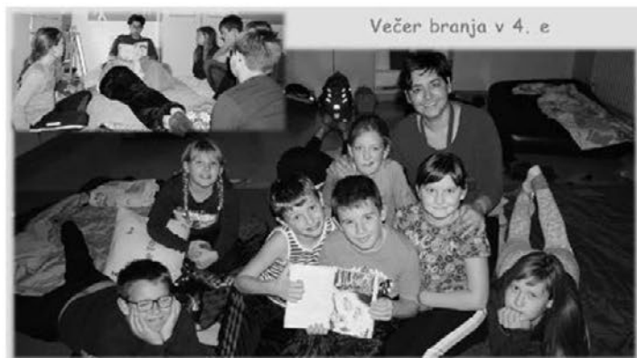
Večer branja v 4. e

V ponedeljek, 7. oktobra, smo imeli četrtšolci šole Leskovec razredni tehniški dan, ki smo ga namenili branju in povezoivanju. Zbrali smo se ob 17. uri, si uredili »gnezdece« v naši učilnici in se nato pridružili knjižničarki Vesni, ki je pripravila