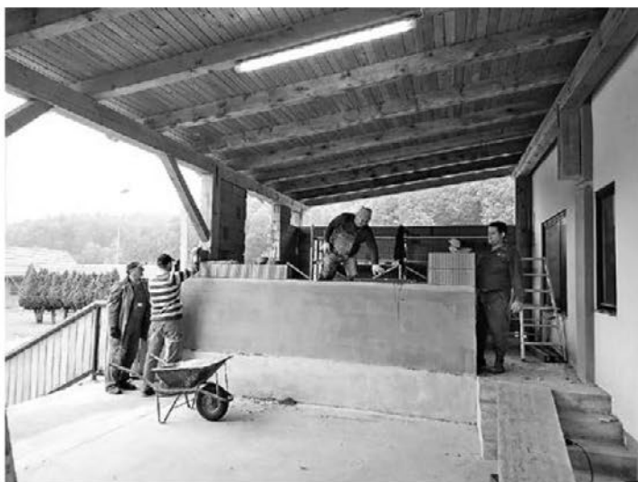
Adaptacija prostorov kuhinje in elektrifikacija terase