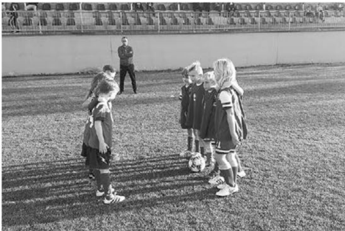
Pozdrav pred tekmo

V vsaki polsezoni (jesen, pomlad) tako mladi nadobudneži opravijo z dvema uradnima turnirjema, eden izmed njih