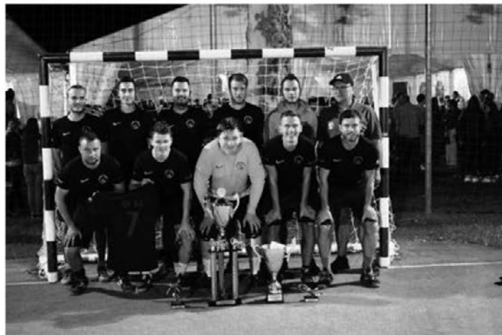
Odlična nogometna ekipa ŠD As.

V avgustu smo se udeležili turnirja v Višnjici na Hrvaškem, kjer je potekal tridnevni turnir s 25 sodelujočimi ekipami z igralci malonogometnega prvoligaškega nivoja s širšega območja Hrvaške. Z zmago na turnirju smo dosegli največji uspeh v zgodovini društva, saj smo prva ekipa v 23-letni zgodovini turnirja, ki je zmagovalni in prehodni pokal (ta meri v višino