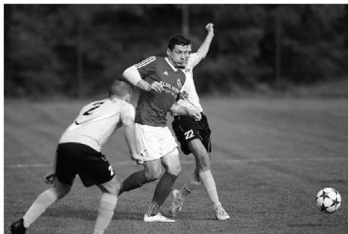
Nogometaši Tržca že nekaj sezon nastopajo v 1. razredu MNZ Ptuj.

Najvišje »rangirana« ekipa je člansko moštvo Vidma, ki že