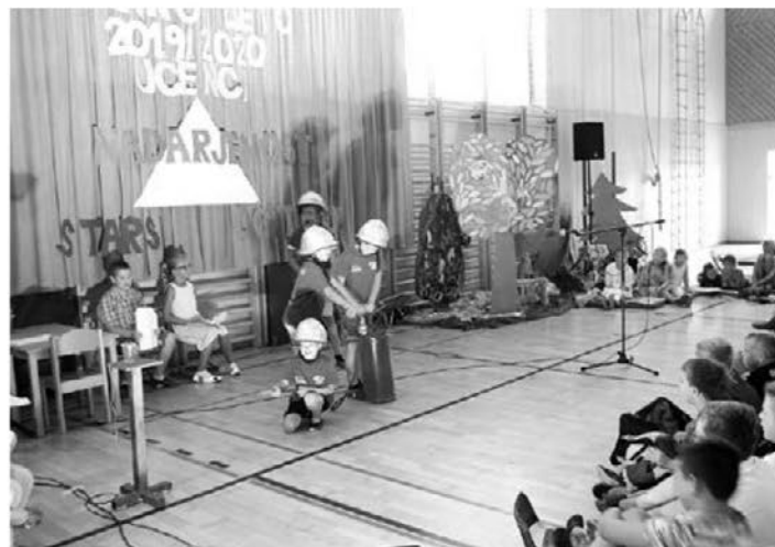
Prvi šolski dan na podružnici Leskovec.

Nekateri so svoje sposobnosti pokazali že na svoj prvi šolski dan tega leta in tako obogatili našo kulturno prireditev s prikazom gimnastičnih elementov, z opravljanjem poslanstva učitelja in navihane učenke, nogometaši s predstavitvijo nogometa, mladi kmetje s predstavitvijo kmetijstva, mladi gasilci z vajo z brentačo in z gasilskim pozdravom ter s predstavitvijo živali, ki so se s pogumom in vztrajnostjo borile ter preprečile podiranje doma in šole oziroma Hotela Hrast. Svoje glasbene sposobnosti so nam pokazali tudi igralci klavirja, harmonike, frulice, flavte in bobnov in s petjem.