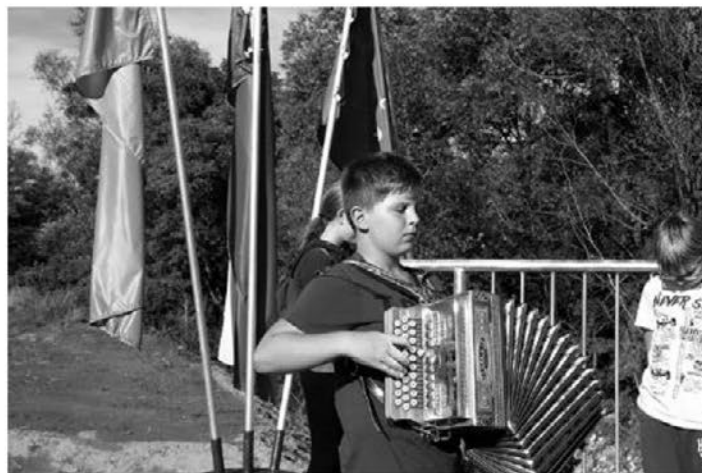
Utrinka s slovesnosti v Sp. Leskovcu