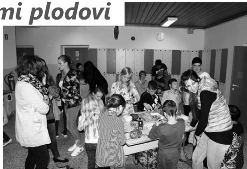
Na delavnicah so ustvarjali z jesenskimi plodovi.