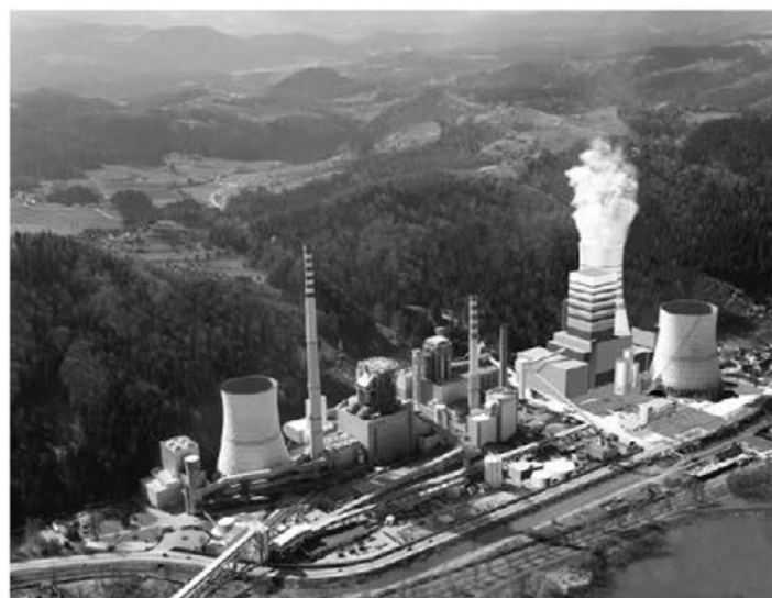
Termoelektrarna Šotanj.

Slovenija je politično in gospodarsko vpeta v mednarodno trgovino, ki zasleduje cilje neomejene gospodarske rasti, ne glede na degradacijo okolja in kakovost bivanja lokalnega prebivalstva.