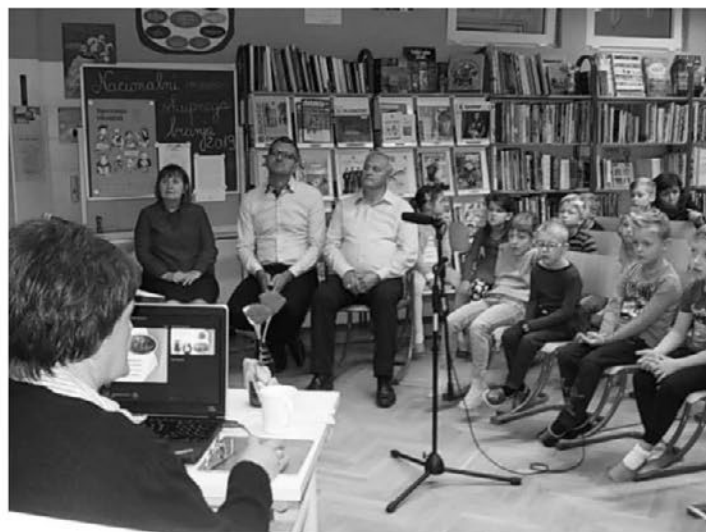
Pravljíčna ura v šolski knjižnici.