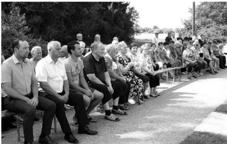
Slovesnosti se je udeležilo veliko domačinov in gostov.

V Zgornji Pristavi je 1. septembra potekala slovesnost ob blagoslovu zdaj Cafutovega (nekdaj Božičkovega) križa. Nova lastnica zemljišča, na katerem je stalo versko znamenje, se je namreč križu odpovedala, prizadevni domačini pa so skupaj s KS Sela in podružnico sv. Družine hitro našli rešitev. Križ, katerega lastnik je postala sv. Družina, je kmalu dobil novega oskrbnika – družino Cafuta iz Zg. Pristave, ki je na svojem zemljišču odstopila prostor v ta namen.