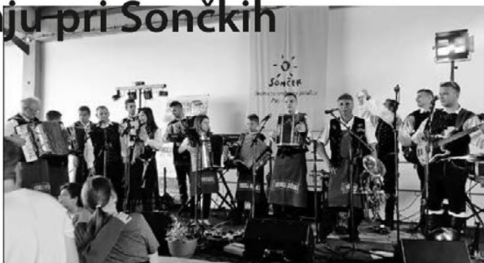
Veseli Jožeki in Petovia kvintet skupaj na odru na zabavi Sončkov

Velik hvala skupini Veseli Jožeki za njihovo pripravljenost in