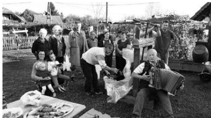
Veselo jesensko razpoloženje v Šturmovcih

Na dogodku ni manjkala pogostitev z dobro hrano in pijačo. Ob tej priložnosti se zahvaljujemo vsem, ki ste pomagali pri pripravi in izvedbi dogodka, pripravi hrane in prinesli dobrote