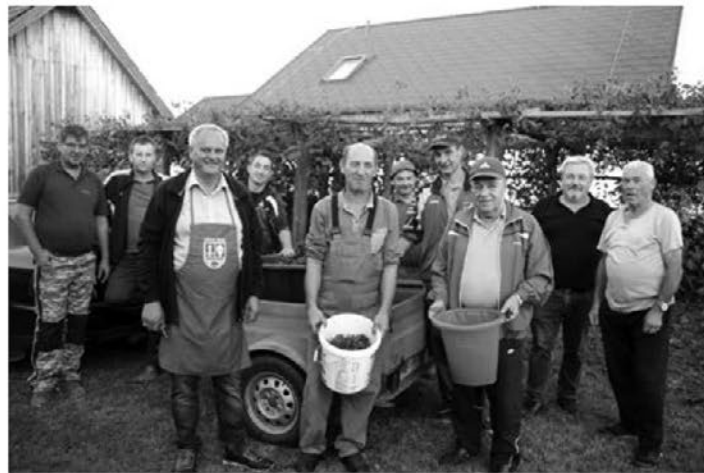
Vesela trgategv brajd na Kočarjevi domačiji, kjer se je beračem pridružil tudi videmski župan.