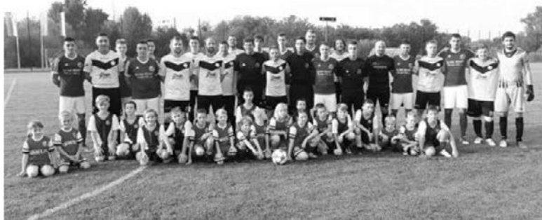
Skupinska fotografija s podmladkom Tržca pred osrednjim srečanjem

Tudi letos smo bili priča odlično organiziranemu dogodku, ki je potekal v četrtek, 29. avgusta, sicer pa o odlični organizaciji ŠD Tržec, ko gre za tovrstne prireditve, ne gre dvomiti.