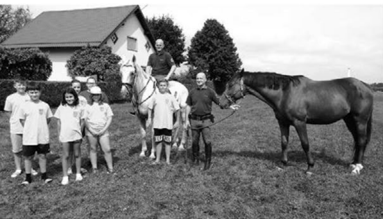
Utrinek z ene izmed nedeljskih delavnic, v kateri so se predstavili tudi mariborski policisti konjeniki.

Sobotni dopoldan je bil namenjen različnim delavnicam, udeleženci so spoznavali vozle, reševanje ponesrečencev, dihalne aparate, preizkusili pa so se tudi v gašenju s penilom. Dan so izkoristili še za ogled bližnje Oljarne Svenšek, popoldan pa so