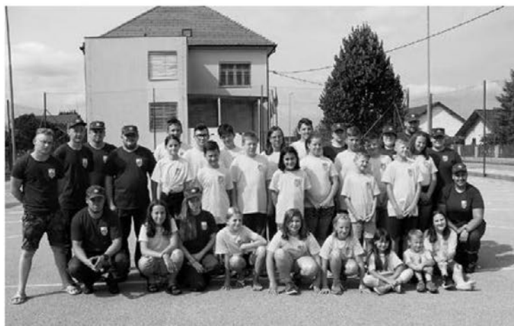
Ob koncu tabora še skupinski posnetek vseh udeležencev in mentorjev