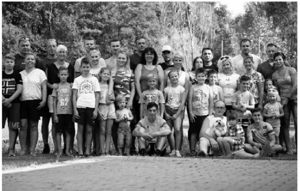
Prevolškovi bratrancev in sestrične z družinama na drugem srečanju.

Družina Prevolšek izhaja iz Žetal. Mladi so potem našli svoje ljubezni in se odselili; eni zdaj živimo na Ptuju, drugi v Žetalah, Trzcu, Ljubljani,... Vsak po svoje živi svoje življenje in sanje, vsak po svoje se bori in skrbi za svojo družino. Ob vsem tem pa ne pozabimo drug na drugega. Občasno se slišimo po telefonu, kdaj tudi obiščemo. Ker je življenjski tempo danes tako hiter in vsakemu zmanjkuje časa za bližnje, je ravno tako