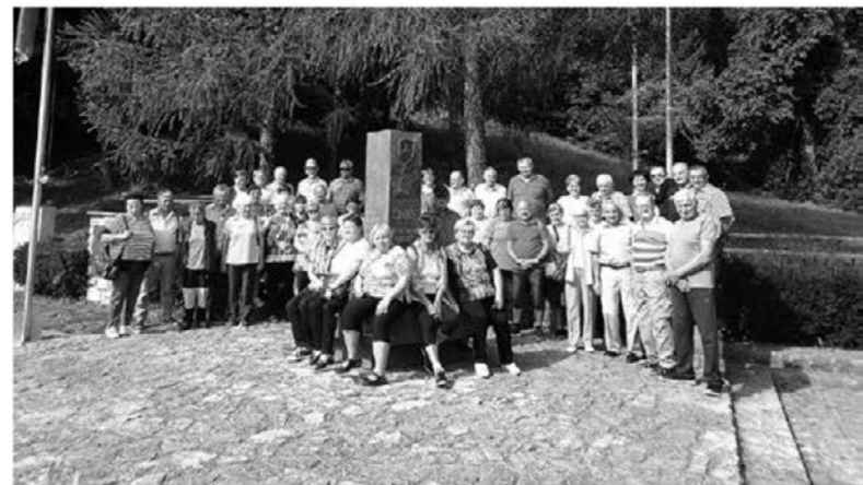
Dolenski upokojski na izletu na Vačah, v geografskem središču Slovenije

V avgustu smo se udeležili upokojskih iger v Vidmu. V prijetnem vzdušju in ob obilnem gostoljubju smo našli tudi časa za igranje z žogo, metanje podkve idr. in že smo morali na