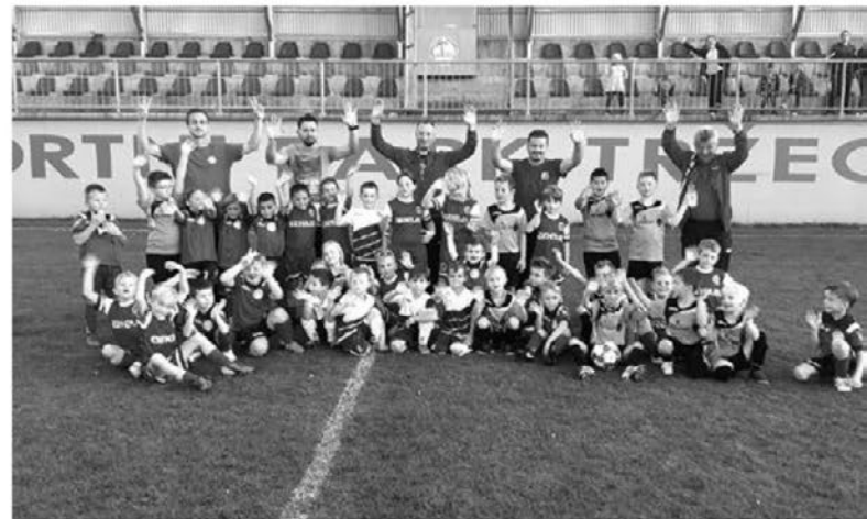
Skupinska vseh udeležencev turnirja U7 v Tržcu

je potekal tudi v vasici ob Polskavi. V Tržcu so poleg mladih domačinov žogo brcali še igralci Aluminija, Boča in Spodnje Polskave, skupaj ji je bilo blizu 40. Rezultat ni v ospredju, pomembna sta zgolj druženje in igra. Turnir je v idealnih vremenskih pogojih za ta letni čas potekal brezhibno, bil je odlično organiziran, in kar je najpomembnejše, vse skupaj je minilo brez poškodb. Igralci in številni navijači, predvsem starši, so lahko uživali. Ko je po koncu turnirja sledilo še okrepčilo, je bilo veselje vseh nastopajočih še toliko večje.