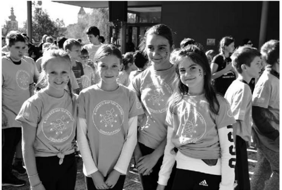
Na Unescovem teku na Ptuj so nastopili tudi videmski učenci.