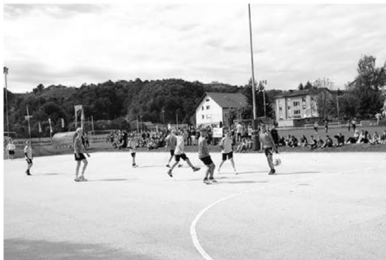
Sodelovali smo na Zlatkovem memorialu v Leskovcu.

Letos se je Zlatkovega memoriala udeležilo pet ekip. Nastopile so OŠ Cirkulane, Podlehnik, Videm in organizator Leskovec. Turnir je mednarodni, saj se ga udeležujejo tudi šole iz sosednje Hrvaške. Letos je bila to osnovna šola iz Lepoglave. Na teh memorialnih turnirjih je rezultat drugotnega pomena. Pomembni so druženje, uživanje v nogometni igri in športno