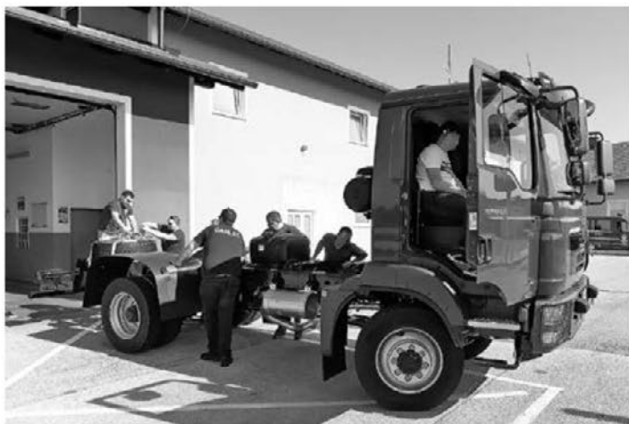
Novo podvozje MAN TGM 13.290 4 × 4 BL FW

Vtorek, 16. julija, je bilo veselo popoldne pred gasilskim domom Tržec. Člani PGD Tržec in drugi gostje so si za dobro uro lahko ogledali novo podvozje znamke MAN, ki bo v podjetju Rosenbauer v Gornji Radgoni nadgrajeno v gasilsko vozilo GVC24/50.