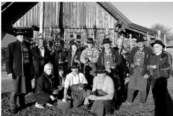
Modra kavčina je letos dobro obrodila in v Dravcih je bila vesela trgategv.