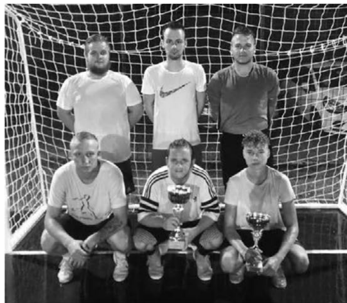
Zmagovalna ekipa Bar Osmica.