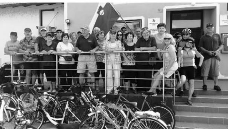
Preden so se kolesarji podali na pot, je nastal posnetek za arhiv pred društvenimi prostori.

Za nami je čas poletja, dopustov in počitnic, s tem pa začetek zadnjih mesecev tega leta. V DU Videm izpolnjujemo načrt aktivnosti, ki smo si ga zadali na zboru članstva. V vodstvu se trudimo, da bi bili skozi vse leto zanimivi dogodki in bi s tem polepšali kakšen dan našim članom.