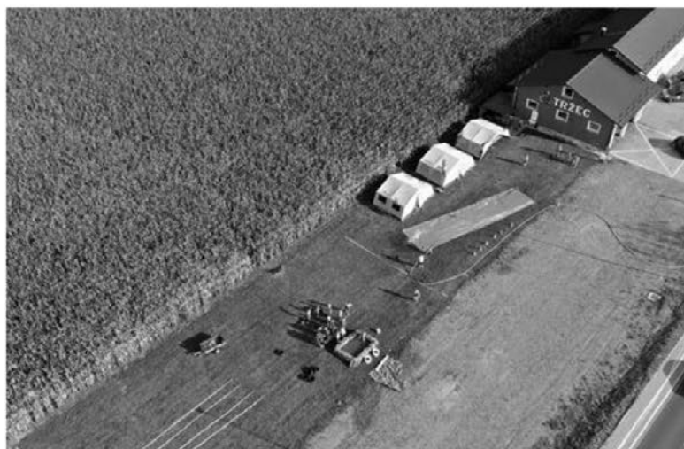
Prizorišče letošnjega 2. tabora gasilske mladine PGD Tržec

V juliju smo si na kratko ogledali novo podvozje MAN za naše bodoče gasilsko vozilo GVC24/50. V avgustu smo bili prisotni na večini prireditev ob prazniku KS Tržec. Tako smo se z dvema ekipama udeležili krajevnega turnirja v visečem kegljanju v prostorih režijskega obrata občine Videm v Tržcu, prikazali smo gasilsko vajo na objektu Djočanove domačije v Tržcu in z eno ekipo sodelovali na malonogometnem turnirju ob odprtju posodobljenega asfaltnega igrišča v Športnem parku Tržec. Vrhunec aktivnosti je bila organizacija tridnevnega tabora gasilske mladine PGD Tržec zadnji vikend v avgustu, ki smo ga letos organizirali drugič zapovrstjo in želimo, da ostane tradicionalen, saj se mladina tako lahko aktivno