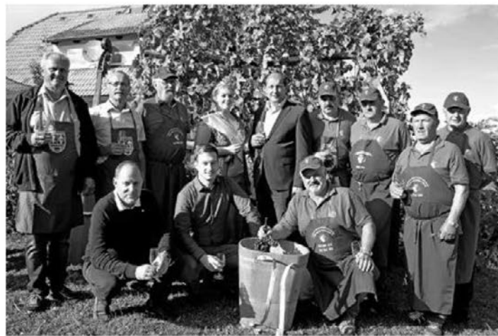
Zbrani na trgatvi v Ljubstavi, kjer je stara trta dala obilen pridelek.

Letošnja letina je bila kakovostna, pridelek pa precej obilen, je povedal gospodar trte, saj so berači pri Potrčevih potrgali 45 grozdov, sprešali pa so jih skupaj z žametno črnino, ki so jo prinesli vinarji Društva vinogradnikov in sadjarjev Osrednje