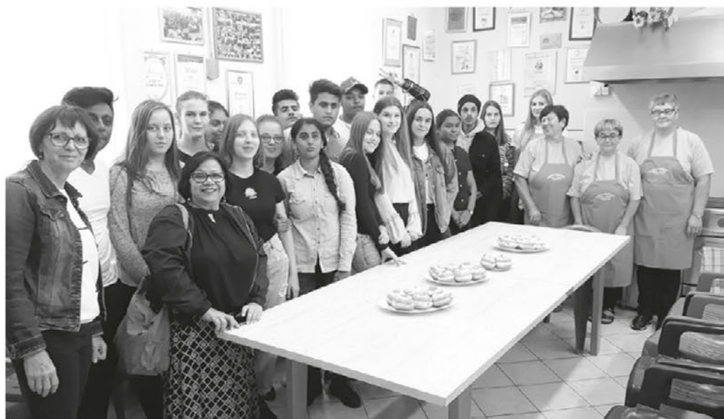
Lancovljanke so v društveni kuhinji z veseljem gostile dijake Gimnazije Ptuj in njihove goste – dijake iz Indije.

Konec julija so se dva dni družile pri članici Tiliki Jurgec, kjer so pletle verige iz žingerla za aninsko žeganje. Na praznični dan smo jih lahko srečali na Selih na stojnici, kjer so obiskovalcem aninske nedelje ponujale domače dobrote. Prvi dan v avgustu je bil namenjen celodnevni kopalnemu izletu v Izolo, 5. avgusta pa so ponovno začele nov cikel ustvarjalnih delavnic v vaškem domu.