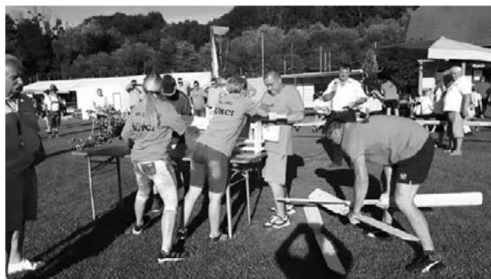
Šurcarji so letos sodelovali tudi na kmečkih igrah v Leskovcu.