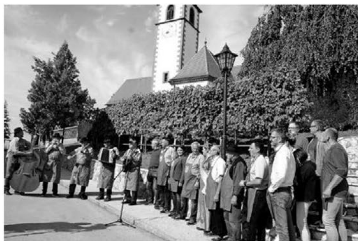
Med berači v videmskem občinskem vinogradu