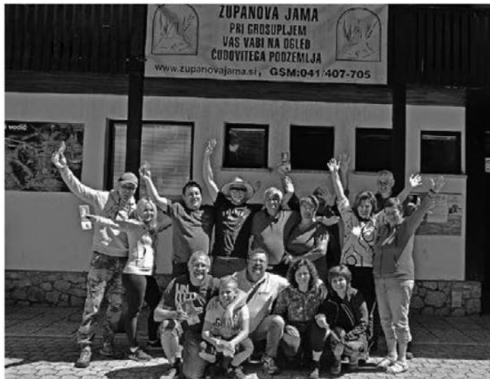
Videmski gledališčniki pred Županovo jamo pri Grosupljem

Gledališka skupina KD Franceta Prešerna iz Vidma pri Ptujju letos praznuje 20 let ponovne oživitve gledališke dejavnosti, ki je sicer tod živel od davnega leta 1923 do 1986. Od leta 1999 do danes je skupina uprizorila kar 22 zelo uspešnih predstav.