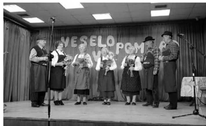
Utrinek z jubilejne prireditve ljudskih pevcev Vinogradnikov ob njihovi 40-letnici.