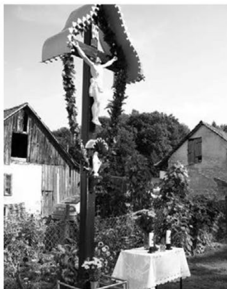
Križ v Zg. Pristavi je bil letos prestavljen na novo lokacijo.

Tretji primer je glavni križ na pokopališču. Tu je zgodba zapletena. Križ je zelo velik in težak. Korpus (telo) je bil kakovostno pozlačen in je v dobrem stanju. Drugače pa je z lesenim