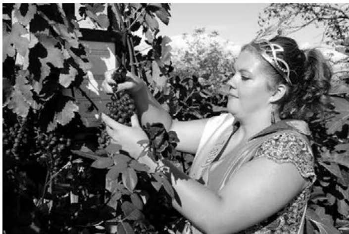
Beračem se je že po tradiciji pridružila tudi aktualna vinska kraljica.