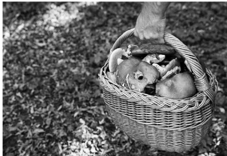
Gobarjenje je eden izmed najbolj priljubljenih konjičkov Slovencev.

Gobarjenje imamo Slovenci v genih, nekako tako kot pohođništvo, vendar pa je tudi pri tej priljubljeni dejavnosti treba biti previden. Uredba o varstvu samoniklih gliv določa, da lahko vsak gobar dnevno iz gozda odnese največ dva kilograma gob, lahko pa na primer utrga gobo, ki ima več kot dva