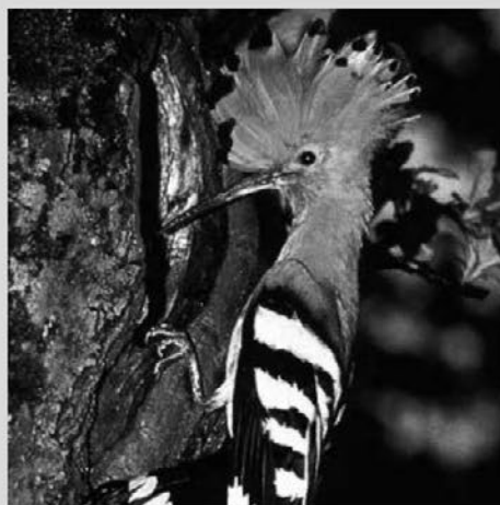
Smrdokavra (Upupa epops) - Šturmovci.