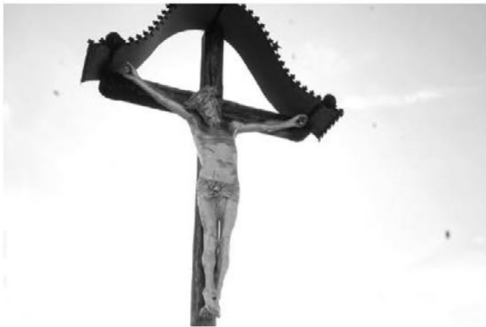
Glavni križ na pokopališču je potreben temeljite prenove.