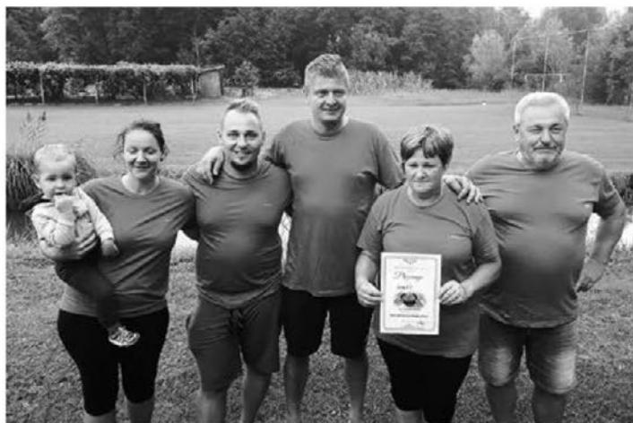
Najboljši golaž je po oceni komisije skuhal ekipa Boršt.