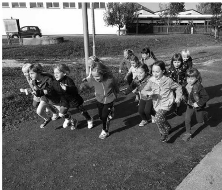
V Vidmu so tekli najmlajši.

Vsi sodelujoči smo v teku zelo uživali, zato se že nestrpno veselimo našega naslednjega športnega podviga.