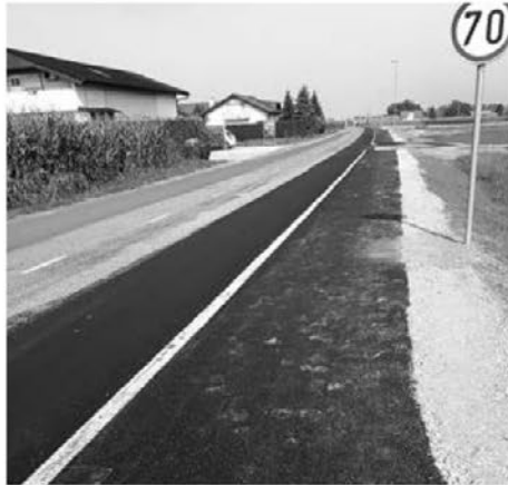
Pločnik je bil asfaltiran konec avgusta.