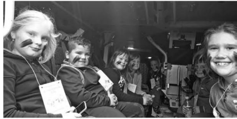
Mladinci v notranjosti patrije Slovenske vojske

V tem mesecu smo izvedli gasilske vaje na različnih objektih v našem požarnem okolišu. Skupaj s PGD Tržec smo organizirali evakuacijo na OŠ Videm in predstavili našo gasilsko tehniko. Letošnja tema so večstanovanjski objekti, zato bomo v oktobru pripravili društveno vajo na to tematiko. Udeležili smo se tudi organizirane vaje »Drava« pri PGD Markovci in