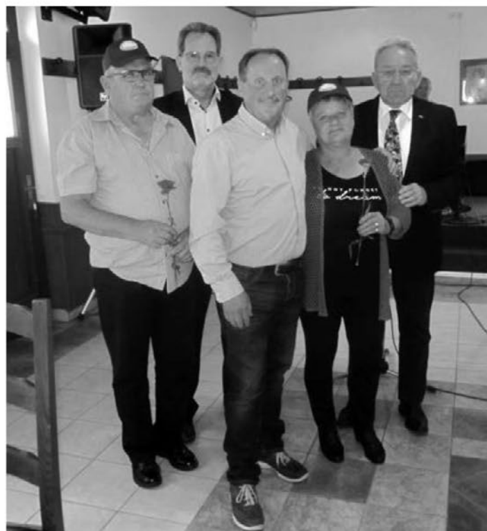
Sprejem novih članov