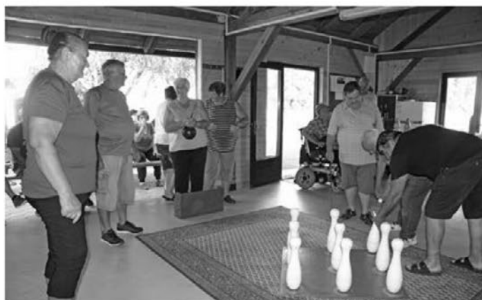
Zanimivo je bilo na letošnjem dobro obiskanem tekmovanju v visečem kegljanju.