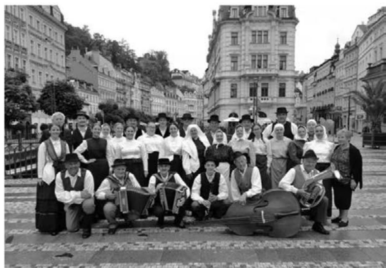
Tudi na letošnje gostovanje ostajajo lepi spomini.

Mesto je poznano po kolonadah, kjer lahko najdemo in poskusimo vodo iz njihovih znanih gejzirjev tople vode. Izve-