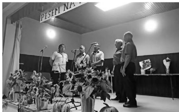
Fantje iz Jurovc so proslavili tri desetletja svojega nastopanja.