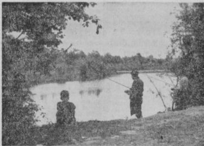
Ob Dravinji pod Varejo jih je vedno dovolj