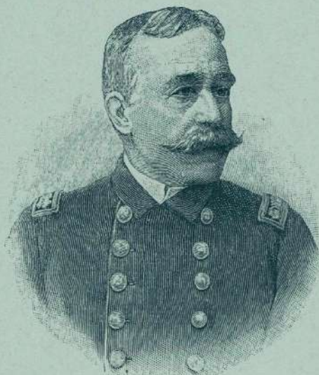
Kommodore George Dewey, poveljnik ameriškega brodograja, zmagovalac pri Manili.

Palackega slavnost v Pragi. Sredi minulega meseca so praznovali Čehi z ve-