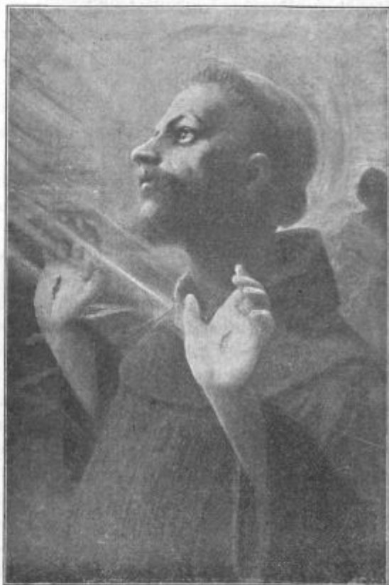
Sv. Frančišek Serafski.

da je l. 1747 ob priliki tridnevnice sv. Fidela in Jožefa Leoniškega prišlo iz okoliških župnij toliko ljudi, da so na samostanskem vrtu morali napraviti oltar; in v tistem času, ko je bila v cerkvi pridiga, so bile še tri pridige na vrtu in obhajanih je bilo takrat nad 15.000 ljudi. Dokaz temu, da so Ločani vedeli ceniti kapucine je tudi to, da so za časa cesarja Jožefa II. in tudi pozneje se potegnili zanje.