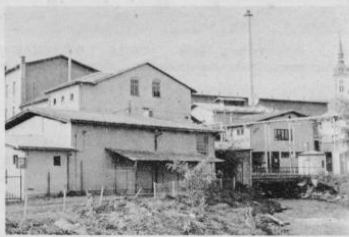
Pogled na Tovarno olja v Slovenski Bistrici

Trenutno so še vedno enovita delovna organizacija, tečejo pa vse priprave, da se organizirajo kot družbeno podjetje.