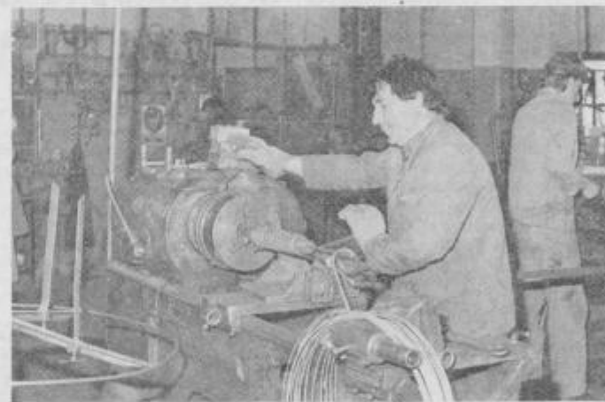
Na zagrebškem velesejmu so predstavili tudi najnovejši računalniško vodeni program z uporabo tehnoloških laboratorijskih metod ...

ske vzmeti dosegle že petino mesečne proizvodnje. V tovarni se zavedajo, da je perspektiven razvoj možen le na področju najzahtevnejših tehničnih vzmeti, saj le inovativni programi zagotavljajo uspešen prodor in obstoj na vse bolj konkurenčnem tržišču.