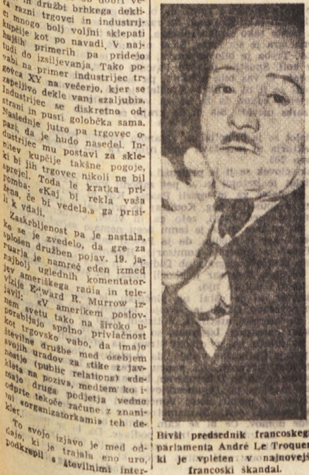
Bivši predsednik francoskega parlamenta Andre Le Troquer, ki je vpleten v najnovejši francoski skandal.

Popolnoma utri pot tudi na ameriški tla. Nekateri pravijo, da se kaže njegova sreča tudi v tem, da je prav v soboto v Sanremu, ki je znan kot mesto sonca in rož, močno deževalo, tako da so bili poslušalci v dvorani tudi duševno pripravljeni na izbiro pesmi, kar pa seveda velja le za navjne ljudi, ki se vamejajo, da je festival v Sanremu nekaka olimpijada popevk, na kateri naj bi se uveljavljajo najboljši. Skeptiki namreč pravijo, da je vse uveljavljeno napreter, da se izbira pesmi stvar kompromisna med tremi največjimi zaletnimi muzikali. Sedaj pravijo ti skeptiki, da bo letos vse leto sodelovalo po vsem lanskem letanju.