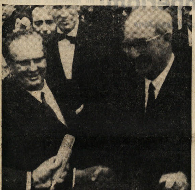
Prisrčni stisk prijateljskih rok dveh državnih poglavarjev. Tito in Saragat med včerajšnjim slovesom na ljubljanskem letališču Brnik

VARSAVA, 6. — Predsednik Poljske Spychalsky je danes prisel na uradni obisk v Alžir kot gost predsednika Bumedjena.