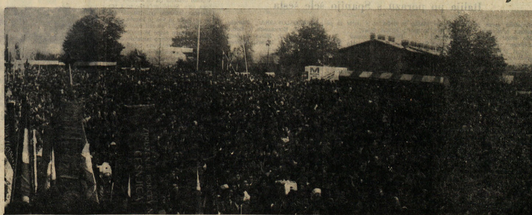
Pogled na preko trideset tisočglavo množico