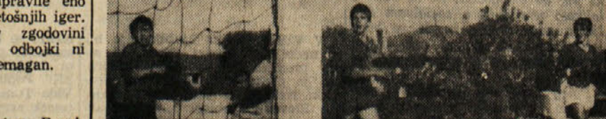
Drugi gol Primorja v sobotni naraščajniški nogometni tekmi 11. slo- venskih športnih iger s Repnom