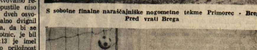
S sobotne finalne naraščajniške nogometne tekme Primorec - Breg. Pred vrati Brega

Italija je v tudi v poslovnih tekmi razočarala svoje navijače.