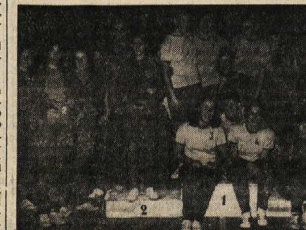
Igralke ekip, ki so se uvrstile na prva tri mesta so se za spomni se skupaj slikale

V borbi za 3. mesto je Breg odpravil nerazpoloženo Zarjo