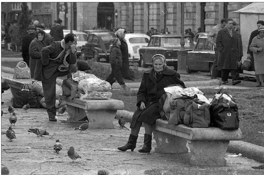
Z normalizacijo čezmejnih odnosov in pritokom kupcev iz Jugoslavije se za Trst pričanja novo obdobje trgovskih uspehov ( http://www.trieste-di-ieri-e-di-oggi.it/ ).

govorilo, da slovenski jezik razumejo, še enkrat toliko pa, da ta jezik deloma razumejo. Slovenskega očeta je imelo več kot 6 %, slovensko mater pa več kot 11 % vprašanih. V povprečju je več kot 8 % vprašanih imelo slovensko govoreče starše, 7 % samo enega slovenskega starša, še 10 % vprašanih pa je odgovorilo, da je vsaj eden od staršev slovenščino razumel. Skupaj je okrog 25 % vprašanih imelo povsem ali delno slovenske prednike, skoraj 17 % vprašanih pa je imelo družinskega partnerja, ki je govoril ali razumel slovenski jezik. Kljub temu je med vprašanimi, ki so imeli otroke, le dobrih 7 % odgovorilo, da ti slovenščino govorijo ali razumejo, točno 5 % vprašanih pa je navedlo, da so njihovi otroci v celoti ali deloma obiskovali slovenske šole, kar se povsem ujema z zgoraj navedenim deležem subjektivno opredeljenih Slovencev.