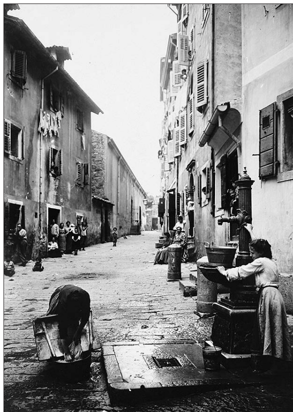
Prizor iz robnega, delavskega mestnega predela Trsta v začetku 20. stoletja.

To je veljalo zlasti v primeru nepismenih oseb in oseb, ki so delale v pretežno italijanskem okolju (predvsem na podeželju), oziroma (predvsem v mestnem okolju) v številnih primerih oseb, ki so, glede na popisno vprašanje povsem ustrezno, navedle sočasno uporabo slovenskega in italijanskega jezika. Čeprav je bila večjezičnost v resničnem življenju v tržaškem mestnem okolju najbolj razširjena oblika komunikacije, uradna statistika, skladno z načelom aut-aut , te možnosti ni predvidevala. Zato je nedominantno jezikovno navedbo črtala v prid prevladujoči jezikovni praksi v javnem življenju, pripadnike manjšinskih skupnosti pa s tem kar »po uradni poti« asimilirala v večino. Kakor smo lahko preverili ob pregledu popisnih pol, se je ta praksa združevala še z italijanizacijo slovenskih imen in priimkov, saj se je med italijanskimi popisovalci v mestnem okolju uveljavila praksa, da so osebna imena zapisali v italijanski obliki (Ivan ali Janez sta postala Giovanni, Jožef je postal Giuseppe, Matija pa Matteo), priimke pa so največkrat zapisali v fonetični italijanski obliki (Grmek je