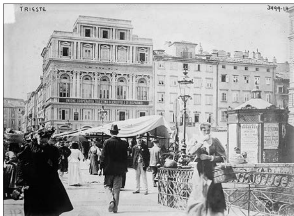
Rusi most in trg pred njim za časa, ko je v Trst prispel James Joyce (začetek 20. stoletja) ( http://www.trieste-di-ieri-e-di-oggi.it/ ).

Ta pričevanja nam pomagajo bolje interpretirati podatke o tedanji narodnostni strukturi mesta. V zvezi s tem gre najprej omeniti, da so Trst v mestne četrti uradno razdelili šele leta 1900, tako da je podrobnejšo narodnostno sestavo mesta mogoče ugotoviti le za popisni leti 1900 in 1910, medtem ko je za obmestne kraje in kasnejše predmestne predele ta struktura razvidna tudi iz popisov za leti 1880 in 1890. 29 Pred tem časom so razne statistike podale le oceno o etnično-jezikovni strukturi na celotnem tržaškem ozemlju. Mednje sodi tudi Czoernigova, prva uradna »etnografska« statistika v monarhiji, ki je bila objavljena leta 1857. 30 Ta je za mestno deželo Trst ugotovila slabih 52.000 oseb italijanske jezikovne skupine in 27.000 oseb slovenske jezikovne skupine. Če predpostavljamo, da je takrat v mestu živel še vsaj 8000 Nemcev, 3000 Judov in okrog 2000 oseb drugih narodnosti, lahko ugotovimo, da je italijansko prebivalstvo obsegalo več kot 55 %, slovensko pa okrog 30 % tržaškega prebivalstva. Mestni magistrat je v letih 1868 in 1875 izvedel dva popisa na podlagi pogovornega jezika v družinskem okolju, iz katerih izhaja, da so tedaj v tržaški občini italijansko govoreče osebe tvorile 70–75 %, slovensko govoreče pa 20–23 % prebivalstva, pri čemer je prva skupina kazala naraščajoči, druga pa padajoči trend. 31