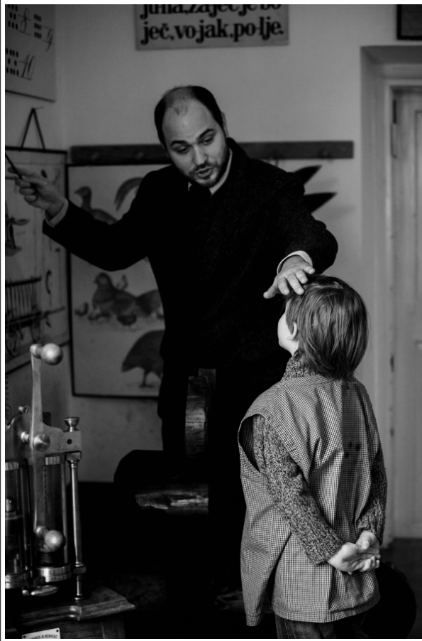
Prešernov dan v SŠM, 8. februarja 2018

enako. Nekoliko presenetljivo je tudi, da je število domačih obiskovalcev z izdanimi vstopnicami večje kot leta 2017. Z ozirom na dogodke med letom, pa je občutno zmanjšanje števila obiskovalcev brez izdanih vstopnic bolj pričakovano. Muzej je v danih okoliščinah, v katerih so hkrati potekala obnovitvena gradbena dela in priprava razstave, zelo uspešno, četudi v nekoliko okrnjeni obliki in obsegu izvedel celoten pedagoško-andragoški program in mu je uspelo ohraniti visoko raven obiska, ki je po posameznih področjih celo boljši kot v preteklem zelo uspešnem letu.