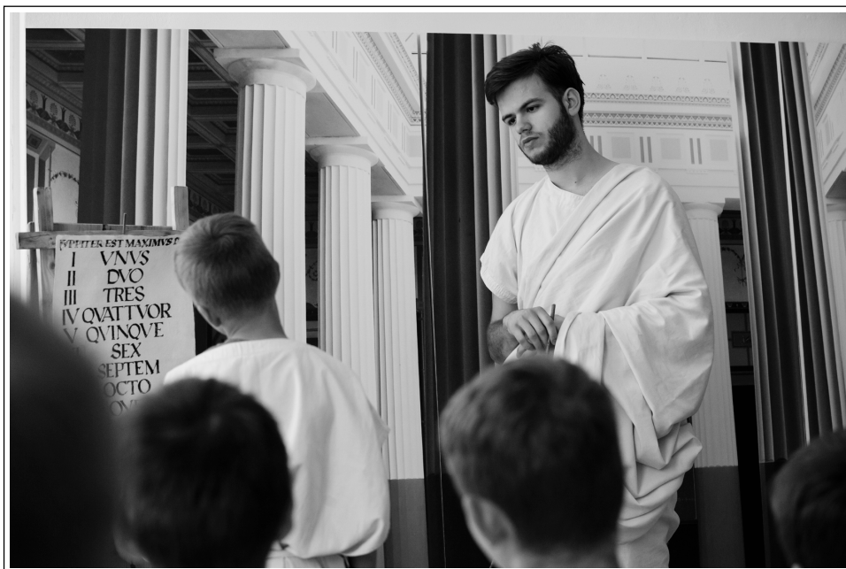
Učna ura Antična Emona v SŠM, 3. maja 2018

in Stara šola za najmlajše. Opravljala je vodenje obiskovalcev po stalni in občasni razstavi, na različne načine sodelovala pri izvajanju muzejskih delavnic med šolskim letom, med počitnicami in ob posebnih priložnostih: izdelava pustnih mask ob dnevu odprtih vrat in delavnica lepopisja v tednu vseživljenjskega učenja na Tržnici znanj v Medvodah. Stare učne ure je izvajala tudi zunaj matične stavbe v muzejski zbirki v Hrastniku, muzejske delavnice pa na Znanstivalu sredi Ljubljane. Sodelovala je pri organizaciji in izvedbi muzejskega programa za Poletno muzejsko noč in Ta veseli dan kulture v muzejski matični stavbi. Pripravila je slikovno gradivo, ki je vodičem po začetku gradbenih del služilo kot nadomestilo za predstavitev nedostopnega prvega dela stalne razstave. Pri izvajanju starih učnih ur je skrbela tudi za popravilo in pranje oblačil za obiskovalce.