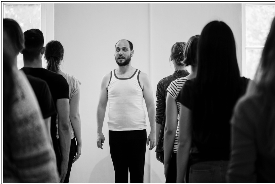
Učna ura telovadba v SŠM, 10. maja 2018

sti je muzej namenil prav za izvajanje in nadaljnji razvoj pedagoških programov. Jeseni ob začetku šolskega leta je izšla vsakoletna promocijska brošura muzeja Pedagoški programi v šolskem letu 2018/2019, v kateri je pedagoška dejavnost muzeja na privlačen način predstavljena celovito. Namenjena je bila za promocijo muzejske pedagogike zgodovine šolstva med osnovnimi in srednjimi šolami ter na muzejsko sejmskih prireditvah.