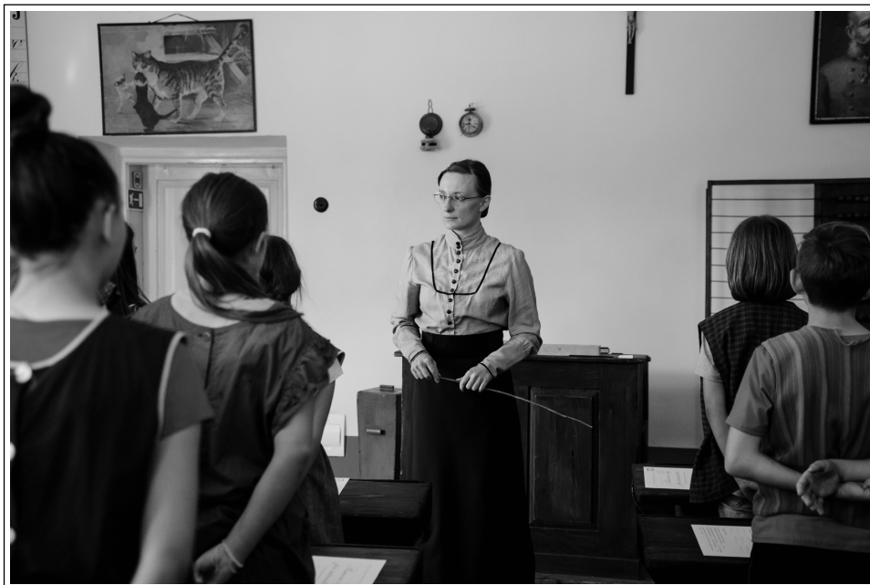
Učna ura računstva v SŠM, 10. maja 2018

tako pri izvedbah starih učnih ur kot tudi pri številu obiskovalcev. Dobri rezultati so bili doseženi tudi pri pedagoških programih zunaj matične stavbe. V muzejski zbirki v Hra- stniku je bilo izvedenih 9 starih učnih ur Lepopisja za 4. razrede osnovnih šol iz Zasavja (304 učenci), drugod po Sloveniji pa še 7 pedagoško-andragoških projektov, na katerih je brez izdanih vstopnic sodelovalo 1408 udeležencev.