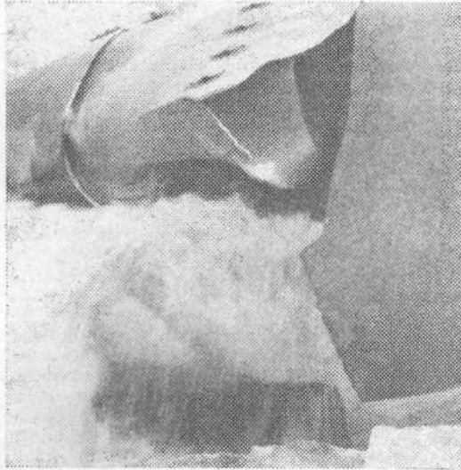
Jeseniška četa je v noči na 5. 8. 1941 razstrelila akvadukt za elektrarno v Zasipu pri Bledu