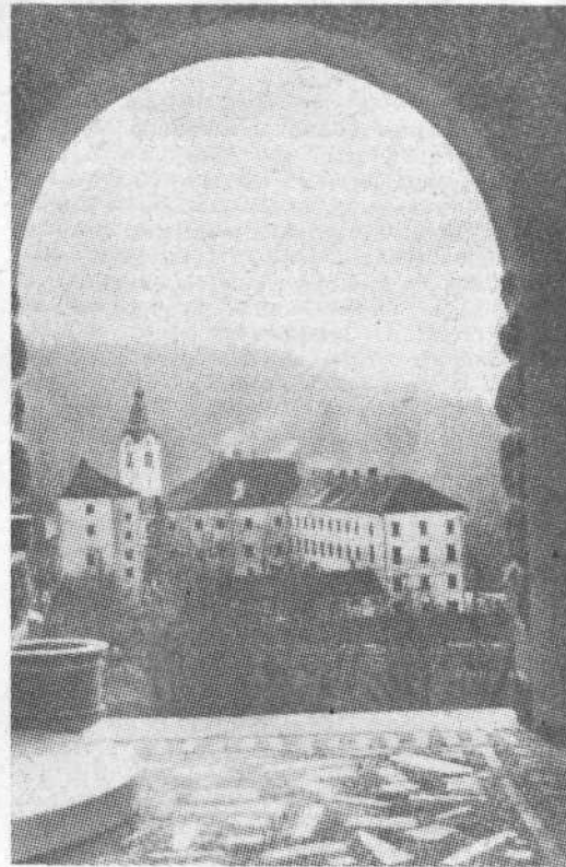
Grad Begunje, zloglasna nemška jetnišnica in mučilnica slovenskih rodoljubov