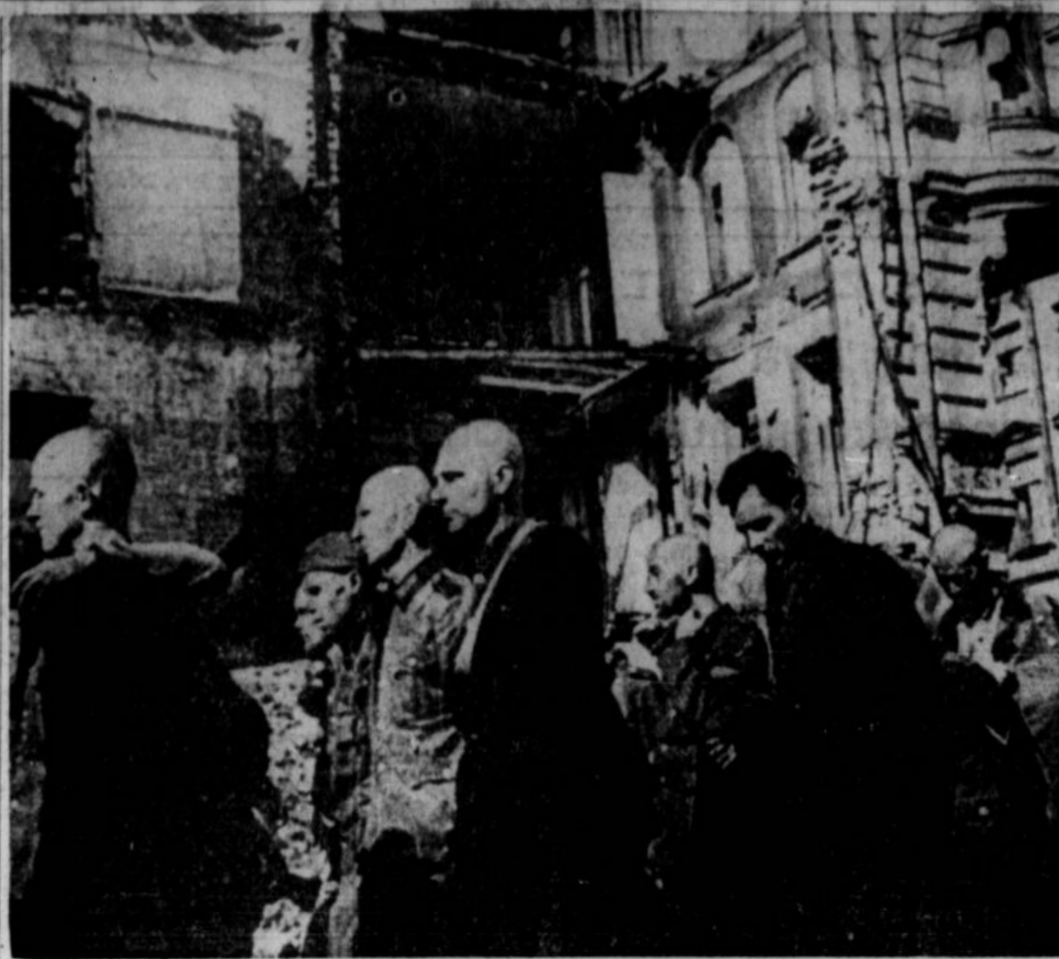
Naciji so končno le prišli v Stalingrad, toda ne zmagovalno teševč kot ujetniki. Nekaj jih je na gornji sliki. Nekateri so črtili po glavah in brez suknj. Hitlerjeva armada je izgubila v bitkah pri Stalingradu 330.000 mož. To je silen udarec tudi za tako veliko armado kakor je nacijaka. Pred nekaj meseci je Hitler odločno zagotovil, da bo njegova armada gotovo prišla v Stalingrad — in je res, toda v popolnoma drugačni vlogi kot pa ji je določil njen firer.

Stari sistem posejdujočih, ki je od pamtveka bil zidan na garačih in brezpravnih, se ne bo podal kar tako. Zato tudi toliko nesoglasja med vladami "združenih" narodov, ki ga fašizem sebi v prid v zavezniških deželah neumorno izrablja.