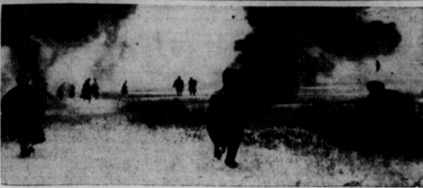
Začiteni z dimom so ruske čete napadale nemško armado okrog Stalingrada, jo odrezali in oblegali, dokler so ni koncem januarja vsa podala.

Tiho je prišel večer, pel uspravanko nad kočami in šele stal nad glavam otrok, ki so spali na pragih. Mica s je prebudila. Začudeno je pogledala v mrak, planila pokonci, zagrabila svojo cizo ter jo peljala dalje in govorila sama s seboj: "Jezus, človek malo za droblje, da je noč nad njim. Ko bi le delavniki ne bili tako kratki!"