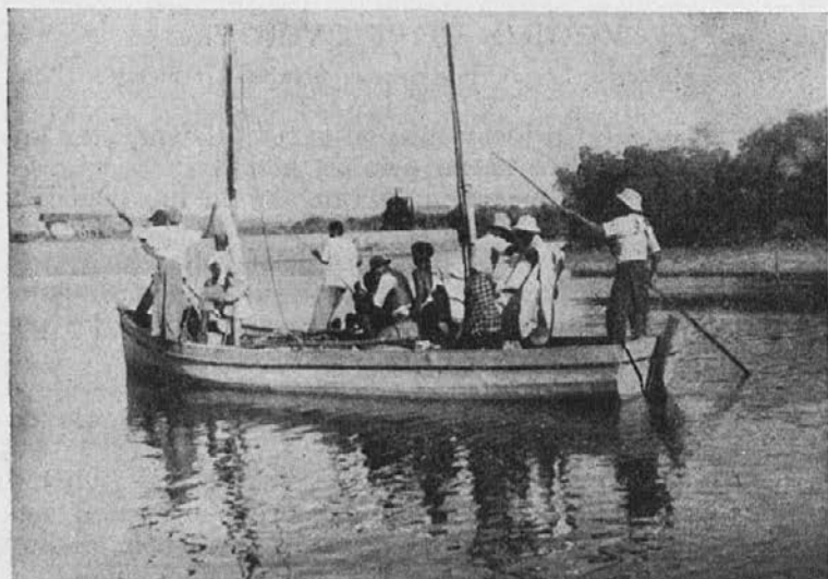
Misijonar se pelje v čolnu s svojimi zamorci v nov misijon.

za delo. Tudi k pouku redno hodijo. Nauk božji mogočno vpliva na duše dobrih poganov. Če bi jih leta in leta poučeval, bi ne opravil v njih dušah tistega dela, kot ga je vzbudila ta — lahko rečemo — prerokba božja.