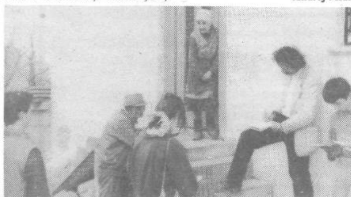
Raziskovalci pri Koštvu na Osovniku