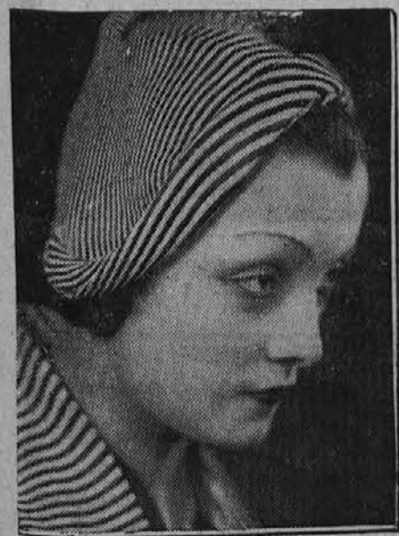
Nove vrste kloubuk z belimi in modrimi progami

Neki veliki pariški dnevnik je zastavil svojim čitateljicam vprašanje, kateri poklic bi si izbrale, če bi smele same voliti. Odgovori so bili presenetljivi za uredništvo in javnost: med več tisoč odgovori mladih deklic in žen se jih je nad 70 odstotkov glasilo na "poklic" zakonske žene. Tudi to dokazuje, da se želje deklet v l. 1934 popolnoma strinjajo z željami deklet pred sto leti.