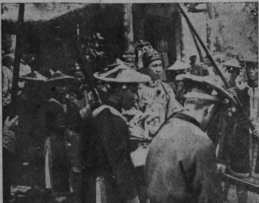
Svečanosti povodom poroke anamskega vladarja Bao-Daja z gospodično Nguhen Hue Hao