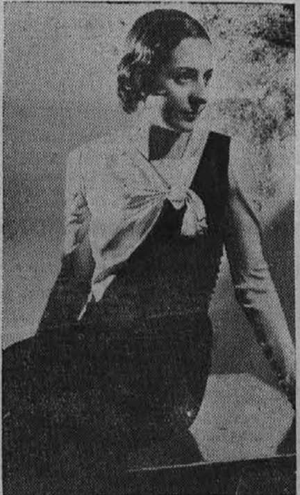
Lepa večerna obleka

Čevlji ohranijo dolgo lepo obliko, ako jih vsakokrat takoj, ko jih sezujemo, natakemo na kopita, in to dokler so še topli. Tako naj stoje, dokler jih iznova ne obujemo. Za vsak par čevljev moramo torej imeti posebna kopita, ki se docela prilagajajo obliki dotične obutve. Potem se na usnju ne delajo gube in ohranijo čevlji, tudi če so že stari in ponošeni, lepo obliko. Denar, ki ga enkrat izdamo za kopita, se nam dobro obrestuje. Za čiščenje uporabljamo vedno svetlejšo kremo, nego je barva čevljev, ker s časom usnje itak potemni.