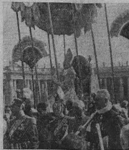
Slika z rimskih svečanosti povodom kanonizacije Don Bosca: Papež Pij XI. blagoslavlja množico

Iz tega razloga je verjetno, da angleški industriji ukrep vlade ne bo mnogo pomagal. Tudi je že sedaj gotovo, da bodo Japonci začeli siliti na mnoga nevtralna tržišča, kjer so doslej gospodovali angleški izvozniki. Z vzhodnih tržišč se bo boj prenesel na druge trge, pred vsem na južnoameriške. In kar bo angleška industrija na eni strani pridobila, bo na drugi zgubila.