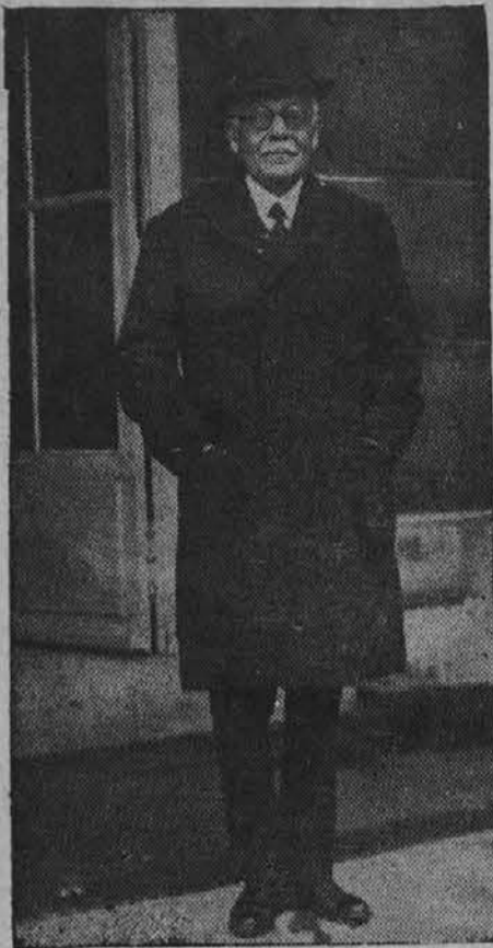
Lord Tyrell, angleški poslanik, ki je bil prēmesečen iz Pariza

Vnetje slepiča ni samo življenju skrajno nevarna, zahrbitna bolezen, temveč pomembna tudi v narodno gospodarskem pogledu. V Nemčiji oboli zanjo letno n. pr. preko 200.000 oseb, ki porabijo za zdravljenje preko 30 milijonov mark, ne glede na škodo, ki sledi iz izgube dragocenih delovnih sil.