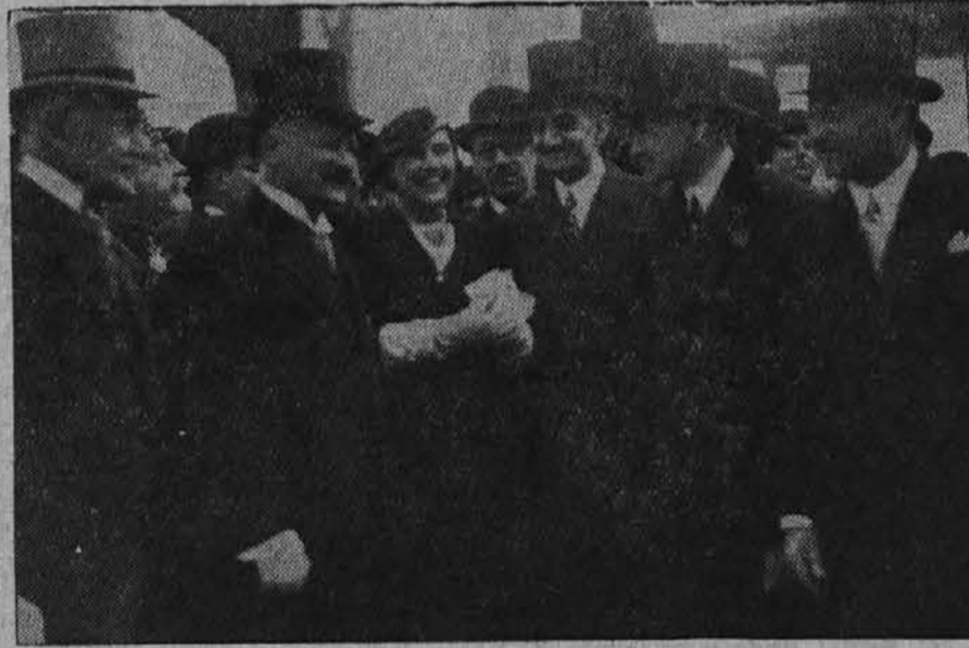
Francoski predsednik Lebrun na dirkališču v Auteulu