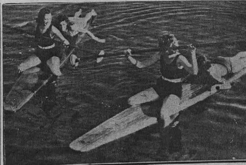
Kako si kalifornijske lepoticke preganjajo dolgčas v kopališčih