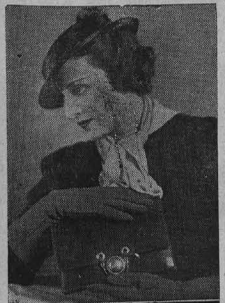
Lepa usnjata torbica in rokavice po zadnji modi

Drug čitatelj, ki je ves dan v borznem trušču, je menil: Z absolutno tišino. — Tretji uradnik pa; ko pridem domov, si želim najti copate