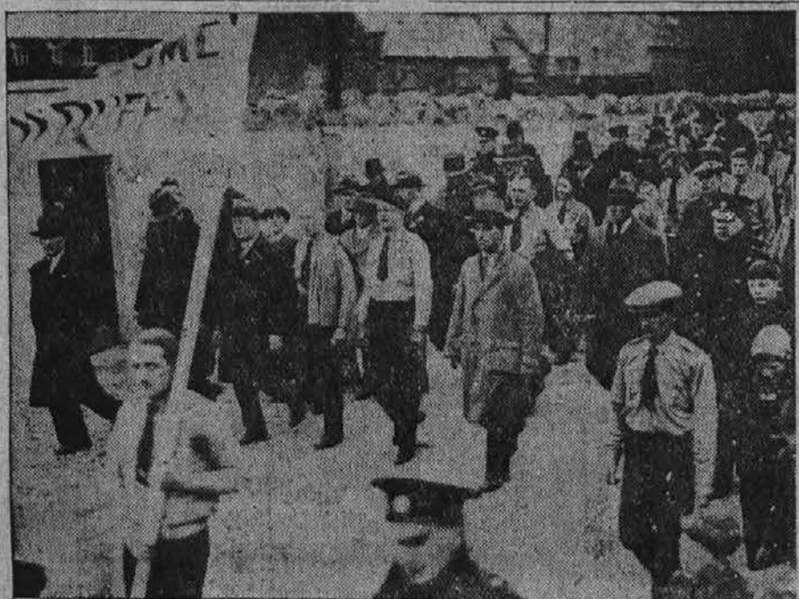
Irski fašisti v sprevodu. Na čelu stopa njihov voditelj general O'Duffy

V zadnjih dneh so se oglasili razni posredovalci, posebno iz mohamedanskega sveta, ki bi radi videli, da se boj med pristaši iste vere čim prej konča.