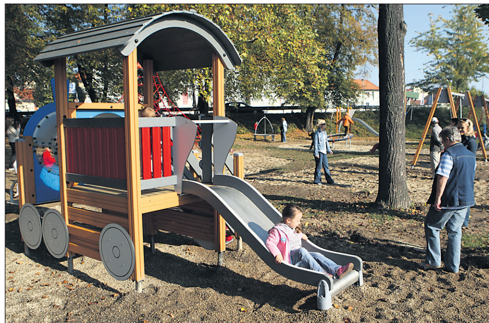
Pri izbiri lesenih igrač dajemo poudarek varnosti, prednost naj imajo tiste iz trdega lesa, ki se ne lomijo in ne vsebujejo zdravju škodljivih sestavin.