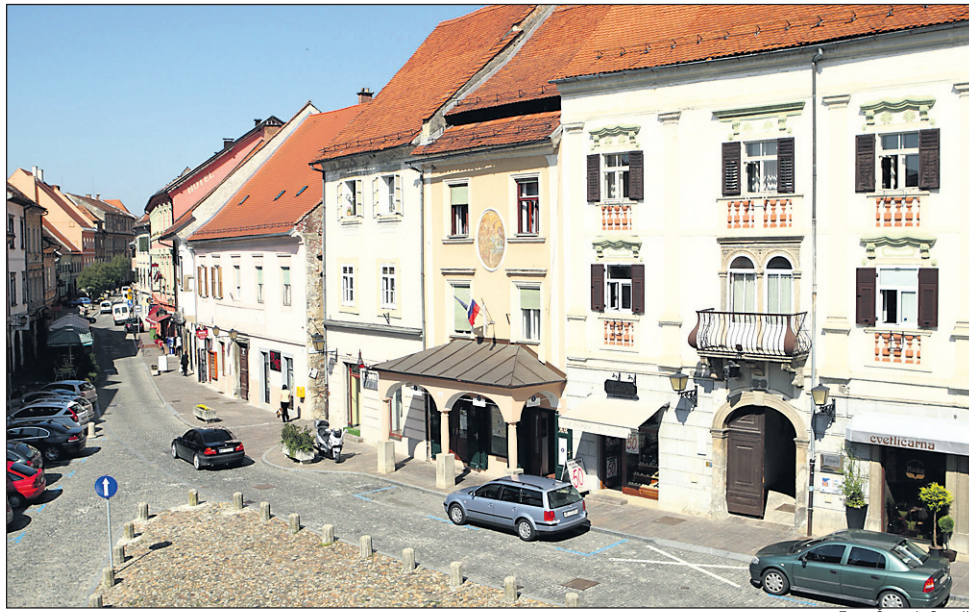
V svetniški skupini DeSUS predlagajo vikend zaporo Slomškove, Slovenskega trga in dela Prešernove ulice do priključka na Cankarjevo ulico.

ni vodniški službi turističnega območja MO Ptuj strokovno usposabljanje za turističnega vodnika organizira podjetje Javne službe Ptuj, d. o. o., ki je za letošnje strokovno usposabljanje izbralo Ljudsko univerzo Ptuj. Izobraževanje bo potekalo ta konec tedna. Udeleženci turističnega izobraževanja, ki ga mesto organizira po nekaj letih, bodo spoznali zgodovinske in geografske značilnosti mesta in okolice, spoznali naravno in kulturno dediščino turističnega območja MO Ptuj, etnološke znamenitosti in posebnosti, turistično ponudbo turistične destinacije Ptuja in okolice, prav tako pa bodo osvojili sposobnost komuniciranja s turisti, spoznali in osvojili tehnike sprejemanja gostov, vodenja in oskrbe turističnih skupin in še marsikaj drugega, kar zahteva turistično vodenje. V strokovno usposabljanje s preizkusom znanja se lahko vključijo vsi, ki imajo najmanj srednješolsko izobrazbo in znajo en tuji jezik. Ž