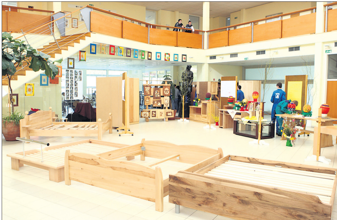
Z razstave izdelkov iz lesa na Lesarski šoli Maribor.