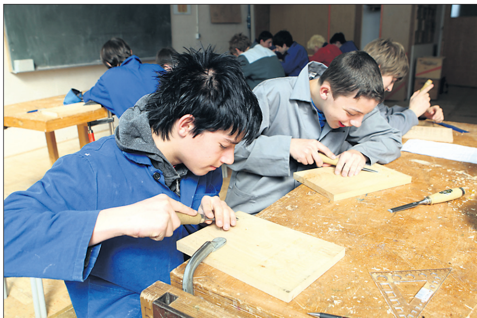
V prenovljenem programu Mizar je delo bolj usmerjeno v dijaka, ne toliko v samo učno snov.