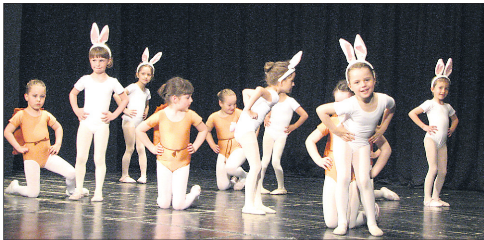
Ježki in Zajčki baletne pripravnice so s svojo ljubkostjo in neposrednostjo osvojili srca gledalcev.