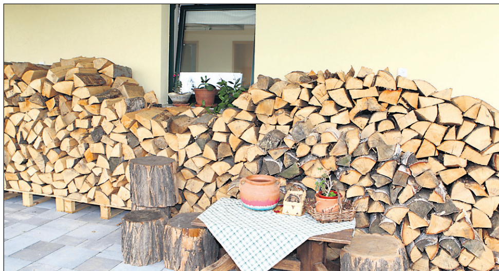
Les kot gorivo postaja ponovno pomemben.