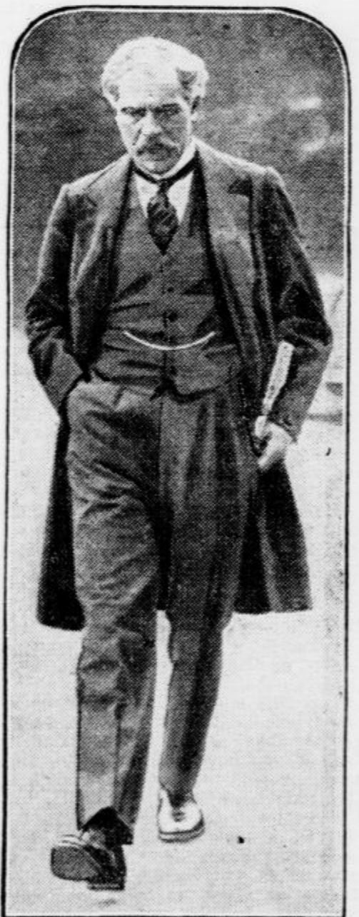
Ramsay Macdonald, bivši predsednik angleškega ministrskega sveta, sedaj lord-predsednik tajnega sveta, je 12. t. m. obhajal 70 letnico rojstva