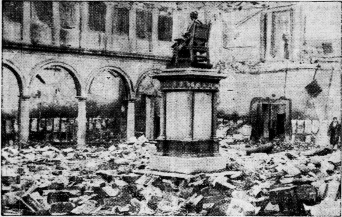
Pogled na dvorišče, kjer je vse v neredu. Na svojem mestu je ostal edino spomenik...