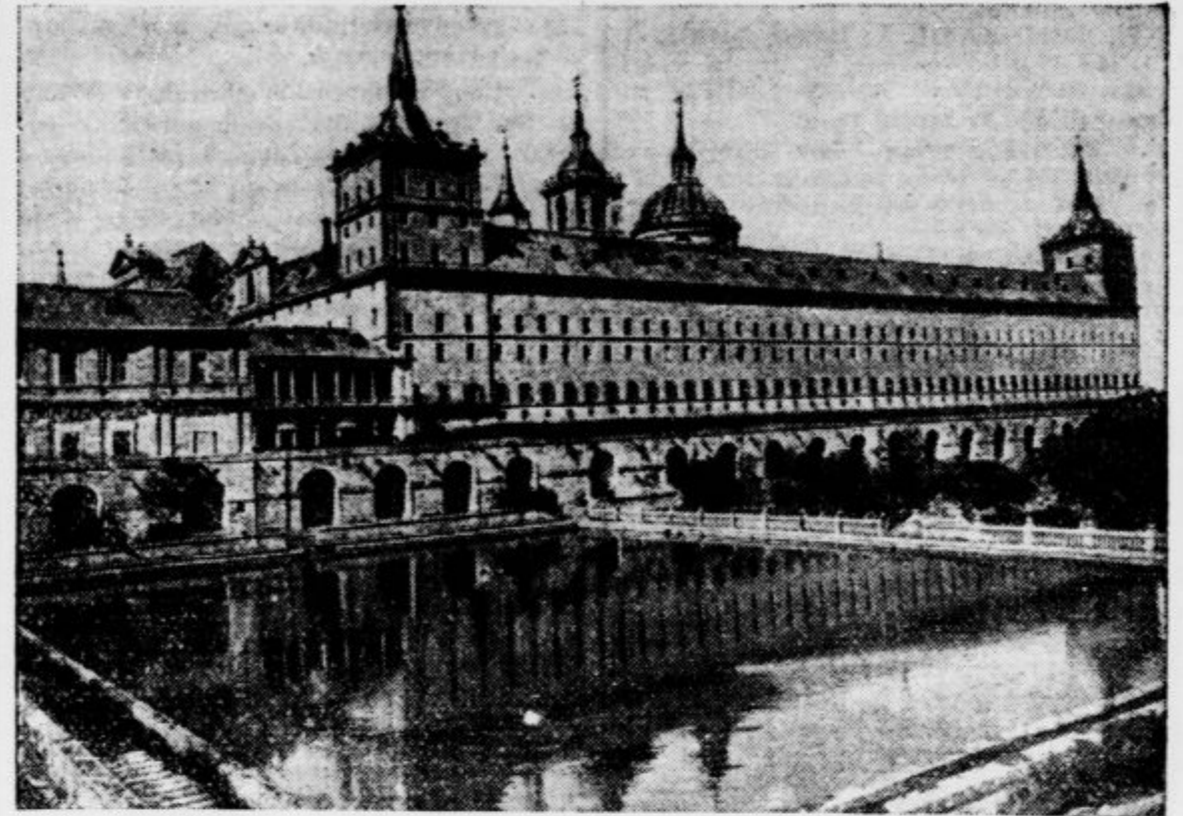
Cete generala Franca in Mole se s vsakim dnevom bolj približujejo španski prestolnici, zato se z zanimanjem sprašuje svet, kakšna bo usoda slovitega Escoriala