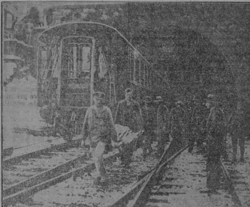
Žrtve tunelske nesreče pri švicarskem mestu Luzern odnašajo.