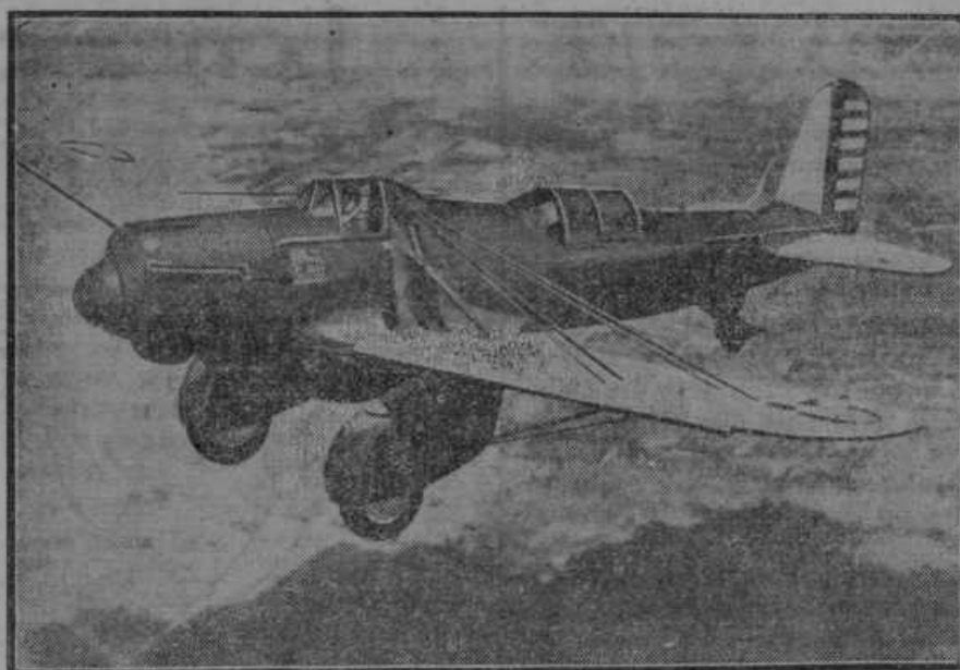
Leteča trdnjava se imenuje najnovejše ameriško bombno letalo, ki proizvaja 650 k. s., poseda 5 strojnic in celo skladišče za bombe.

V argentinski pokrajini Entre Ris se je pojavil pred kratkem roj kobilic, ki je doslej največji. Po obsegu je meril 25 km in je letel 4 km na goso. Kjerkoli se je spustil na tla, je preostala tekem nekaj minut samo še gola zemlja. Med take roje se ne sme podati aeroplan, sicer bi bil zgubljen. Celo železnica ni mogla voziti, saj so bile tračnice po cele metre visoko pokrite s kobilicami.