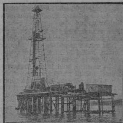
Olje pridobivajo naravnost iz na dnu morja ležeče žile pri severnoameriškem mestu Los Angeles. — Levo: Viharna nesreča v japonskem mestu Jokohama. Podrtih je bilo 500 hiš in 50 oseb pa ubitih.