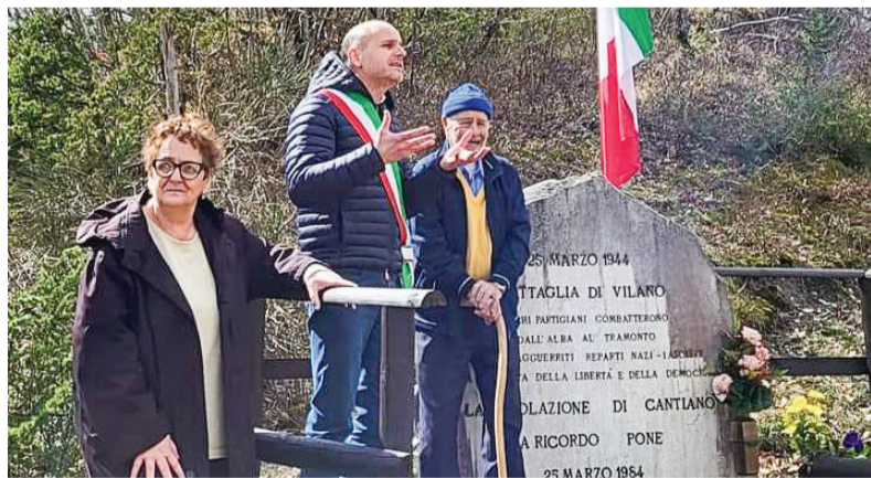
Spominsko obeležje v hribih nad Cantianom

ANPI iz Cantiana (srednja Italija) je v sodelovanju z občino in tamkajšnjo šolo pripravil slovesnost v spomin na bitko pri Vilanu 25. marca 1944. Bitka je potekala pod goro Catrio. Nemci in fašisti, bilo jih je okoli 500, so poskušali takrat uničiti odreda Fastiggi in Pisacane V. brigade Garibaldi, ki sta štela 80 borcev. Med njimi so bili tudi jugoslovanski partizani, ki so se po kapitulaciji Italije in osvoboditvi koncentracijskega taborišča Renicci vključili v italijanske enote. Med