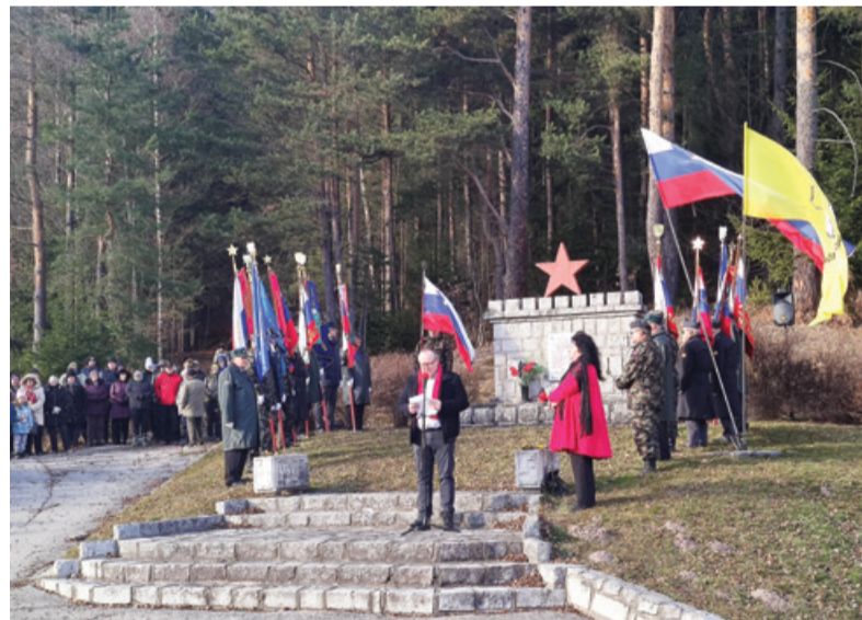
Spominska slovesnost ob obletnici ustanovitve brigade