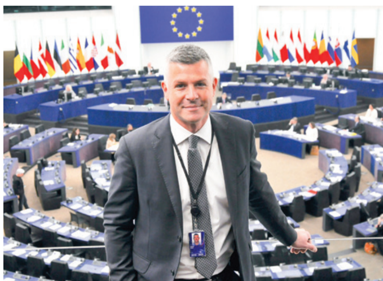
V evropskem parlamentu

ter rasnim in verskim predsodkom, izrekajo odločen ne, žal pa še vedno ostaja težnja nekaterih, da bi te vrednote zrušili ter med ljudi vnesli sovraštvo, nestrpnost in razklanost. Zato je še toliko bolj pomembno, da mlajše generacije ozaveščamo, jim predajamo to dediščino ter jih seznanjamo z zgodovinskimi resnicami. Samo tako se bodo lahko opolnomočene soočile z vse bolj pritajenimi, a nič manj nevarnimi idejami, ki želijo spodjedati temelje naše skupne evropske ideje. Zato je pomembno, da tudi sam kot evropski poslanec po svojih najboljših močeh širšemu evropskemu prebivalstvu prena-