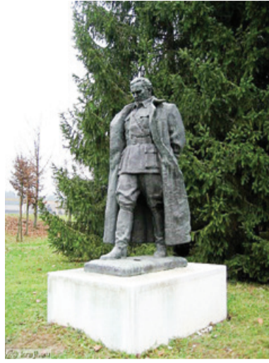
Josip Broz Tito je umrl 4. maja 1980 v Ljubljani.

S samoupravljanjem in uvedbo delavskih svetov v podjetjih (prvi delavski svet je bil v cementarni v Solinu pri Splitu) se je Jugosla-