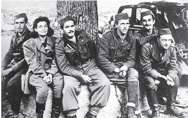
Kajuh v partizanih

Nekatere Kajuhove pesmi se pojavljajo v več različicah, odvisno od tega, kaj so izdajatelji novih izdaj imeli na voljo: rokopise, različne objave v pred- in medvojnem tisku, prepise, spominske zapise.