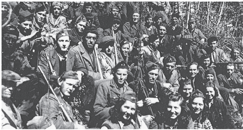
Erzeljci pred odhodom na Dolenjsko marca 1943