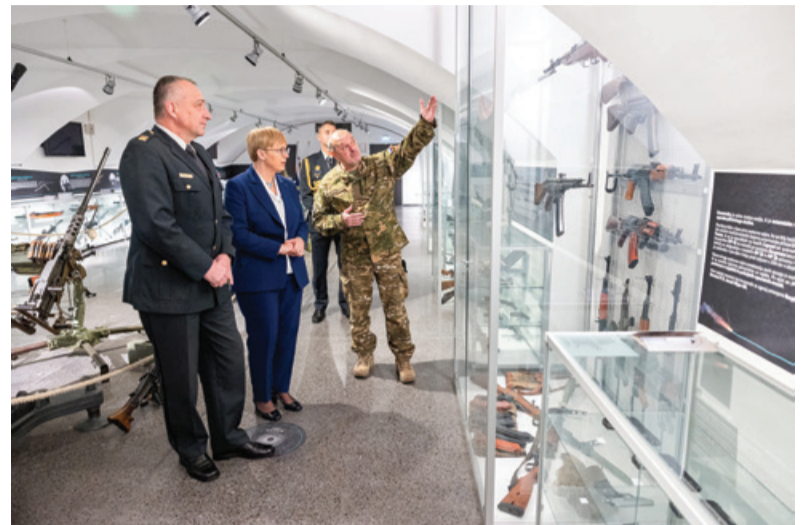
Predsednica Slovenije si je ogledala tudi Muzej Slovenske vojske.

Znanje in izobraževanje sta pomembna tudi zaradi učinkov globalizacije ter sodobnih mednarodnih varnostnih izzivov, soočanja s hibridnimi grožnjami, dezinformacijami, učinki podnebne spremembe, rabo prebojnih tehnologij in dvonamenskih produktov. Zato sta nujna povezovanje in sodelovanje s civilnim okoljem ter z domačimi in tujimi izobraževalnimi ustanovami. »Danes je treba vojaške profesio-