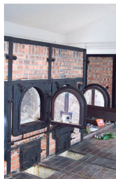
Koncentracijsko taborišče Buchenwald

28. aprila 1945 so italijanski odporniki ustrelili fašističnega diktatorja Benita Mussolinija, njegovo truplo pa skupaj s