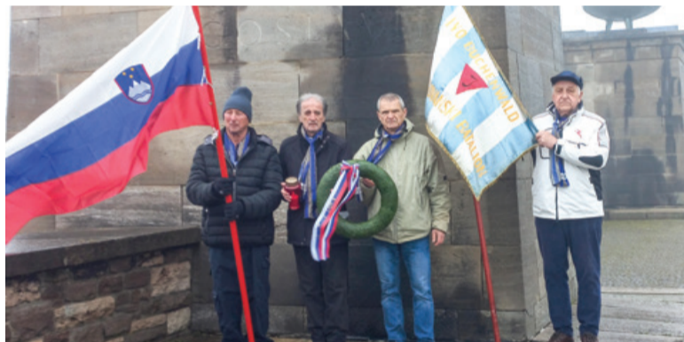
Polaganje venca v spominskem parku v Buchenwaldu

nekdanjem taborišču, kjer je bila tudi osrednja spominska slovesnost. Tradicionalnega srečanja se je udeležilo še pet preživelih taboriščnikov iz Poljske, Nemčije, Francije, Izraela in ZDA.