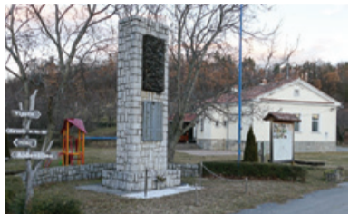
Spomenik padlim in žrtvam na Erzelju