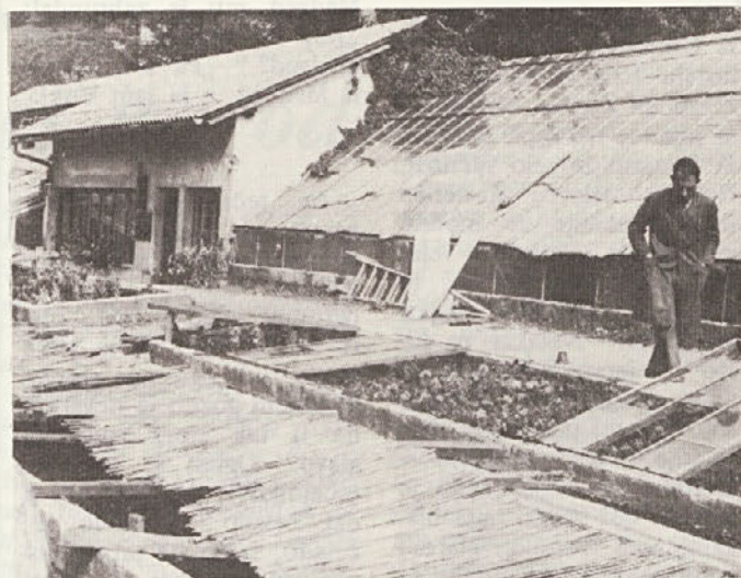
Že sam pogled na staro vrtnarijo, stisnjeno med Cesto herojev in Krko kaže, kako potrebna je bila nova lokacija. Spodaj vidimo