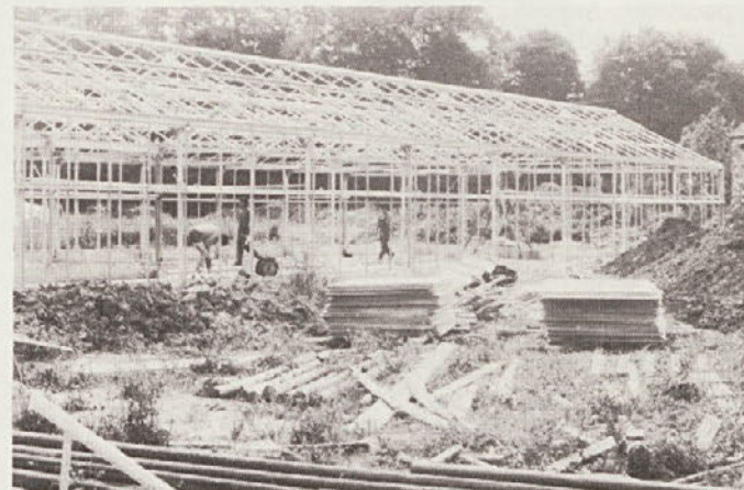
... novi rastlinjak med gradnjo.