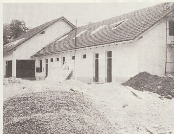
... novo stavbo in