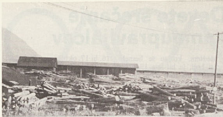
Hitro odpremljanje lesa in zmanjševanje zalog je tudi prispevek k boljšemu gospodarjenju.