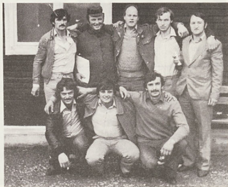
Ekipa gozdarjev iz Trebnjega na tekmovanju v Črmošnjicah.

Večino del so opravili z lastnimi stroji. Le za pomoč pri zemeljskih delih so najeli 22-tonski buldozer (rinež) po-