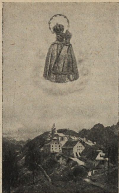
Marija Višarska in božjepotna cerkev

je nihče ne spoznal in mogel do njenega srca.