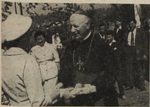
Zastopnica slovenskih mater iz vzhodne Francije pozdravlja g. škofa v Habsterdicku (30. VI. t. l.)

Večkrat prav malo mislimo. Pridemo v družbo in začnemo piti. Najprej iz žeje. Nato iz zabave. Nato iz časti: če je oni plačal, moram tudi jaz. Koliko koristnega pa bi naredil tisti, ki bi rekel: Vi ste dali za vino, jaz pa bom dal za naš izseljenski list! Denarja za gostilničarje bogateli ni škoda. Naš izseljenski list, ki nima nobenih darov in fondov, naj od zraka živi! Kdaj bomo dobili prvega rojaka, o katerem bomo čuli, da je v oporoki zapustil, recimo 100.000 francoskih frankov za izseljenski list? Ali ne bi bilo lepo, če bi v „Naši luči“ brali: Namesto cvetja na grob prijatelju N. N. smo zbrali znanci 1000 belg. frankov za naš izseljenski list. Cvetje se vidi navadno le par ur. Nato se pusti, da zgine na gro-