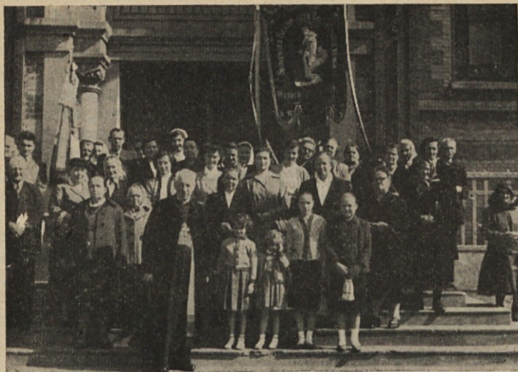
Slika na levi: škof dr. Gregorij Rožman pri rojakih v Sallauminés v severni Franciji (17. junija 1957). — Slika spodaj: Domač razgovor med rojaki in g. škofom v Loiret v Franciji (10. junija 1957).

Ob tej nedelji je pa tudi prilika, da izseljenci naredimo vprašanje vsak zase. Ali smo v zadnjih letih storili svojo dolžnost do naroda, s katerim vred hodimo po tujimi? Zlasti izobraženci naj se vprašajo: Koliko smo naredili, da se naš živelj v tujini ohrani, opomore in njegov položaj izboljša? Seveda noben izseljenec ne more biti izvzet od tega izpraševanja vesti: Marsikje bi lahko ustanovili slovensko društvo! Marsikdo bi lahko še prišel k slovenskim prireditvam, na slovenska romanja in k slovenskim službam božjim. Treba je preiti k splošni mobilizaciji vseslovenskega življa v tujini. Vsi se moramo zbrati, povezati in si drug drugemu pomagati. Vsak naj začne pri sebi in v svoji okolici.