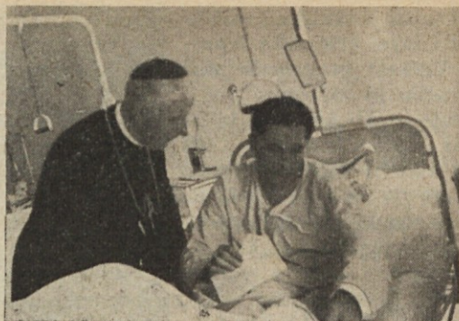
Prezvišeni pri enem od naših bolnikov

„Pozdravljen, višji naš pastir! Prinesi blagoslov in mir. Ne prosimo zlata, srebra in ne bogastva tega sveta. Pač prosimo, da bi ta dan po Tvojih rokah bil poslan obilen blagoslov z neba in božji mir nam vsem srca. Da vsi kot vrli bi kristjani nekdaj pri Bogu bili zbrani! Zato pozdravljen, višji naš pastir! Prinesi blagoslov in mir! A v znak hvaležnosti srca — podajamo Ti šopek ta . . .”