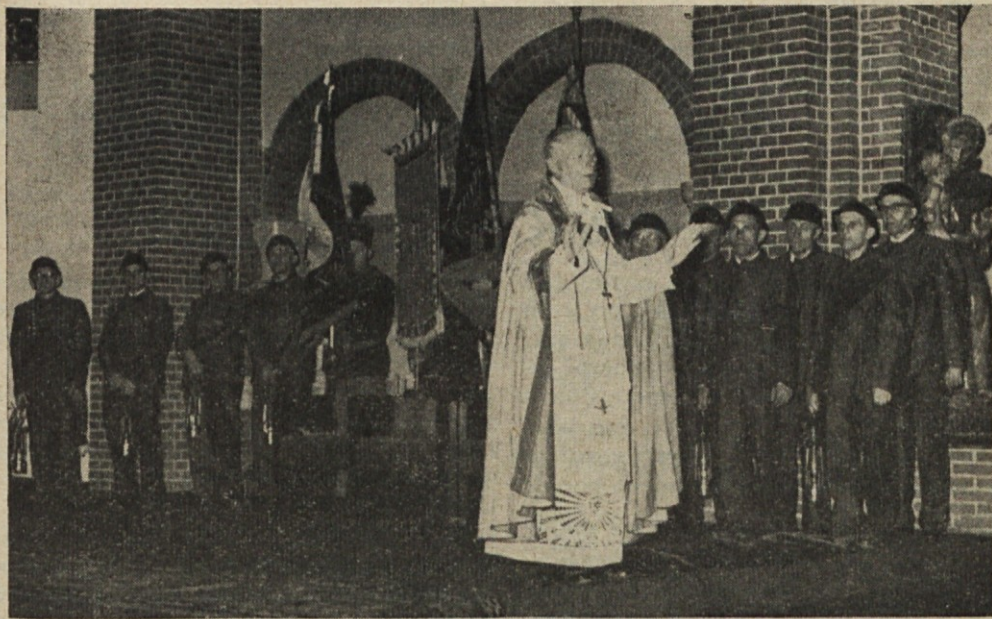
Častna četa naših rudarjev v uniformah in z našimi društvenimi zastavami med škofovo pridigo v Heerlenu na Nizozemskem (14. julija t. l.)

vprašalnih pol, ko se drugače toliko denarja razsipa? Pa pustim to v razmišljanje rojakom, ki bodo sami s pametjo dognali, da naš narod nima še vseh pravic v Jugoslaviji, kjer na železniških postajah in poštinih žigih v slovenskih krajih še vedno vidiš cirilico oziroma nepoznane „buchstabe“. V Belgiji so