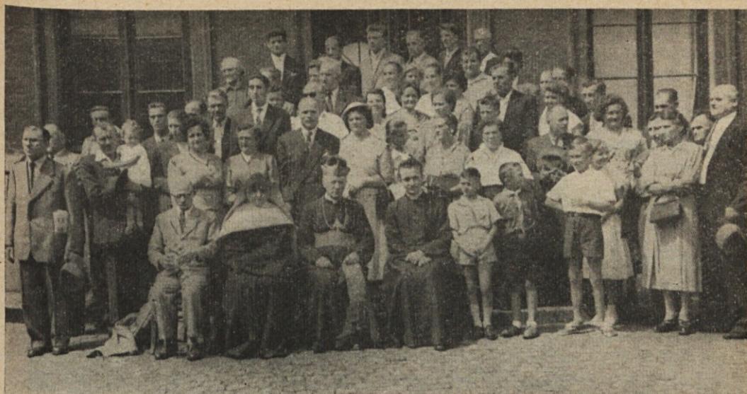
Del Slovencev in Hrvatov po škofovi službi božji v Seraingu v Belgiji (7. julija t. l.)

v domovini svoj les ali gozd. Pismo je dobila naj s pripombo, naj ga prestavi v nizozemščino, ker ga ne razumejo.