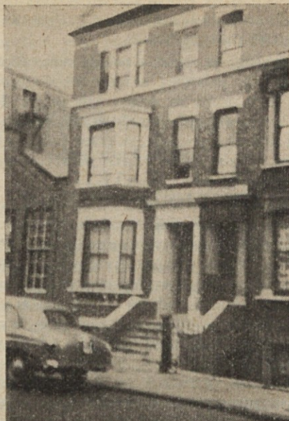
SLOVENSKI DOM v Londonu

V Fatimi so našemu g. škofu izkazali vidno pozornost in maloštevilni slovenski udeleženci kongresa smo bili veseli, ko je zadonela pri glavni sveti maši v fatimski baziliki tudi slovenska beseda slovenskega vladike. Zaradi večine drugih, zlasti nemških udeležencev kongresa je g. škof nadaljeval pridigo v nemščini. Pri sv. maši sta mu stregla dva slovenska bogoslovca, ki študirata za duhovnika in ju je pot po Evropi zanesla tudi v Fatimo.