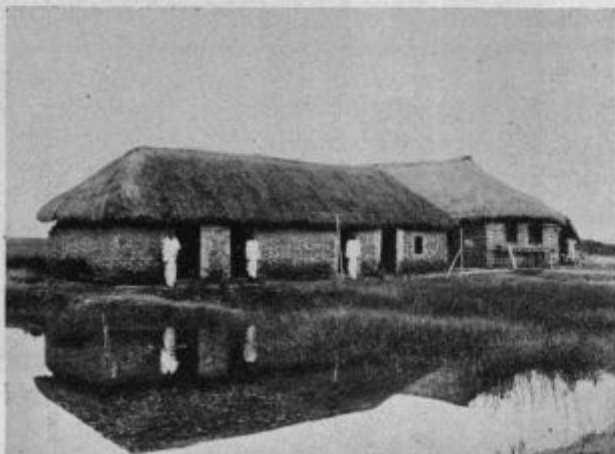
Stanovanje naših bošontskih katehisiou (Spredej katehstii)

Ko se je po dolgih urah vsaj malo pomirjena vračala iz cerkve, jo je zunaj prestreigel Patrik: