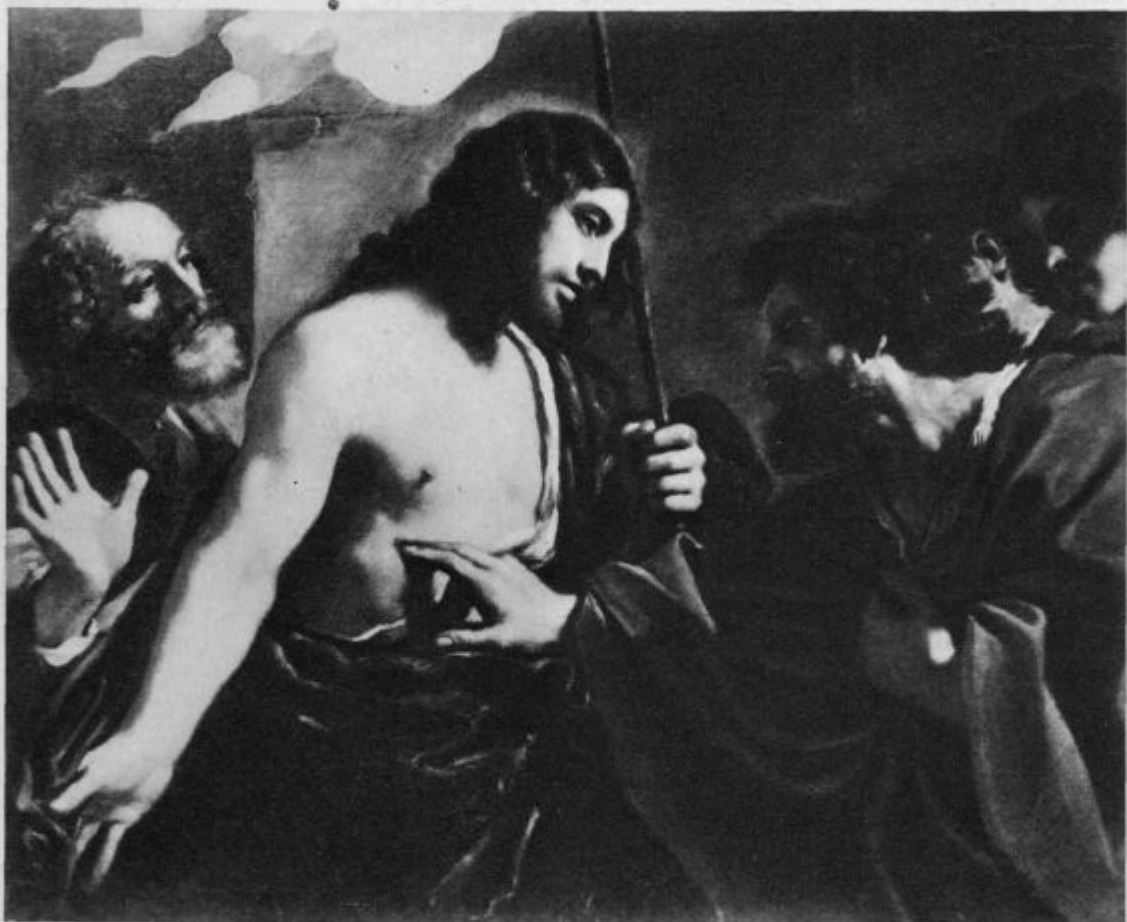
Jezus se prikaže apostolu Tomažu

Do nedavno je spadal Berlin pod škofijo Breslau (Vratislava) v pruski Šleziji. Breslavska škofija je ena največjih, če ne sploh največja na svetu. Štela je, dokler se ni Berlin odcepil, tri milijone duš. Edino Kolin in Pariz sta po številu duš približno enako veliki ško-