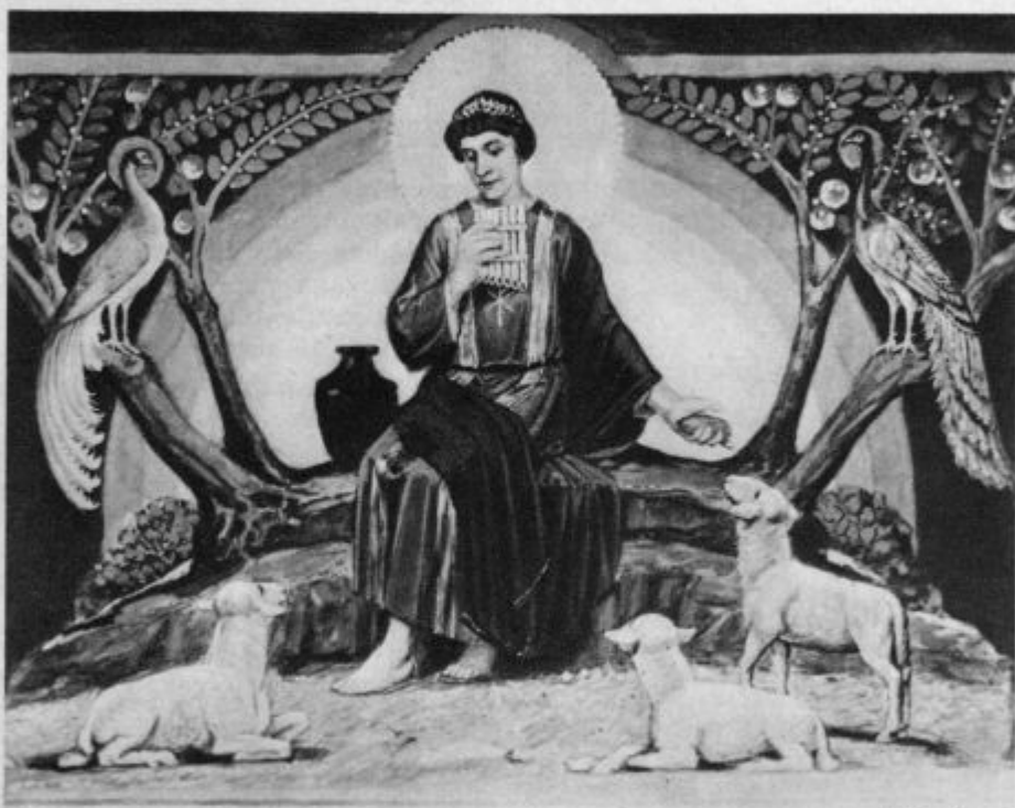
Dobri Pastir vabi...