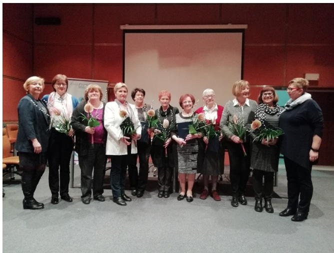
Častne članice ZPMS