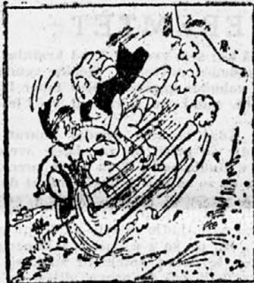
»Veste, bojim se! Se nikoli se nisem peljala z motorjem!« »Niš se ne bojte! Saj se jaz tudi še nisem nikoli...«