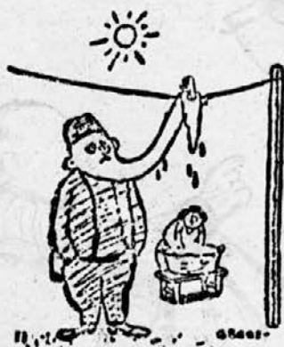
Novatorski predlog za pranje dedkove brade.