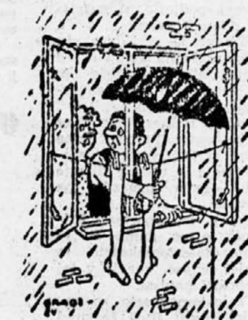
»Jaz nisem kriva, da danes dežuje. Toda nogavice se morajo posušiti!«