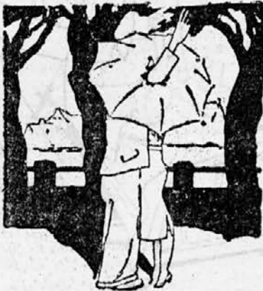
Prisega zvestobe ob slabem vremenu...