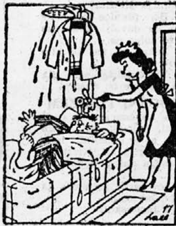
»Vstanite, tovariš! Naročili ste, naj vas zagotovo zbudim...!«