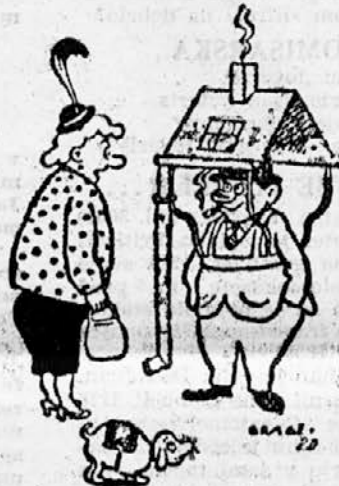
»Vedno sem si želel, da bi imel lastno streho nad glavvo...«