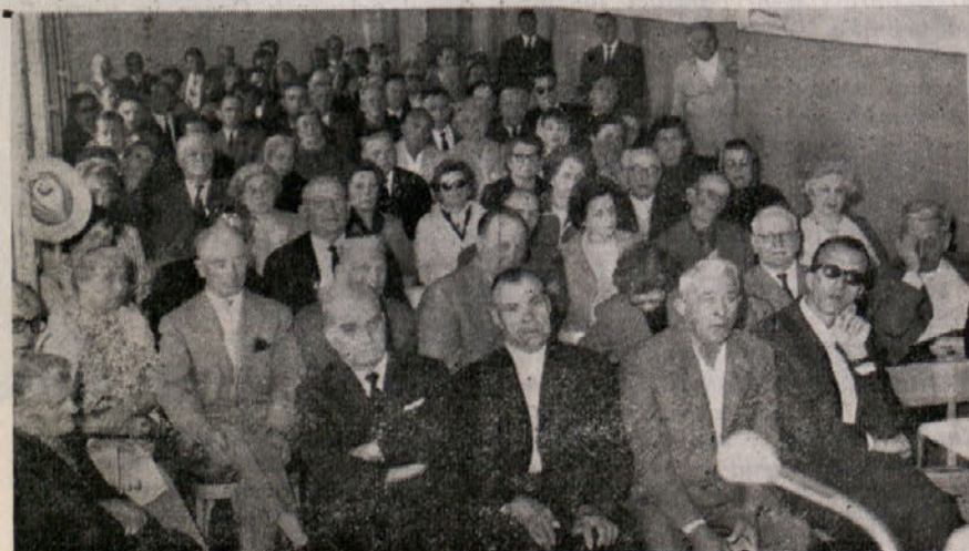
V nedeljo dopoldne je bil v Trstu kongres pokrajinske Zveze bivših političnih deportirancev. Kongres se je vršil v sindikalni dvorani «Di Vittorio». Prejšnji odbor Zveze je poročal o svojem delovanju, nakar je bil izvoljen novi odbor

Dosedanja naročnina za pol leta je 700 lir, za eno leto pa 1.300