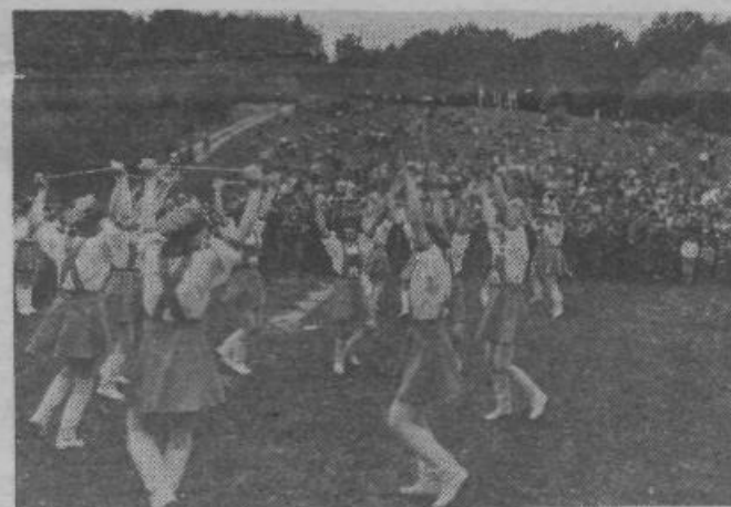
V kulturnem programu so sodelovali: pevska zbor Litostroj in Višnja gora, Kulturno društvo France Prešeren iz Račne ter dve godbi na pihala - litostrojka in slovenskih rojakov iz Proseka pri Trstu. Posebnost je bil vsekakor nastop mažoret iz Ljubljane.