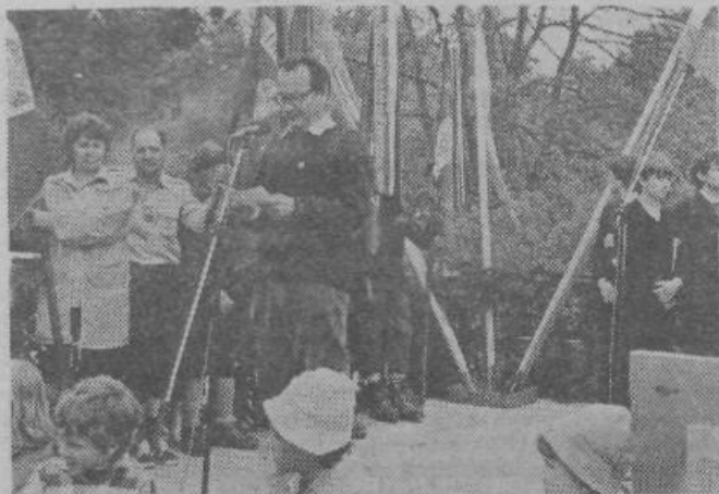
V nedeljo, 27. maja so se zbrali planinci na XIV. planinskem taboru na Polzevem. Večina obiskovalcev je prišla s posebnim vlakom iz Ljubljane do Žalne oziroma Višnje gore, nato pa peš do Polzevega.