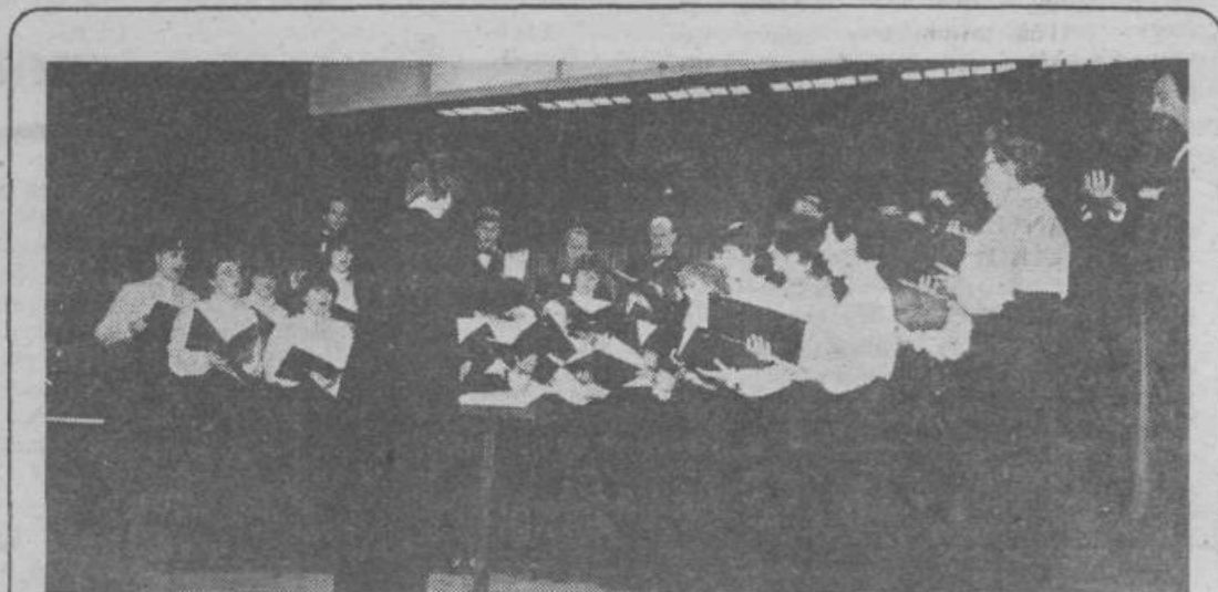
KONCERT MEŠANEGA PEVSKEGA ZBORA GLASBENE MATICE IZ LJUBLJANE — V petek, 1. junija 1984 je v dvorani kulturnega doma Grosuplje gostoval mešani pevski zbor Glasbene matice iz Ljubljane. Maloštevlnemu občinstvu je predstavil 14 pesmi. Zbor sodi med kvalitetnejše pevske ansamble v naši republici, zato se upravičeno sprašujemo, kako to, da je pel pred domala prazno dvorano.