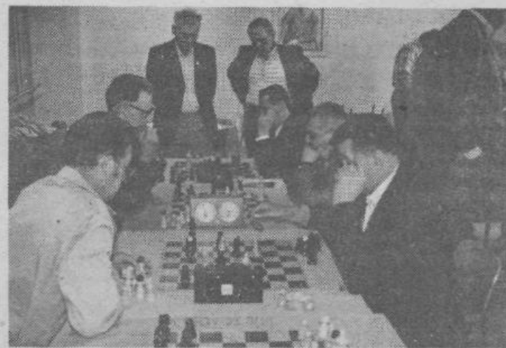
Razmišljanje ob šahovnicah