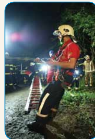
DOSTA SE LEKO NAVČIMO... stran 10