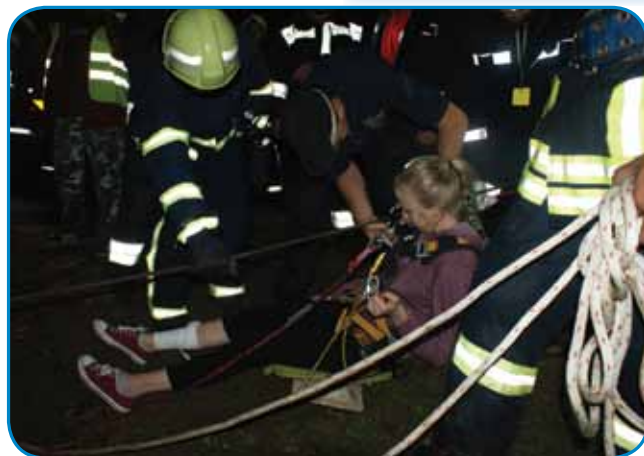
Gasililci-alpinisti iz Egyházasrádóca so rejšili mlado deklö, štera je spadnila v globko djamo

Gda so gasilci vse mlajše najšli v kmičnom lesej, so mogli oditi dale, vejpa so zvödali, ka ležijo ništerni mladi turisti pod drejvami pa vejami, štere je viher vtrgno. Za tau vajo so nücali