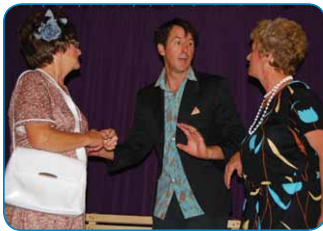
Z Veselimi pajdaši

»Moja velka ljubezen je tudi gledališče, samo zdaj ka mam dvoje male dece, nega cajta za tau. Vsevküper mam štiri mlajše, dva sta že vekšiva. Petnajst lejt sam na Can-