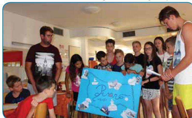
Predstavitve Pirana in njegovih znamenitosti števanovskih učencev in dveh gimnazijcev

učencem in njihovim spremljevalcem. Hvala za vaš trud – vsakomur posebej!