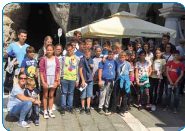
Zadnja skupinska slika pred vhodom v Postojnsko jamo

Pa ne samo to. Učenci so imeli možnost s pomočjo zunanjih predavateljev pobližje spoznati še svet delfinov (Društvo