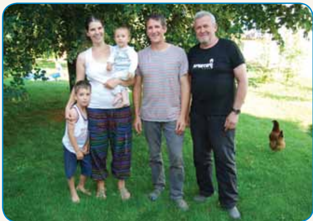
FOJZOV POJEP, STERI RAD PIŠE PESMI IN ŠPILA NA ODRI stran 5