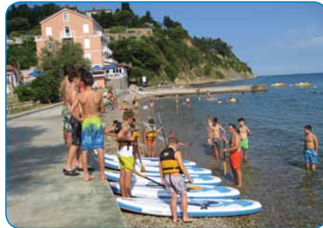
Letošnja novost: šport supanje

za obisk butikov pa razstave kač ... ali preprosto za uživanje v hoji ob morju, opazova-