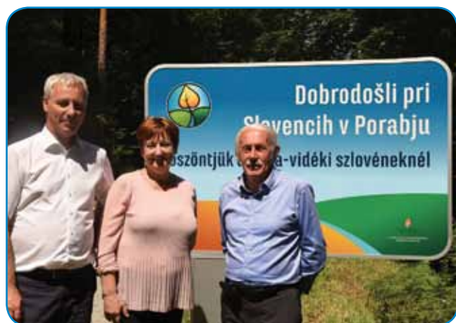
Gost si je ogledal tudi nove dvojezične table, ki pozdravljajo goste, ko prihajajo v Slovensko Porabje

javnostih in nočnem spanju ni bilo telefonov in ponoči je bila tišina. S tem so bili seznanjeni vsi, ki so se odločili za letošnjo zgodbo.