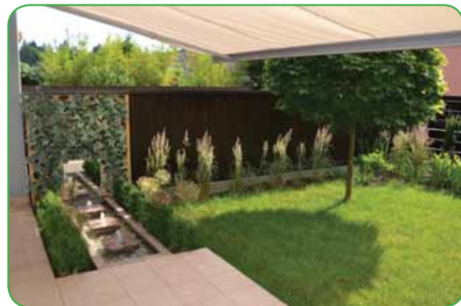
Trave in vodni motivi dajejo poseben čar.

drugega. Pri majhnem vrtu uredimo zaplato trate, ki površino optično poveča, rastline pa posadimo ob zgradbi. Najprej posadimo na gredo visoke rastline, to so trave ali visoke trajnice. Znano je, da dajejo modrocvetne trajnice, kot so ostrožnik in zvončnice, občutek globine, zato so prav priporočljive za majhne vrtove. Na rob grede posadimo nizke cvetoče trajnice. Lepo urejen vrt so sanje vsakega posameznika in ob upoštevanju pravil ga niti ni težko ustvariti. Na velikem vrtu pa si lahko privoščimo večje zasaditve. Trate ne sme manjkati. Ob njej naj bo samo ena greda, ki je lahko pre-