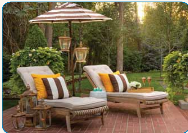
LJUDI SPOZNAŠ PO VRTU stran 6