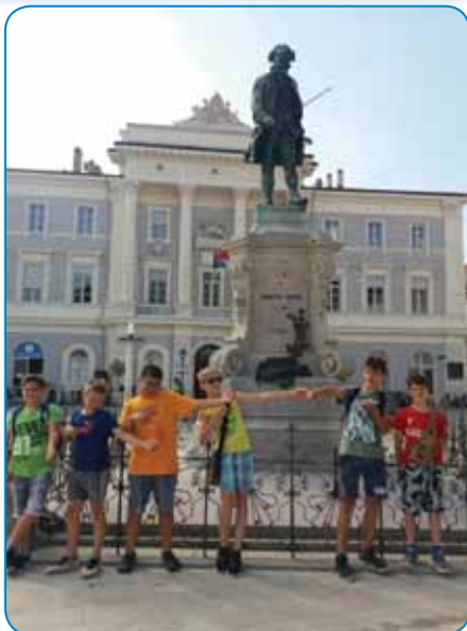
Jezikovna delavnica gornjeseniške skupine v Piranu

prejšnja leta. Prav posebej je treba izpostaviti še to, da smo učence skozi dejavnosti pomešali in jih razdelili v pet skupin: Morski ježki, Hobotnice, Morski psi, Ribice in Delfini. Učenci so tako v mešanih skupinah morali med seboj sodelovati in se tudi sporazumevati. Po skupinah so bili ves čas zaposleni in animirani: dopoldan so bile v