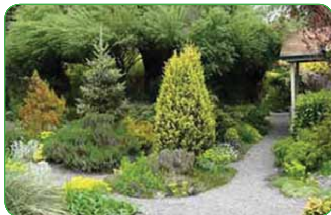
Na velikem vrtu posadimo vrsto zanimivih iglavcev, ki so okras tudi pozimi.

tesno povezani z naravo. Vrt je prostor, kjer odmislimo skrbi in prisluhnemo ptičjemu petju. Prav posebno vzdušje pa pričara vodni motiv. V hladnem vetru se obvodne trave nežno pozibavajo. Spomnim se starejšega vrtnarja, ki je povedal, da najzlahtnejše rastline zasaja tam, kamor seže pogled skozi okno. Zdi pa se mi, da tudi mladi vse bolj iščejo stik z naravo, ki jo hočejo začutiti vsaj v trenutkih, ko so prosti. Mnogi ljudje prinesejo ljubezen do rastlin že iz otroštva. Nekatere rastline jim ostanejo v spominu, zato jih hočejo imeti, ko odrastejo, tudi na svojem vrtu. Nostalgija. Okrasni vrt mora nastajati z gradnjo hiše, počasi. Za idejno zasnovo in zasaditev lahko prosimo strokovnjaka, ki se ukvarja z zasaditvijo okolice, pozneje pa vrt z rastlinami dopolnjujemo še sami. Ljudje velikokrat pripovedujejo, da dopust preživijo namesto na morju raje doma, v urejenem vrtu.