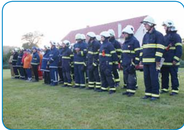
Pred vajo na sakalovskom igrišči

mo vrazmo autone. Odlaučili smo se za naučno vajo, šteramo povejo kakšo informacijo, ležej gorpride, gde je tisto