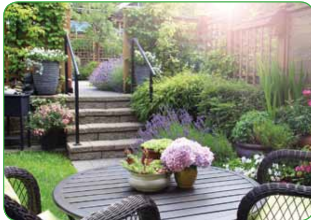
Prav v tem času bujno cvetijo sivka, hortenzija, ameriški slammik in iskrivka. Zakaj si ne bi polepšali mize za jutranjo kavo s hortenzijo?

kinjena. S posameznimi rastlinami ne delajmo otočkov. Na velikih vrtovih imamo možnost posaditi večje rastline, npr. pa-