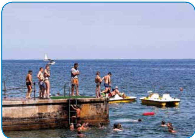
Morske radosti v vodi

S svojim obiskom v Fiesi nam predstavniki z ministrstva to zmeraj tudi dokažejo. Tudi letos je bilo tako. Hvala vam! Največja zahvala pa gre vsem