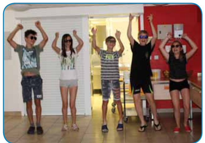
Zmagovalna koreografija plesa skupine Ribice, najboljše pri glasbeni delavnici

in kompromisih. Kot da bi nam režiser želel prepustiti odprto pot pri ustvarjanju zgodbe. A eno je bilo jasno: pri de-