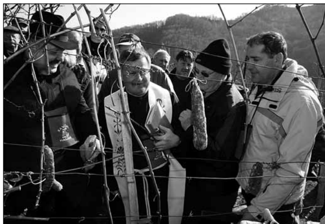
Prvi rez v vinogradu