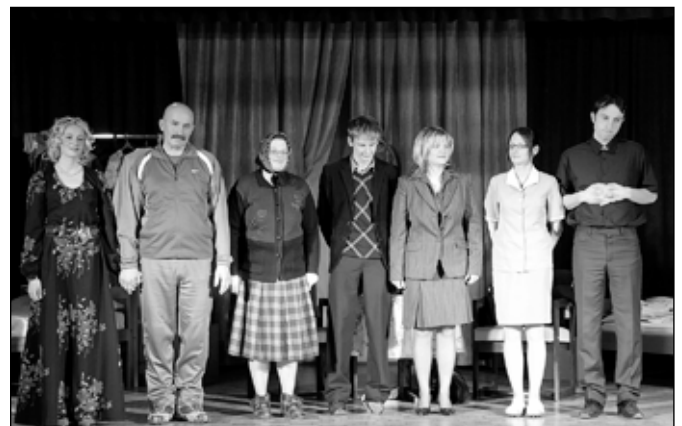
Čaj za dve – v izvedbi stoperških gledališnikov

začele nekje v sredini meseca decembra 2010. Sledile so kar pogoste vaje - dva do tri krat tedensko. Še posebej redne so bile za tri obsežnejše vloge. A nam je uspelo. Ja, res lahko tako rečemo, saj smo na domač oder stopili kar trikrat zapored (26. in 27. februarja ter 5. marca), ter vsakokrat napolnili dvorano. Prijeten je občutek nastopiti pred domačo publiko in še toliko večje zadovoljstvo, če je dvorana polna. Tokrat so Partljičeve vloge