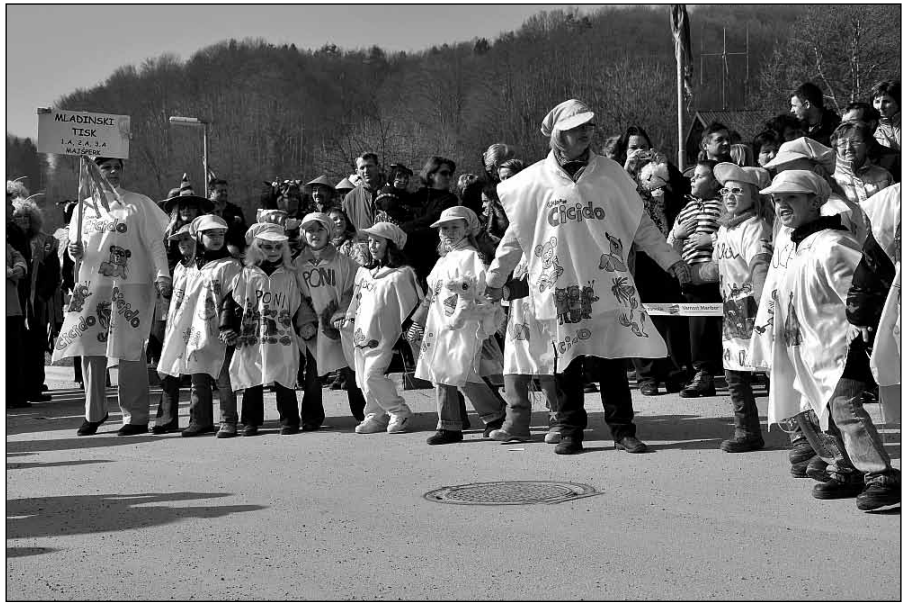
Mladinski tisk – prva triada OŠ Majšperk (2. mesto)