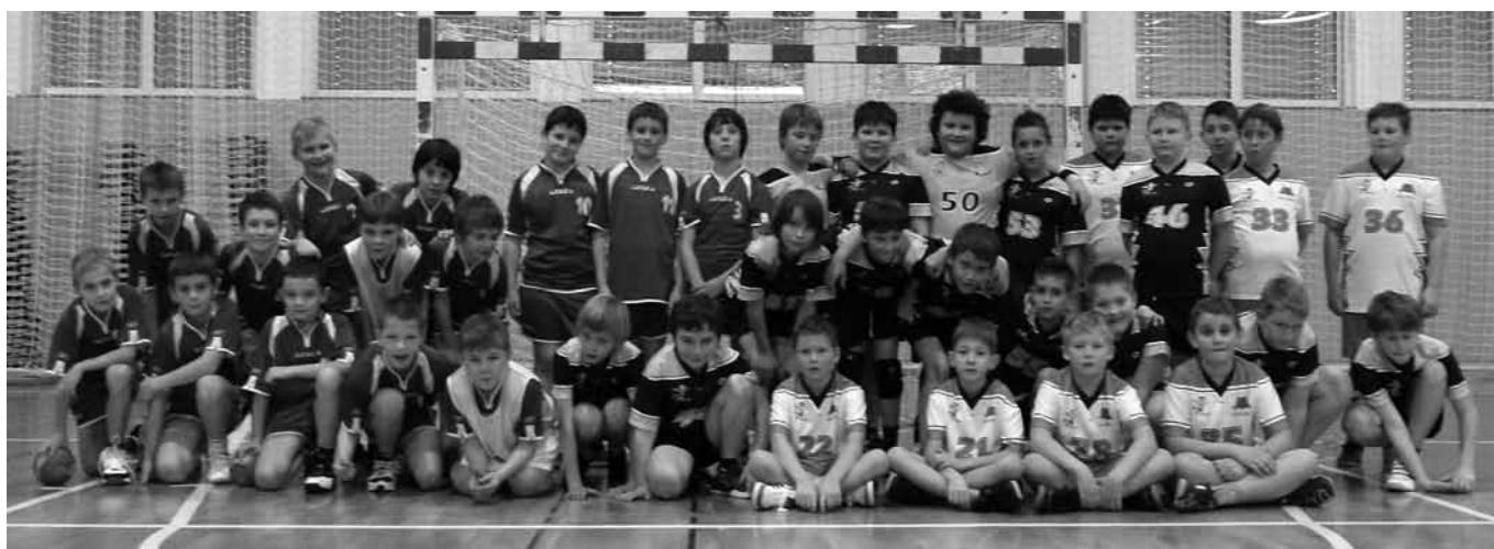
Na sliki učenci OŠ Majšperk, OŠ Ljudski vrt in OŠ Mladika, na tekmovanju v Majšperku.