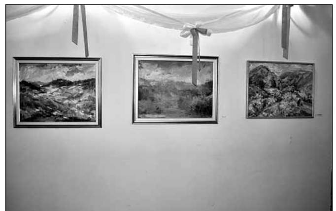
Razstavljene slike na Štatenbergu

Z ljudsko pesmijo in frajtonarico sta nas razveselila člana nove skupine VESELI PRIJATELJI iz Majšperka, ki