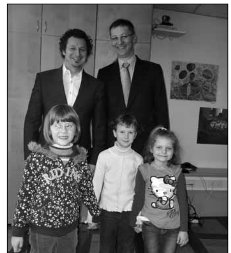
Naše nagrajenke na obisku pri ministrih