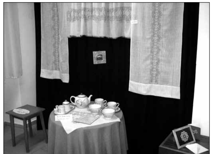
Utrinek z razstave v Mali dvorani

Veseli smo, da so se našemu vabilu odzvale tudi Podeželske mladenke iz Makol, ki s svojimi čarobnimi glasovi