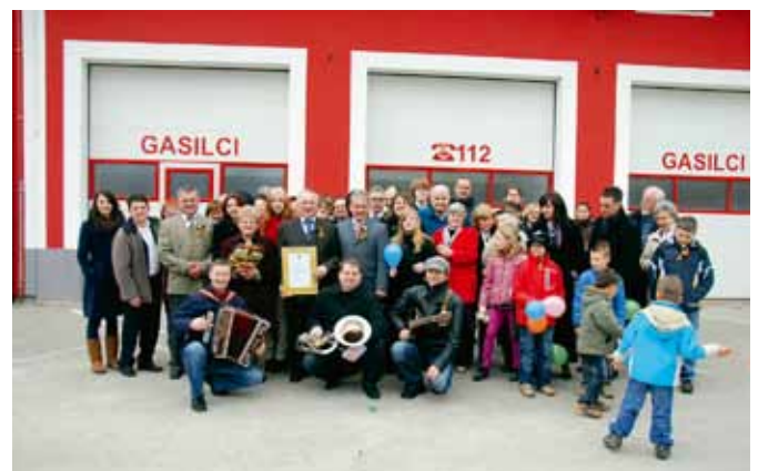
Zlatoporočenca Galun s svati

je rodila 10. februarja 1942 v Stopercah. Rodila se je v kmečki družini kot drugi otrok, svoja otroška leta pa je preživela še z dvema sestrama in enim bratom. Osnovno šolo je obiskovala in jo tudi dokončala v domačem kraju., Zelo si je želela nadaljeva- ti šolanje in pridobiti kak poklic, a zaradi primanjko- vanja finančnih sredstev v tistem času to ni bilo mogoče. Tako je po končanem šolanju