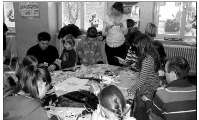
Takole so pustne maske izdelovali na Ptujski Gori