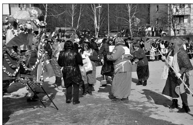
Peto mesto je pripadlo DU Ptujka Gora in Ekološkemu otoku