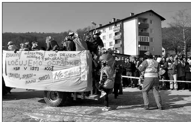
Ločevanja odpadkov se je lotil KUD Majšperk in osvojil četrto mesto