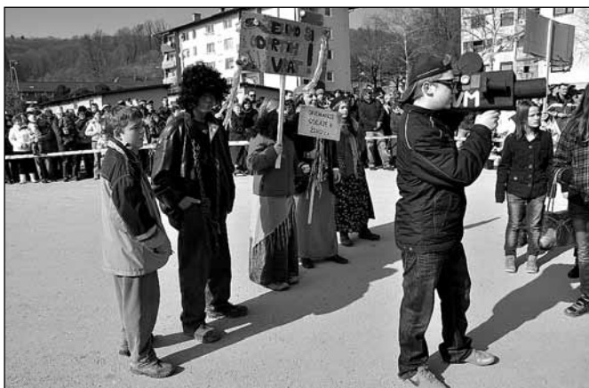
Oddajo v živo je za četrto mesto snemal 7.a razred