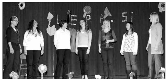
Premierni nastop nove pevske skupine