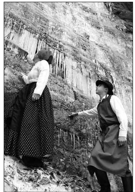
Pod ledenimi svečami