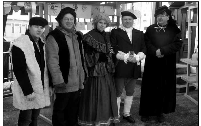
Ustvarjalci na Barbarinem sejm