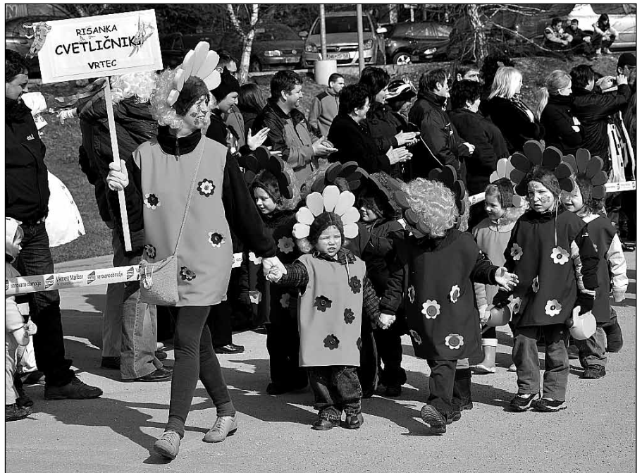
Najlepši in najbolj pristrčni – malčki iz Vrtca Majšperk (1. mesto)

Tudi letos smo izbrali temo, na katero smo ustvarjali pustne maske. Izbrali