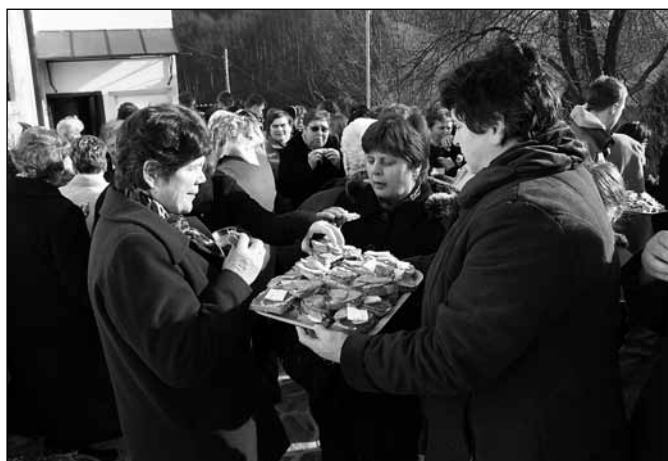
Prijetno druženje pred cerkvijo v Stopercah

Ko se mesec januar že dobro prevesi v drugo polovico,