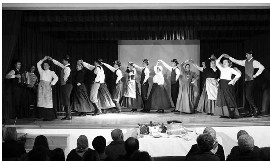
Plesalci Folklorne skupine KPD Stoperce z godcema

so v soboto, 15. januarja, drugo leto zapored pripravili prireditev z naslovom Ob Antonovem, nanjo pa povabili Folklorno skupino Prosvetnega društva Anice Černejeve iz Makol in Folklorno društvo sv. Martina občine Hajdina. Stoperški folklorniki so uradni del prireditve končali s spletom, ki jim je lansko leto zagotovil nastop na državni reviji odraslih folklornih skupin v Beltincih. Ob naštevanju nastopov je številka šla čez trideset, kar ob uspehu kaže na resnost in marljivost ekipe. Neuradno pa s klobasami, kot se za Antonovo spodobi. Pa ne kakršnih koli – izpod folklornih rok, sami so namreč klobase izdelali, odimili in jih gostujočim postregli z zeljem in krompirjem.