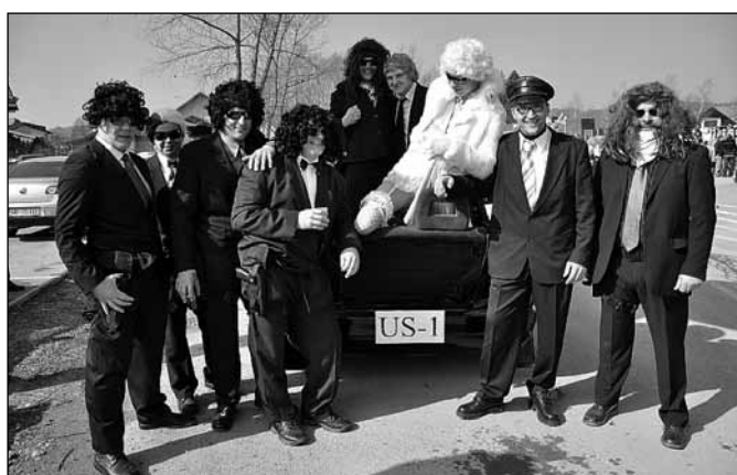
Kot vedno nas je nasmejala skupina iz Stanečke vasi, ki je uprizorila atentat na Kennedyja