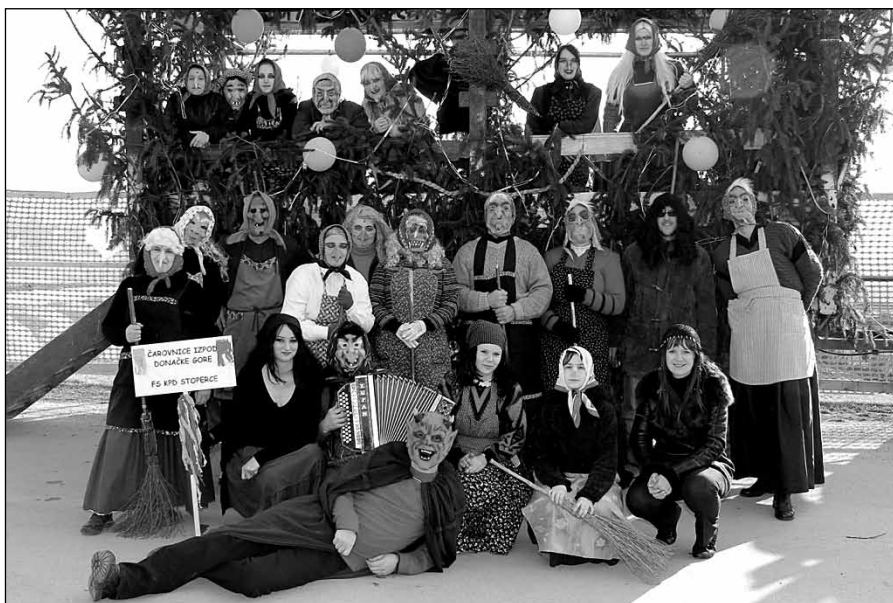
Čarovnice z Janžem in županjo

Čarovniška preobleka je bila želja stoperškim folklornikom že kar nekaj časa. Letos je padla odločitev, da je čas, da se zamisel uresniči. Zakaj čarovnice? Nekoč so se te zbirale na Donački gori,