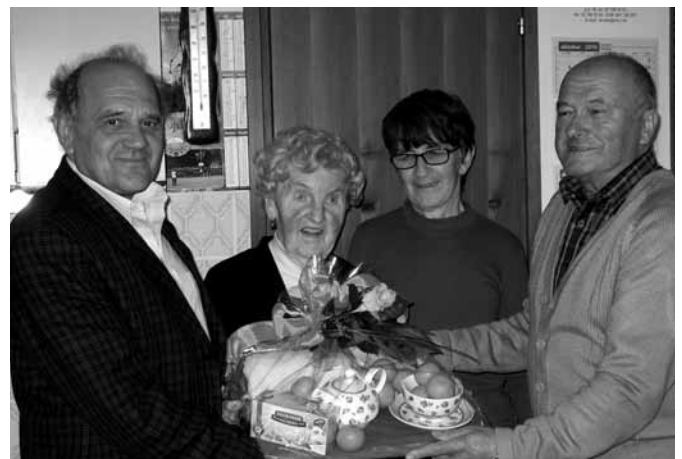
Najstarejša članica DU Ptujška Gora