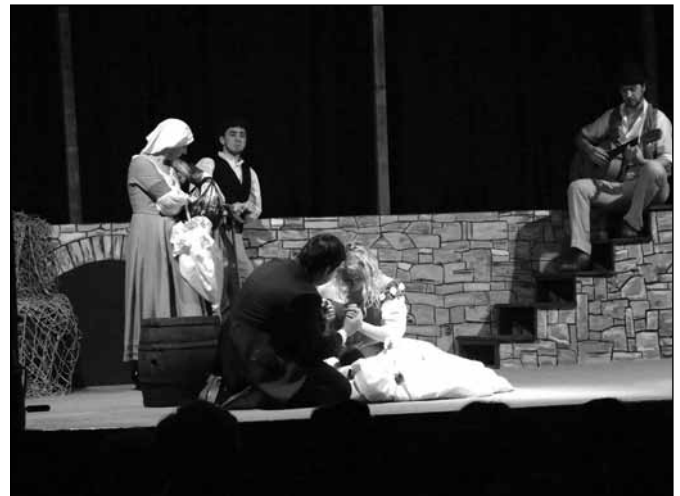
Prizor iz komedije Scapinove zvijače

Osrednji lik te komedije je premeten, nesramen, smrtonosno duhovit služabnik, bravurozen iznajditelj zvijač in intrig, ki zna voditi svoje in tuje gospodarje, ve za svoj prav in se zna maščevati domišljavim gospodom, ki si domišljajo, da jim pritiče neomejena oblast nad življenjem drugih.