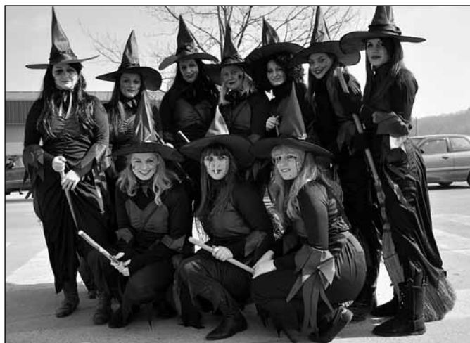
Drugo mesto so si prislužile čarovnice PGD Majšperk