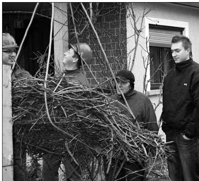
Štorkljino gnezdo v Lešju

Bela štorklja je vsem nam dobro znana ptica s črnimi letalnimi peresi in lopatičnim perjem umazano bele barve. Odrasli osebki imajo rdeč kljun in dolge rdeče noge, za razliko od mladičev, ki pa imajo črn kljun in črne noge. Je selivka, ki jeseni odleti proti Afriki, kjer prezimuje južno od Sahare. Na populacijo štorkelj pomembno vplivajo vremenske razmere v prezimovališčih. Dolgotrajne in obsežne suše poslabšajo možnosti preživetja štorkelj v prezimovališčih. Štorklje, ki priletijo k nam na gnezdišča, gnezdi v bližini človeških naselij. Je ptica kulturne krajine nižin, njen življenj-