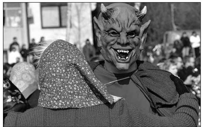
Janž z Donačke gore je vrtel svoje čaravnice in si z njimi prisvojil prvo nagrado za najboljšo odraslo skupino! (folklorniki KPD Stoperce)