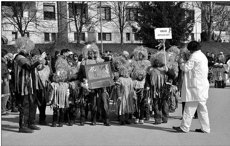
Tretje mesto so zasedli Virusi iz OŠ Ptujška Gora

Vse tiste, ki si niste ogledali povorke, vabimo prihodnje leto, da se nam pridružite na 13. pustni povorki v Majšperku. Ne pozabite! Vabljeni stari in mladi, suhi, debeli, resni, veseli, da bomo na pustno soboto skupaj noreli.