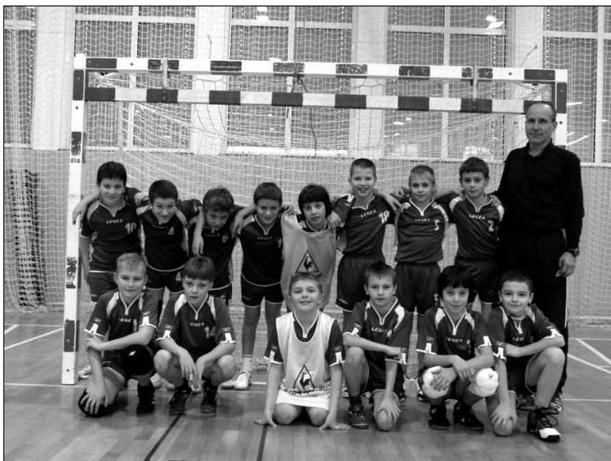
Na sliki ekipa OŠ Majšperk na tekmovanju v Majšperku.