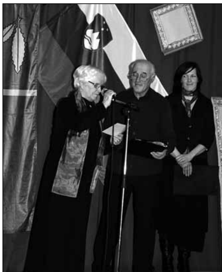
Utrinek s prireditve ob slovenskem kulturnem prazniku

Organizatorji, člani Kulturno-umetniškega društva Majšperk, smo prireditev posvetili vsem nam – kulturnikom, saj to je praznik kulture, praznik vseh, ki delamo v kulturi. Posvetili smo ga kulturi v Majšperku in si jo ogledali v sliki. Spomnili smo se društev in posameznikov, ki so delovali pred leti, njihovih dramskih del, njihovih zborov, instrumentalnih skupin in pomembnih dogodkov, ki so zaznamovali naš kraj in naše ljudi. Seveda smo zajeli le drobtini-