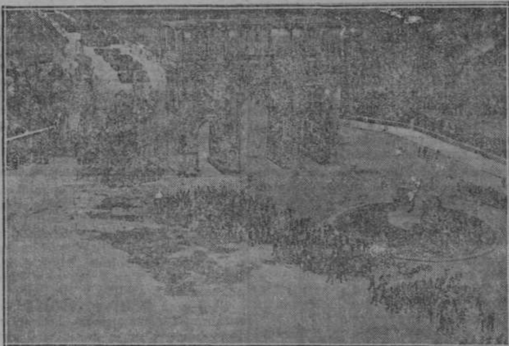
Parada prvih fašistov ob proslavi 11letnice fašističnega pohoda v Rim. — Na sliki vidimo slavelok, katerega je odkril Mussolini.

Od tedaj naprej je postajal poprej tolikanj dobrodušen gospod vedno bolj razburljiv in je začel celo mojega sina za vsako malenkost pretepavati. Radi rastoče neznosnosti sem ga lepega dne