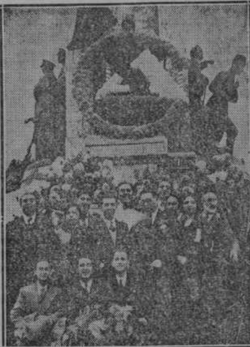
Proslava obstoja 10letnice nove Turčije ob spomeniku na čast republike.

opozoril, da tako pač ne bo šlo dalje in naj mi vendar pove, zakaj se je naenkrat spremenil in baš tukaj na letovišču. Mož je nekaj časa okleval sem ter tja, potem se je izpovedal. Poslušal sem izpoved, zmajeval sem neverjetno z glavo in mu staval naslednjo ponudbo: »Gospod profesor, za noč prepustite meni sobo v stolpu. Sam bom prenočil v njej.«