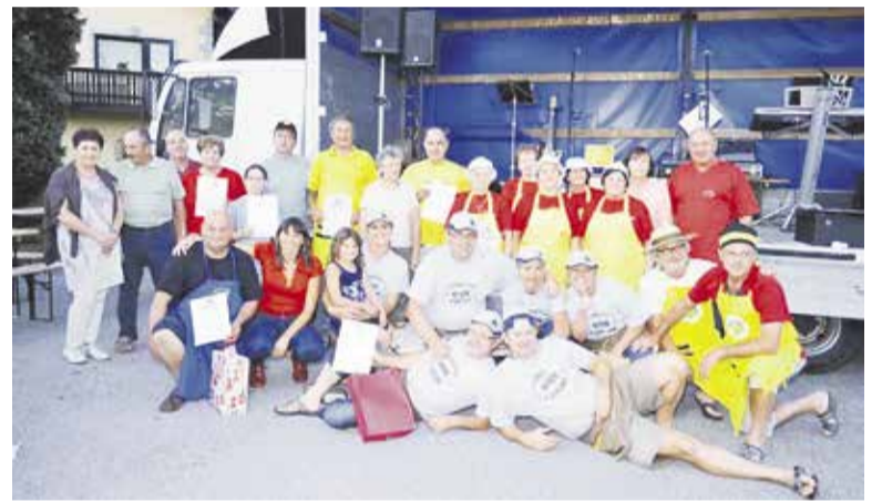
Na golažijadi v centru Doba se je predstavilo osem društev oziroma organizacij.

Sobotno popoldne je bilo namenjeno golažijadi v centru Doba, na kateri se je predstavilo osem društev oziroma organizacij: Mladi boksar Dob, Prostovoljno gasilsko društvo Dob, Turistično rekreativno društvo Turnše, Češenik; Karitas Dob, Športno rekreativno društvo Konfin, Društvo za raziskovanje jam Simon Robič Domžale in Čebelarsko društvo Krtina Dob. Pri tem ni šlo le za kuhanje golaža, temveč so se predstavili s svojo dejavnostjo na stojnicah, o njej govorili številnim prisotnim in jih pogostili z dobrotami. Društvo upokojeencev Naš dom Dob je predstavilo svojo dejavnost in poskrbelo za slastne palačinke in flancate, s svojo razstavo ročnih del, predvsem klekljanih izdelkov, je na svojo stojnico vabila pridna skupina izdelovalk ročnih del, za gostinske storitve je poskrbel Jamarski dom, za prijetno glasbo pa legendarni Gamsi. Obe komisiji, za kuhanje golaža in tu-