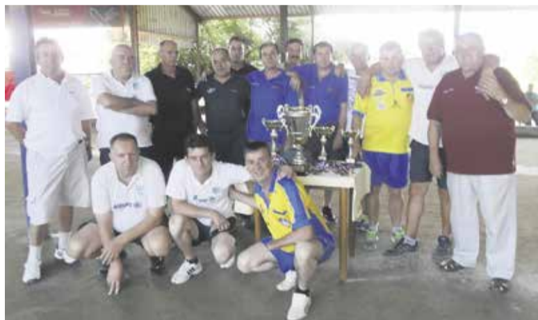
Ekipi BSK Budničar Količevo in BK Opatija pred finalom

V začetku avgusta je na pokritem balinišču potekal tradicionalni mednarodni balinarski turnir za Pokal Občine Domžale, ki v malce spremenjeni obliki Balinarski športni klub Budničar spremlja že skoraj od začetka njihovega dela. Pomerilo se je 16 ekip iz Hrvaške in različnih koncev Slovenije, med njimi vsi sosednji balinarski klubi. V izločilnih bojih smo videli veliko odličnih iger, v finale pa sta se uvrstili ekipi iz Opatije in domača ekipa, v kateri so