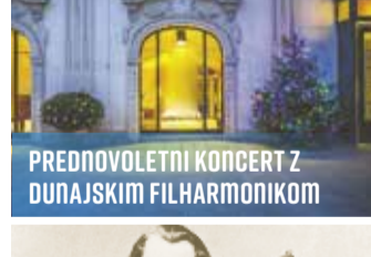
PREDNOVOLETNI KONCERT Z DUNAJSKIM FILHARMONIKOM