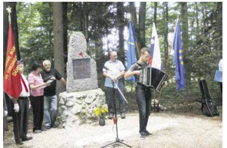
7. avgust, spomin na akcijo Radomeljsko-mengeške čete na Hrastovcu leta 1941