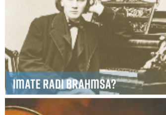
IMATE RADI BRAHMSA?