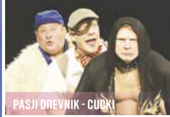
PASJI DNEVNIK - CUCKI