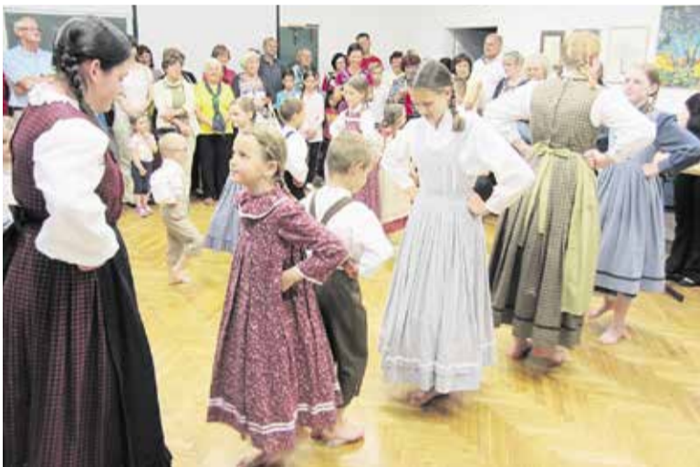
Zaploskali smo otroški folklorni skupini.

Da nam ni vseeno, kako bodo živeli naši otroci in vnuki, se kaže v skrbeh, ki jih posamezne članice in člani posvečamo svojim ožjim družinskim članom. Ta skrb pa ne zamre niti v društvu. Veseli smo vsakega sodelovanja, pogled na mlade ustvarjalce pa nas navdaja z nepopisnim veseljem, da je med mladimi veliko želje po različnih vrstah ustvarjanja. Tako so citrarke in kitaristke rade prisluhnille in pogledale pod prste mladima instrumentalistoma