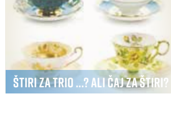
ŠTIRI ZA TRIO...? ALI ČAJ ZA ŠTIRI?