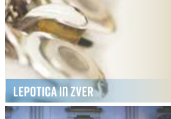
LEPOTICA IN ZVER