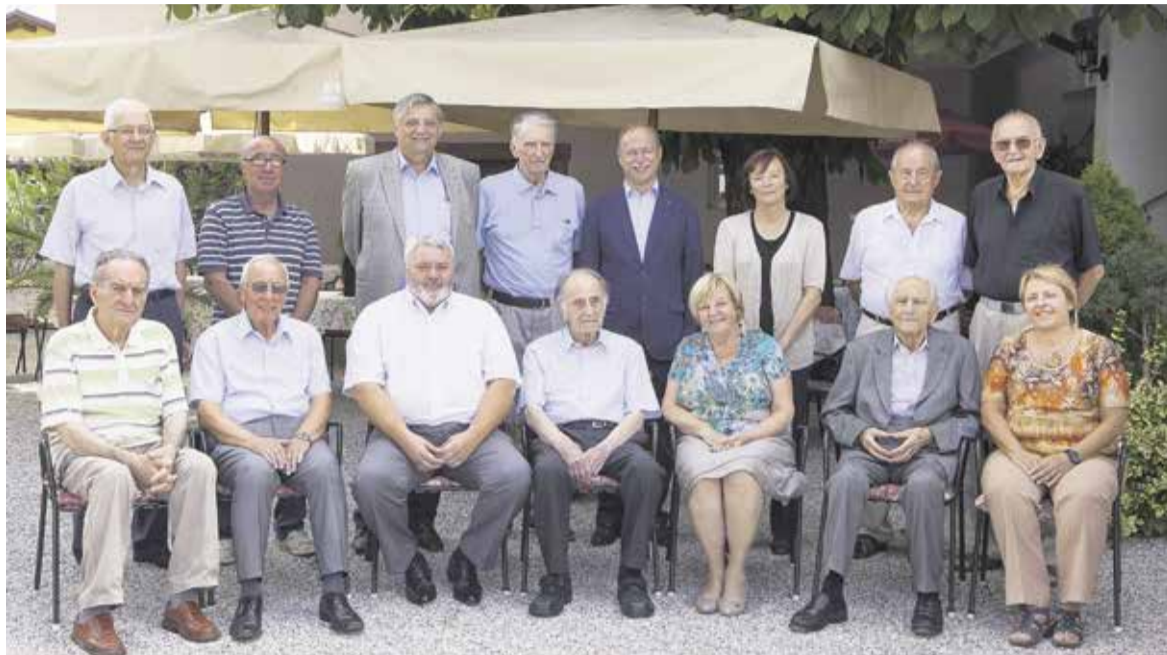
Praznovanje v gostišču Juvan