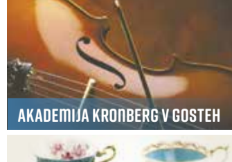
AKADEMIJA KRONBERG V GOSTEH