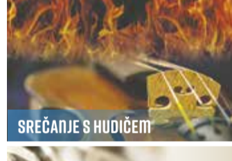
SREČANJE S HUDIČEM