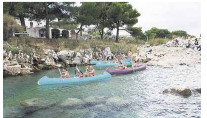
99 otrok je v organizaciji ZPM Domžale in ob pomoči sponzorjev preživelo del počitnic v Domžalskem domu na Krku.

V teh dneh Zveza prijateljev mladine Slovenije in ZPM Domžale namenjata posebno skrb tudi problematiki nasilja v družini, ki je v naši državi velik problem, posebej pa obe opozarjata na prepoved telesnega kazno-