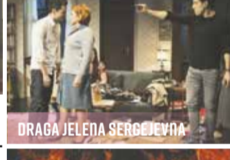
DRAGA JELENA SERGEJEVNA