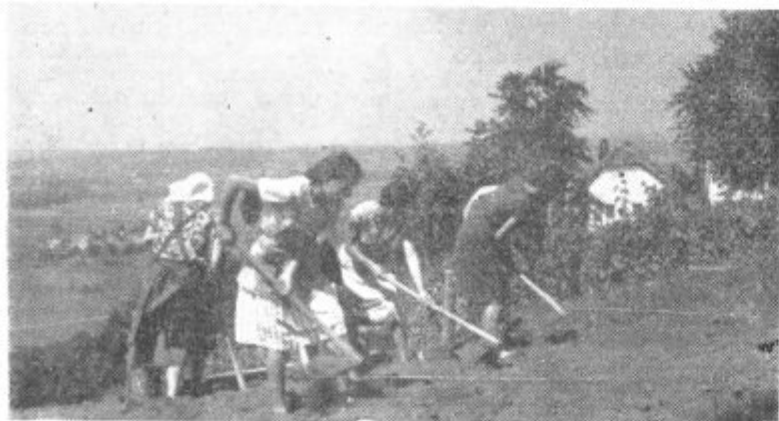
Letos je bilo mnogo komunalnih del opravljenih s prostovoljnimi delom. Delali so uslužbenci občine v Švicarskem dvoru, pred kratkim so v Gradišču uredili v dvorani novi pod, v kratkem pa bodo v Lenartu končana izkopavanja jačkov za električne kandelabre. Na sliki: skupina Zavrhanov pri urejevanju okolja stolpa.