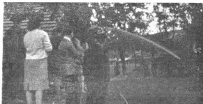
Gasilska društva občine Lenart so v Cerkvenjaku 1. avgusta pripravila velike gasilske vaje v sklopu svojega delovnega programa. Na sliki: detajl z lanskoletnih vaj