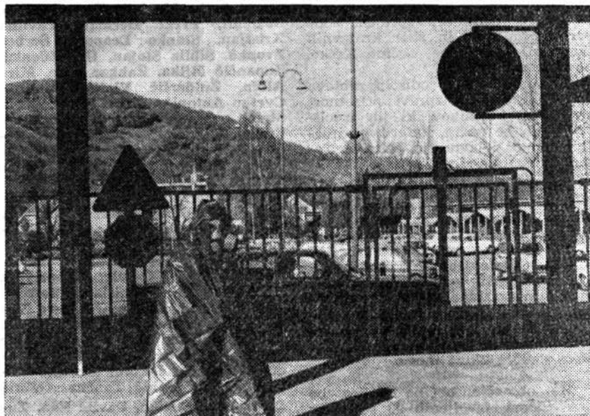
Akcija NNNP — Posavje '82

S sprejemom tega odloka občinska skupščina ne sprejema nobenih novih finančnih obveznosti, medtem ko so stroški sklicevanja sej komisije kot delovnega telesa minimalni.