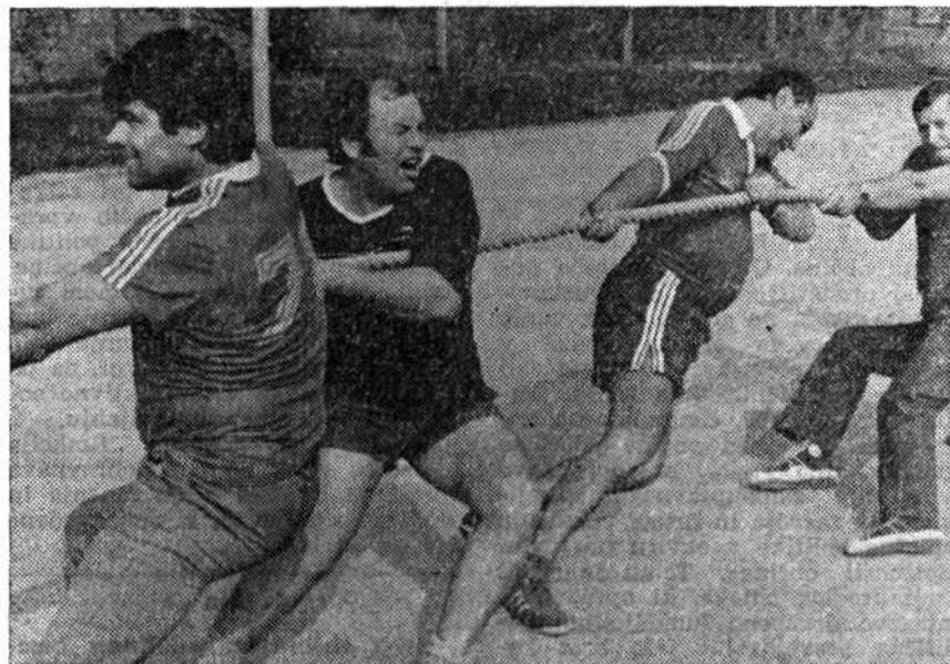
Tekmovanje v vlečenju vrvi na Pionirjevih igrah — V tej številki objavljamo nekatere rezultate tekmovanj DŠI.

Osnutek odloka so obravnavali vsi trije zbori na svoji seji 25. oktobra 1982 in ga sprejeli v predloženem besedilu brez pripomb, zato je tudi besedilo predloga odloka ostalo nespremenjeno. Kot je bilo že v obrazložitvi osnutka povedano, so s tem odlokom novelirana samo nekatera določila oziroma so usklajena s spremembami in dopolnitvami republiškega zakona o sistemu državne uprave v SRS ter statutom in poslovníkom občine. Predvsem je s predloženim odlokom določeno, da se sekretariat oblikuje kot samostojna organizacijska enota in izključna strokovna služba občinske skupščine. Delovna skupnost sekretariata pa bo svoje samoupravne pravice uresničevala skupaj z drugimi delavci občinskih upravnih