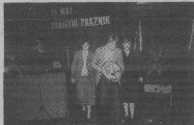
Krajanji Most so se 15. maja množično zbrali v dvorani telovadnega društva Partizan in s krajšim kulturnim programom ter s podelitvijo priznanj zaslužnim krajanom počastili praznik svoje krajevske skupnosti. Ob tej priložnosti so tudi položili venec pred spominsko ploščo na stavbi krajevske skupnosti ob Zaloški cesti. (Na sliki: delegacija krajanov nese venec) D. J.