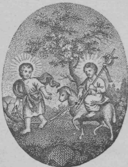
Jezusček in sv. Janez.

»To je torej ogledalo, ki hoče mamica, da bi jaz večkrat vanje gledala.« Te besede so privrele Reziki nehote iz nežnih ust. Razočaranje in veselje obenem se je mešalo v njenem srčecu; toda kmalu je zmagalo veselje in navdušenje, »Mama, o dobra mama! Saj Vas razumem. Ta podoba naj me uči, kakšna moram biti: