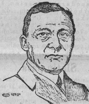
Geh. Rat. Friedr. Graf v. Toggenburg, Statthalter in Tirol

Od italijanske vojne je Tirolska prav hudo