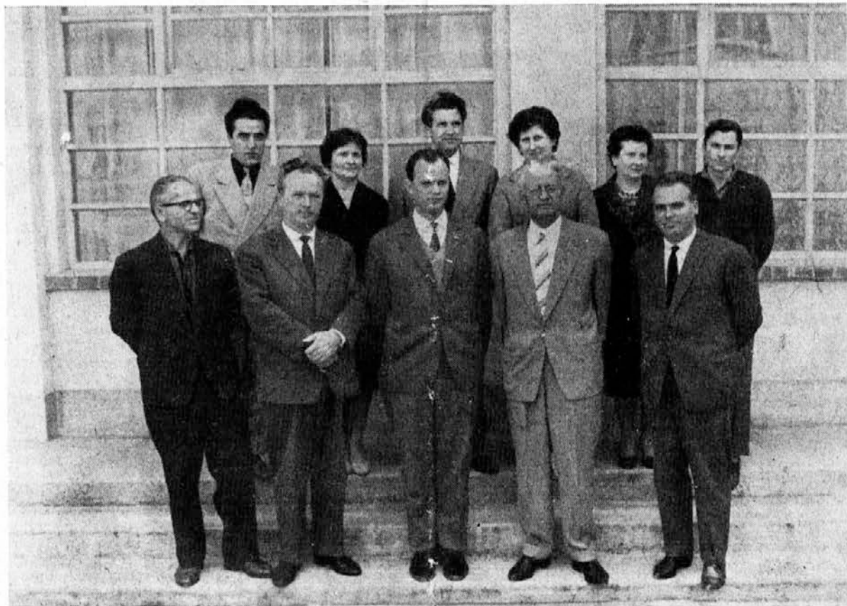
Novi upravni odbor pred prvo sejo

Na svojih sejah je upravni odbor obravnaval prav vse kar spada v njegovo pristojnost, ki mu jo dajejo začasni pravilnik o pristojnosti samoupravnih organov ter druga pravila. Redno je obravnaval tudi material ter pripravljaj predloge za delavski svet podjetja, kar velja zlasti za pomembnejše odločitve, kot so proizvodni plani, osnutki pravilnikov, periodični obračuni in podobno. Vse delo upravnega odbora se je odvijalo v skladu s predpisi in navodili, kar je vneslo v (Nadaljevanje na 2. strani)