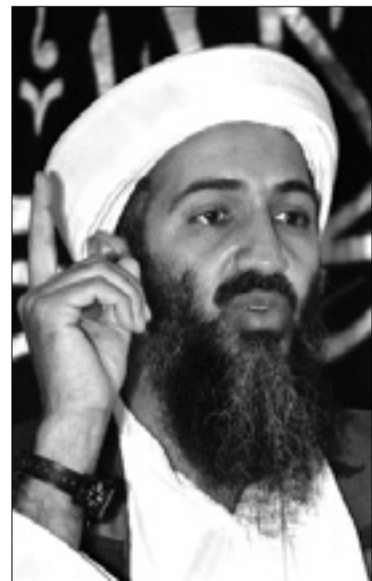
Osama bin Laden

KAIRO - Po dolgem času se je znova oglasil vodja teroristične mreže Al Kaide bin Laden. Preko zvočnega posnetka, ki so ga objavili na neki islamišči spletni strani, je muslimane pozval k sveti vojni proti Izraelu in obsodil arabske države, ker preprečujejo svojim ljudem, da bi "osvobodili Palestino".