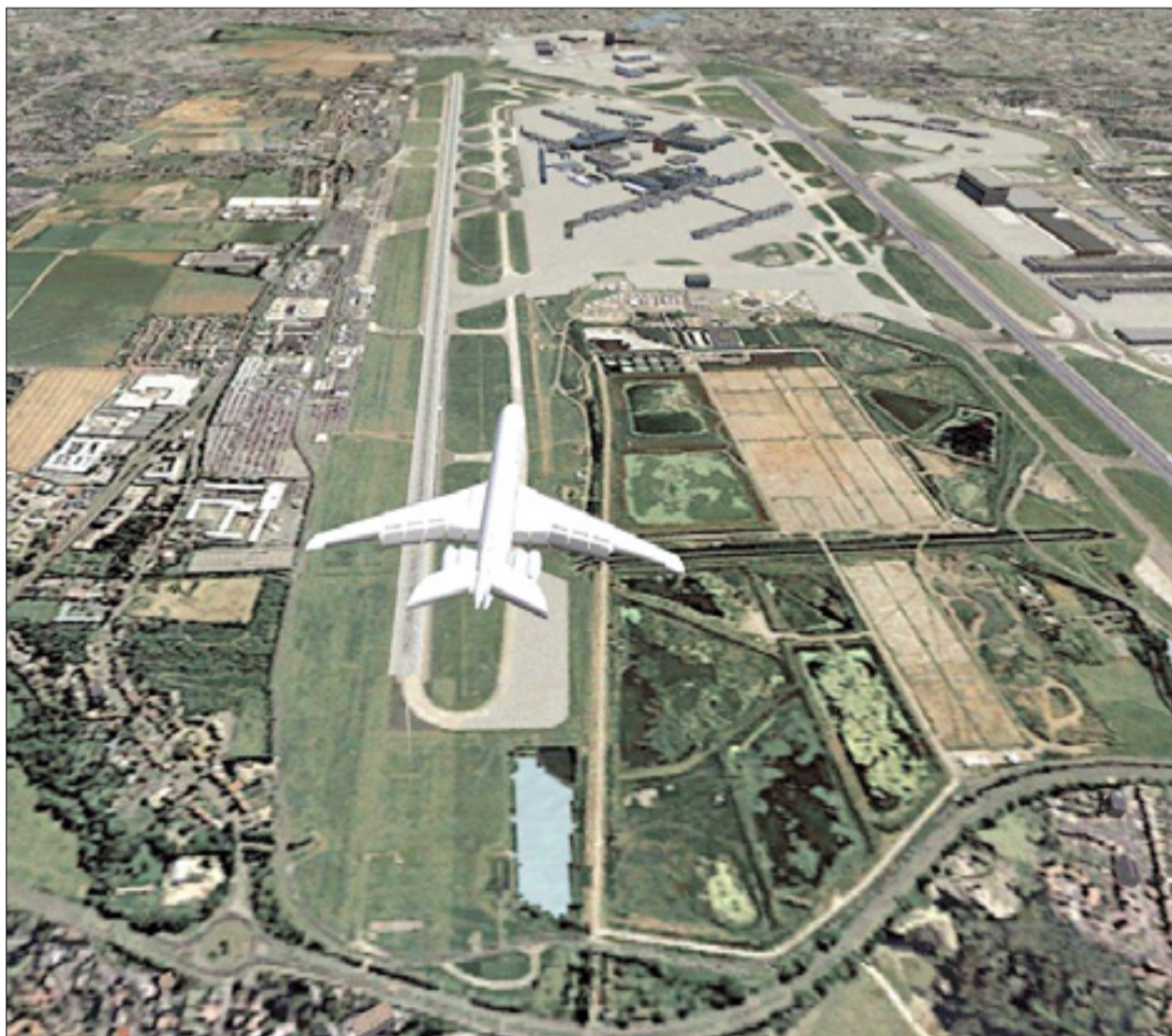
Letališče Heathrow s ptičje perspektive

LONDON - Načrti, da bi na največjem londonskem letališču Heathrow zgradili tretjo vzletno oziroma pristajalno stezo, so v torek naraveli na resno oviro. Člani okoljevarstvene organizacije Greenpeace in nekateri drugi okoljski aktivisti so namreč sporočili, da so kupili zemljišče, kjer naj bi potekala načrtovana tretja steza.