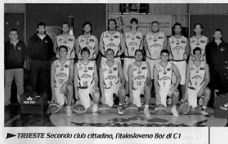
► TRIESTE Secondo club cittadino, italiosloveno Bor di C1