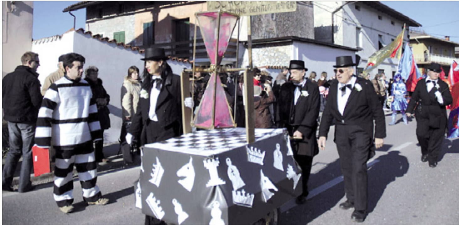
Romjanski šahisti v lanskem sprevodu po Sovodnjah

V soboto, 21. februarja, koncert Kingstonov, dan kasneje pustni sprevod