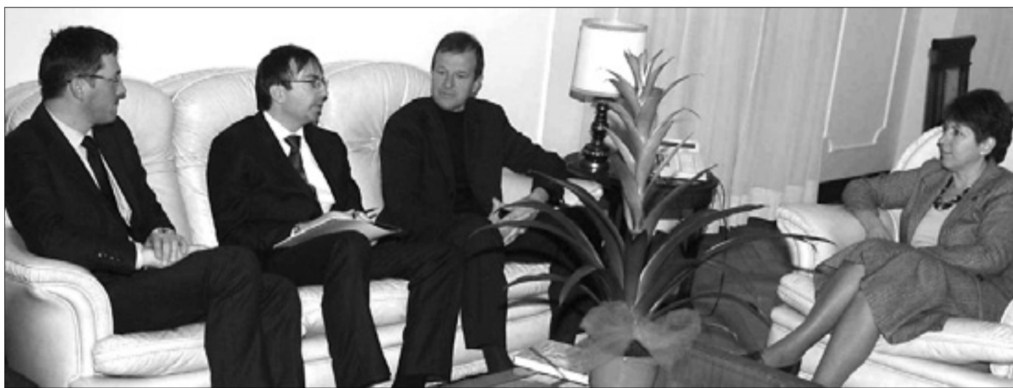
Delegacija goriškega vodstva krovne organizacije s prefektinjo v vladni palači na Travniku