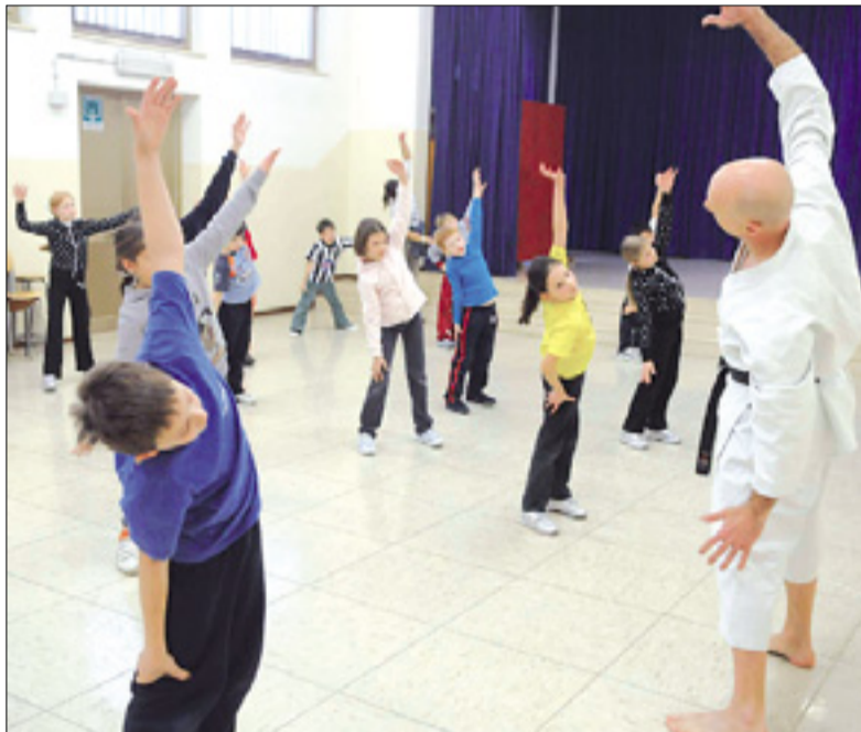
Mali števerjanski karateisti