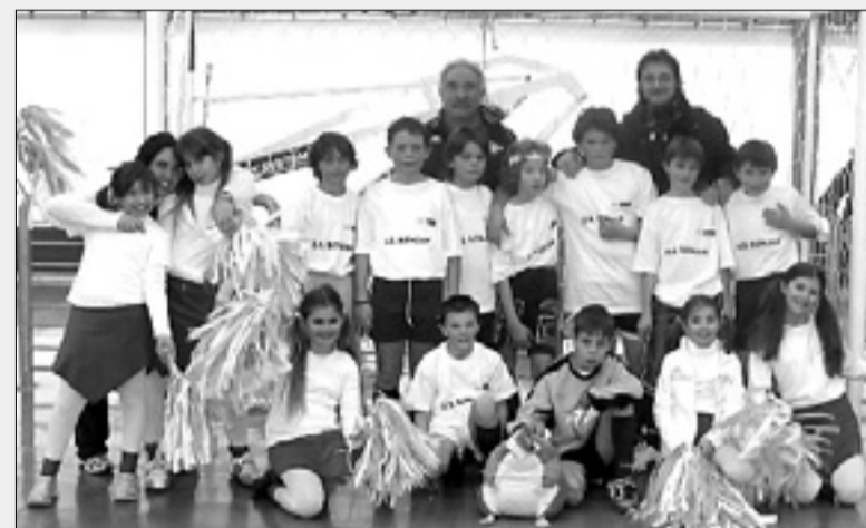
Nogometaši osnovne šole iz Romjana

Turnir Rad igram nogomet, ki je konec tedna potekal v Doberdolu in ga je za starostno kategorijo cicibanov (U10) in mlajših cicibanov (U8) organizirala Nogometna zveza Slovenije v sodelovanju z Mladostjo in Občino Doberdob je nadvse uspel. Nastopilo je okrog 230 otrok s celotnega območja Goriške. Od ekip s te strani meje sta nastopili ekipi Mladosti in slovenske osnovne šole iz Romjana. Zelo dobro se je odrezala A ekipa Mladosti, ki je zasedla 2. mesto in bo v nedeljo na-