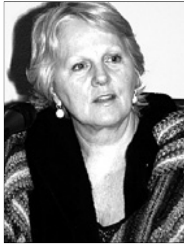
Katio Ricciarelli v Gorici

Zgodba sopranistke Florence Foster Jenkins - Za Katio Ricciarelli debi na odrskih deskah