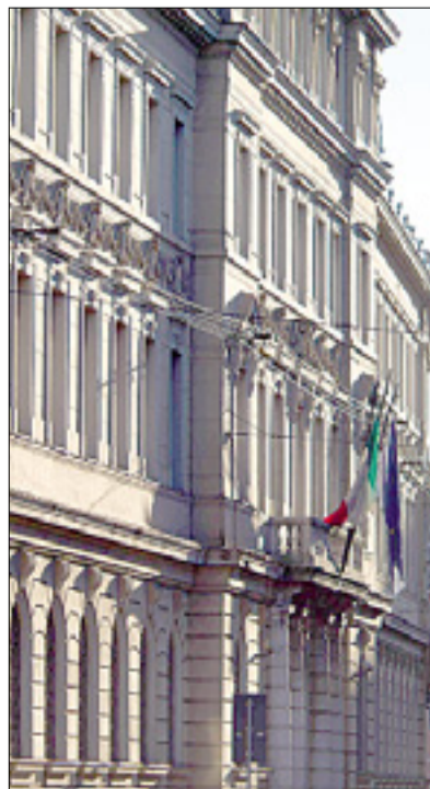
Pročelje goriške sodnije

Zaradi ogromnega bremena dela, povezanega s smrtmi zaradi azbesta