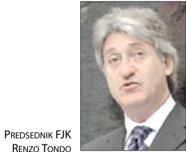
PREDESNIK FJK RENZO TONDO