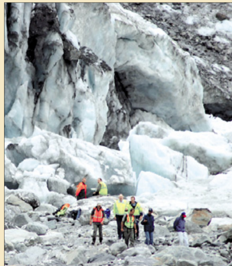
Oče in bratranec ponesrečenih bratov s policisti na ledeniku