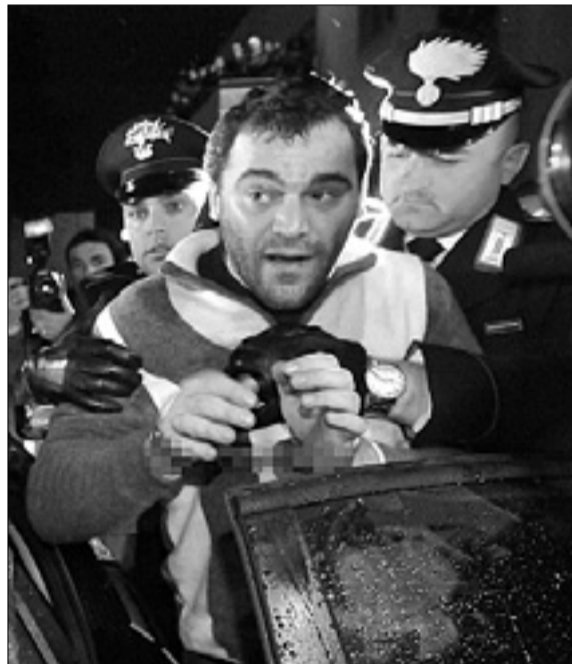
Setola v rokah karabinjerjev