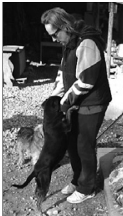
V goriškem pesjaku

Kdor bo posvojil psa iz pesjaka, bo prejel prispevek v znesku 200 evrov