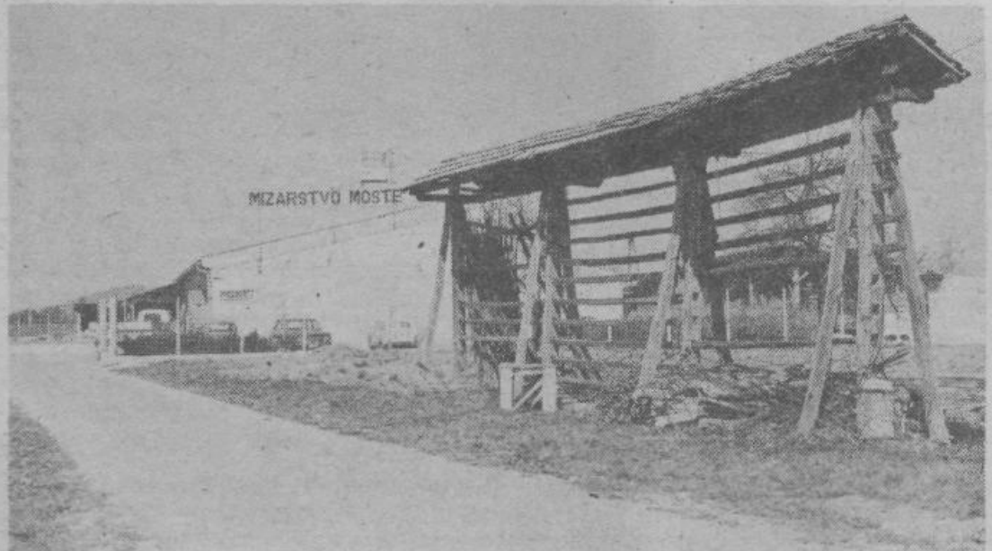
Nove proizvodne hale omogočajo Mizarstvu Moste uvajanje v proizvodnjo sodobne tehnologijo