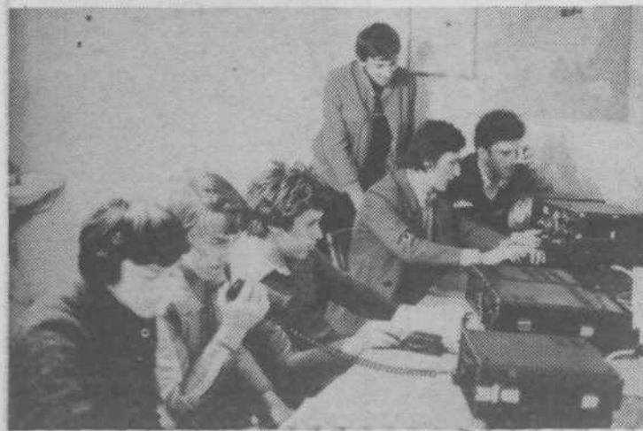
Radioamaterji ob novih radijskih oddajnikih

velik problem. Na začetku je večkrat kazalo, da društvo ne bo moglo začeti, saj ni bilo niti ustreznih prostoro-