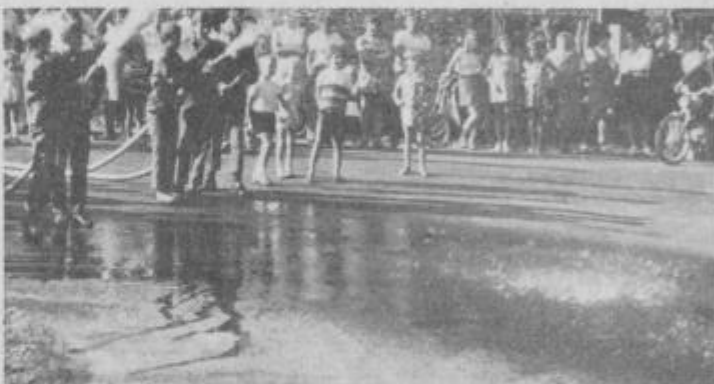
Vaščani so se zbrali v centru, na novo asfaltirani cesti.

Takoj za tem so pričeli zbirati denar. Uspeh je bil viden. Sredstev