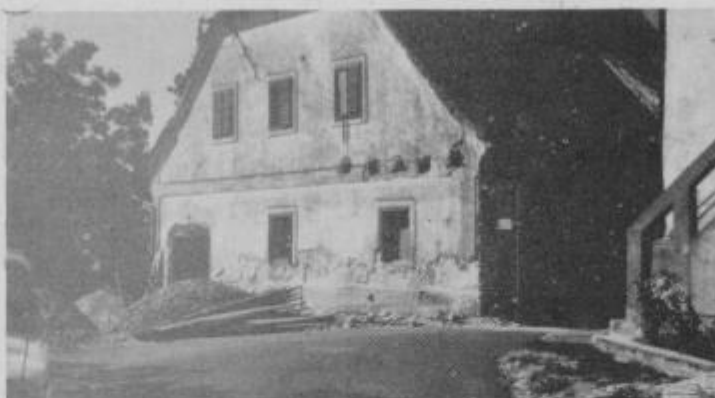
Asfaltiranje ceste Ptuj-Grajena. Potegnili so šest kilometrov asfalta

kilometrov dolgo asfaltno preprogo do Grajene. Tako smo šest kilometrov bliže želji, da bi bila