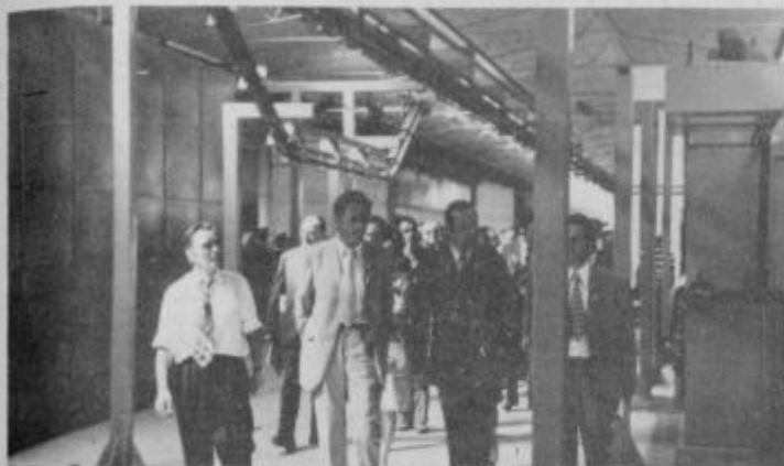
Otvoritev novih proizvodnih prostorov Tovarne avtoopreme Ptuj

Novi prostori so velikega pomena za tovarno, ki je v nenehnem razvoju.