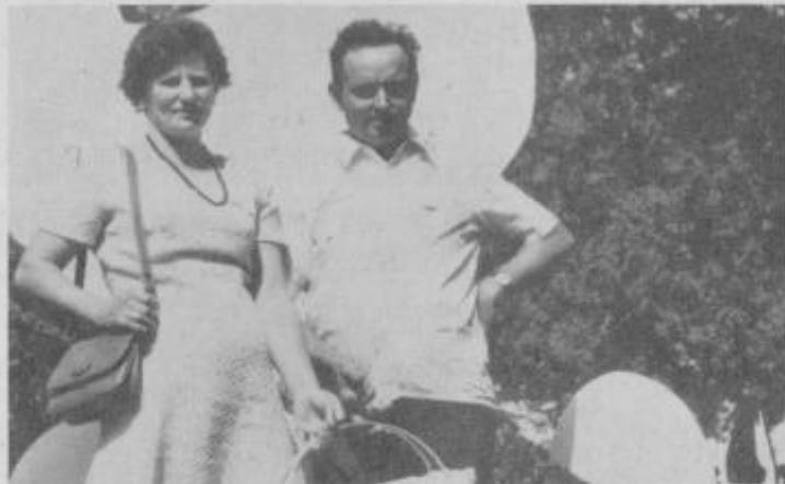
Na dvorišču borlskega gradu se je zbralo nad 1000 perutninarjev — kooperantov, proti večeru se je število še povečalo.

— Kaj ste do danes delali na tem, da bi pridobili čimveč kooperantov? — „Mnogo. Kooperantom dajemo kredite za adaptacijo že obstoječih gosp. poslopij, predvsem pa za nove gradnje specializiranih objektov za vzrejo piščancev.“