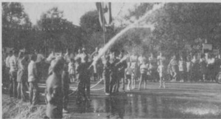
Otvoritev asfaltiranih vaških cest in vodovoda v Tržcu je bilo v nedeljo, 9. septembra letos, z domačo zabavo.

Vaščani niso imeli sredstev. V vasi je samo en kmet, ki ima mehanizacijo, ki bi jo danes moral imeti že