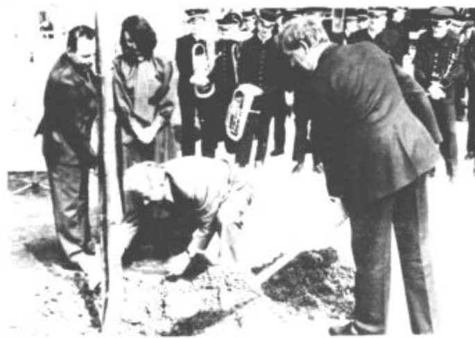
Zasadili so lipo, da bo šelest njenih listov bodoče generacije spominjal na njihove korenine.

seveda javno zahvalil krajanom, da so zmogli toliko notranje energije in zgradili novo središče ter s tem zagotovili, da ime Škal ne bo izginilo iz zgodovinskega spomina. »Zavedamo se, da samo naša notranja energija ne bi bila dovolj za izgradnjo tega, zato mi je dolžnost, da se v imenu vseh krajanov in organov krajevne