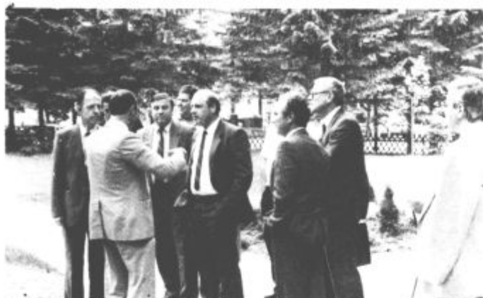
Dobra volja sredi lepote Logarske doline že, kaj pa njeni problemi?

Glede širših družbeno-ekonomskih razmer je dejal, da v zvezi z vključevanjem v Evropo v Sloveniji ne sme biti malodušja. Slovenija ima atraktivne programe, ki jim Evropa zaupa. Seveda je ob tem ugotovil, da s tisoč odstotno inflacijo v Evropi nimamo