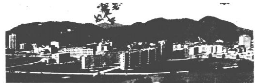
Velenje v 60. letih