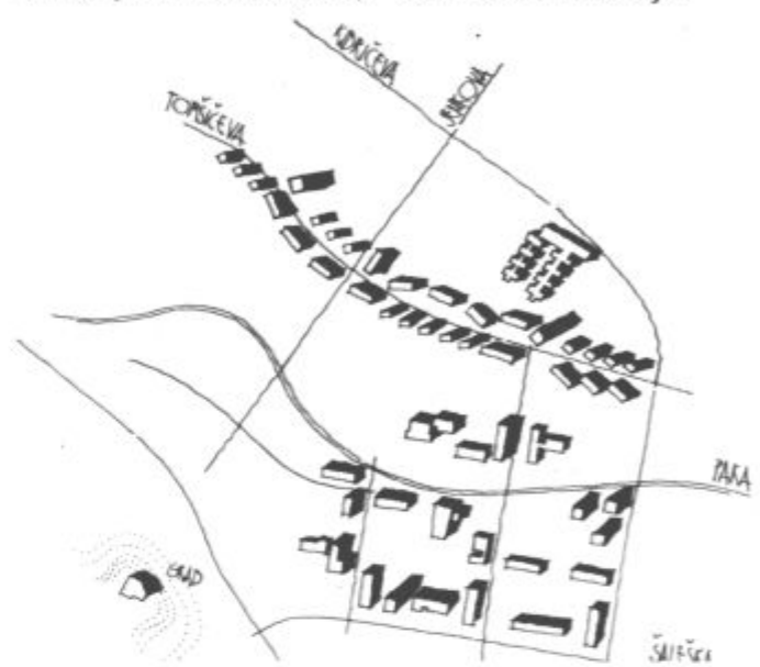
Velenje — moderna zasnova

Greimo naprej v značilne oblike moderne arhitekture. Od kod so vzete le te? Prihodnjic.