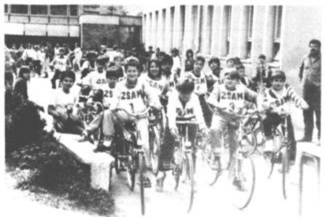
Napeto »ozračje« pred kolesarskimi izpiti na OŠ Biba Rock v Šoštanju