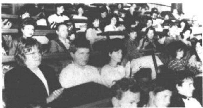
V skupščinskih dvorani se je zbralo kar precej nagradencev in njihovih staršev