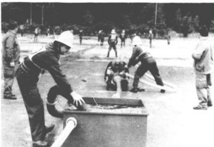
Na nedeljskem tekmovanju so savinjski in šaleški gasilci znova potrdili visoko stopnjo množičnosti in pripravljenosti