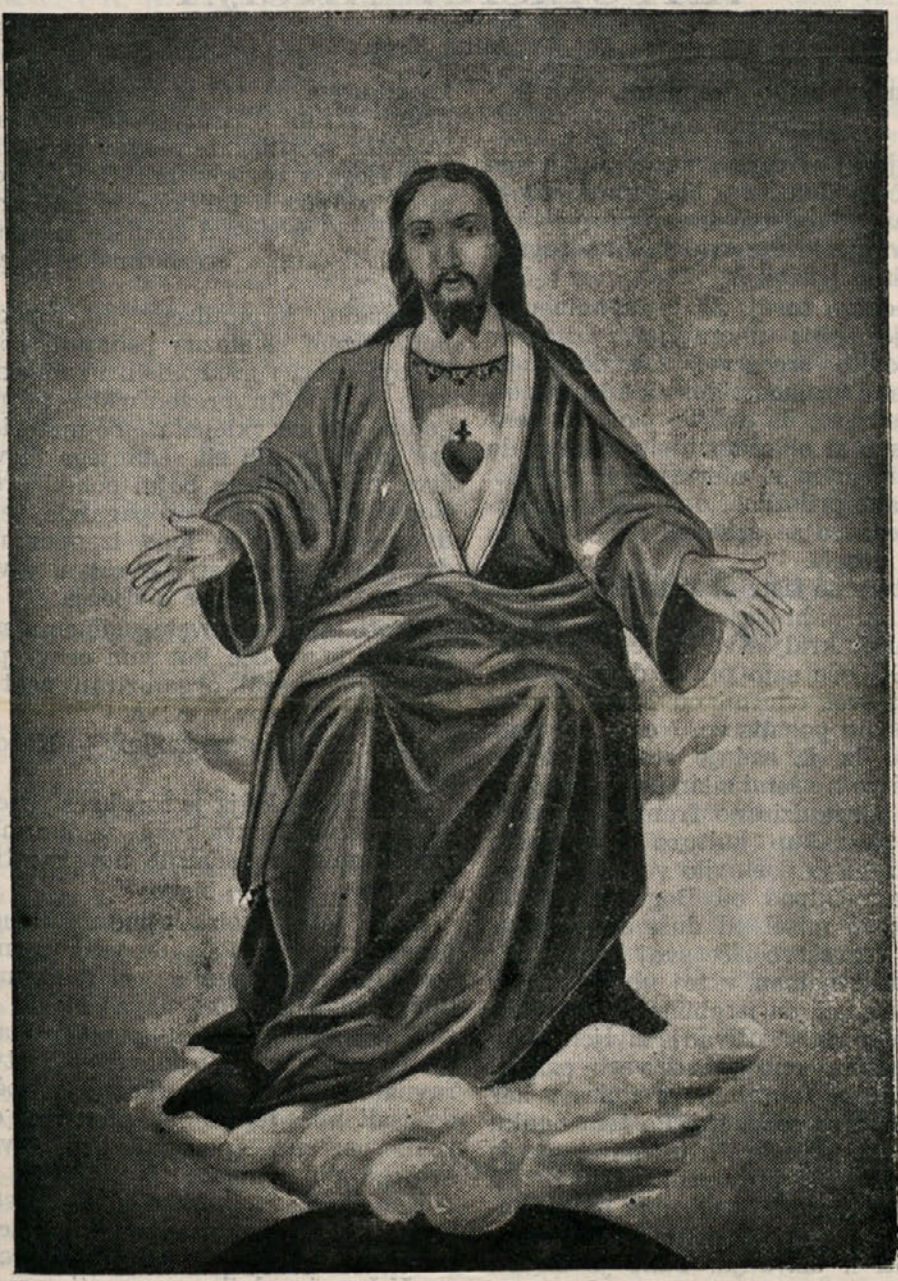
BOŽJE SRCE, BLAGOSLOVI NAŠO DOMOVINO!

NAŠ LIST IZDAJA MISIJONIŠČE V GROBLJAH, P. DOMŽALE. — UREJUJE IN ZASTOPA IZDAJATELJA JOZEF GODINA C. M., DOMŽALE-GROBLJE. — TISKA MISIJONSKA TISKARNA, DOMŽALE - GROBLJE. ZA TISKARNO JANKO STRNAD, DOMŽALE. — IZHAJA MESEČNO. POSAMEZNA ŠTEVILKA STANE 1 DIN, CELOLETNA NAROČNINA 12 DIN. INSERATI PO DOGOVORU. ROKOPISI SE REDNO NE VRAČAJO.