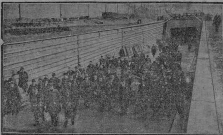
Otvoritev 2100 m dolgega in 6.75 m širokega tunela pod reko Schelde v mestu Antwerpen. Predor je otvoril belgijski kralj z ministri.

Če ne jemljemo v misel graščine Staretove, je bilo Colnarjevo posestvo najlepše in največje v Podbregu. Štiristo juter polja, travnikov in gozda, sto hektarjev torej. Lep, skoraj gospodski