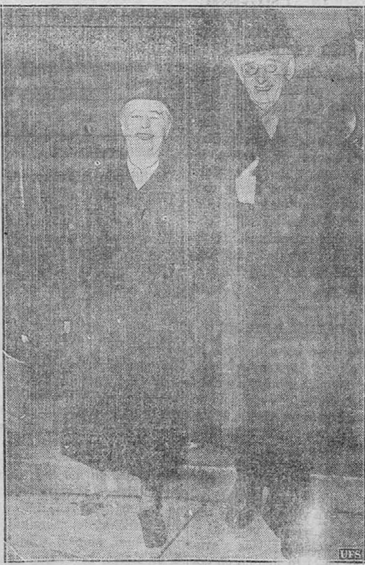
Vrhovni sodnik L. D. Brandelis je 13. novembra obhajal svoj 81. rojstni dan. Na vrhovno sodišče je bil imenovan v 1916 od predsednika Wilsona. Slika kaže sodnika in njegovo soprogo.