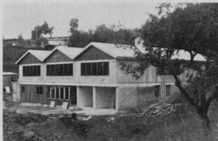
Pogled na novo osnovno šolo na Koblju

Nobenega dvoma ni več, da z poukom v novi osnovni šoli na Koblju ne bi pričeli že prvi dan letošnjega šolskega leta. Gradnja nove šole gre v zaključno fazo, po tem ko so monterji Marlesa končali z montažo zgornjega dela zgradbe.