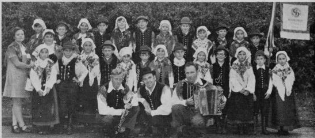
Spominski posnetek Markovčanov, ko so nastopili na reviji folklorne v Zagrebu

Ob koncu gre vso priznanje in zahvala staršem, ki so od vsega začetka pokazali veliko razumevanje za svoje otroke, predvsem pri nabavi narodnih noš, osnovni šoli Markovce ter društvu Partizan, ki sta pripomogla, da se je naša pionirska folklorna skupina lahko udeležila tako velike prireditve v izvirnih nošah.