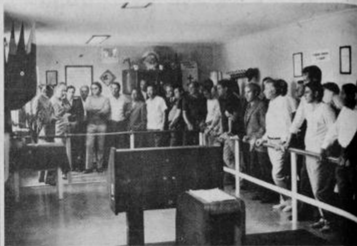
Ob otvoritvi novega kegljišča v Ptuj

Od letošnjega dneva vstaja ima 15 krožkov Kegljaškega kluba Ptuj na razpolago za rekreativni šport novo avtomatsko kegljišče na športnem stadionu „Drava“ v Ptuj.