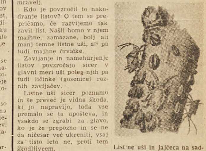
List ne usi in jajčeca na sadnem drevesu

Kdo je povzročil to nakordanje listov? O tem se pričamo, če razvijemo tak zavist list. Naši bomo v njem majhne, zamazane, bolj ali manj temne listne uši, ali pa tudi majhne črvice.