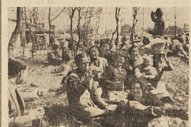
Tu pa so se delavci lotili do brega in disecnega kosila, ki so jim ga pripravili pridne in požrvalne križke zene