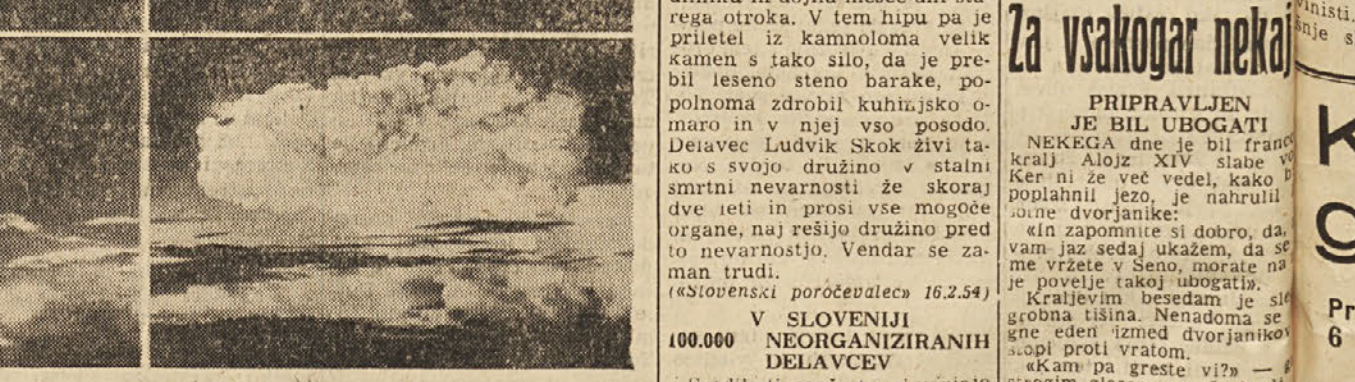
Stiri faze prvga poskusa z vodikovo bombo. Iz slik je razvidno, da je eksplozija se strasjeja od atomske bombe