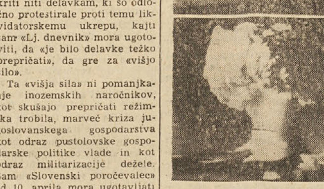
Stiri faze prvga poskusa z vodikovo bombo. Iz slik je razvidno, da je eksplozija se strasjeja od atomske bombe

Važno je, da se v teh zadnjih dneh naša mladina dobro pripravi in da vložijo svoje sile za odlični uspeh prvomajskih manifestacij. Prepričani smo, da bo naša mladina storila svojo dolžnost, saj smo lahko zadovoljni, kako se je sedaj pripravljala. Od vsega, kar smo videli, lahko rečemo, da bodo gledalci, ki se bodo podali na stadion pri Sv. Soboti Prvega maja popoldne, zadovoljni in da bodo odnesli najboljši vtis od te velike manifestacije.