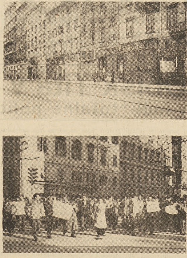
Prejšnji petek popoldne je bila v Trstu in na podeželju pibiscitarna protestna stavka tržaške male in srednje industrije, ki je prišla do izraza s popolno zaporo vseh trgovin in podjetij. Protestu so se pridružili tržaški delavci, ki so v polni manifestaciji izrazili svoje zahteve za zagotovitev dela naši ladjedelniški industriji in trgovskemu prometu.