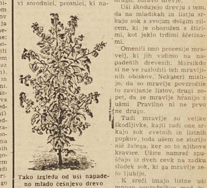
Tako izgleda od usi napade na mlado česnjevo drevo