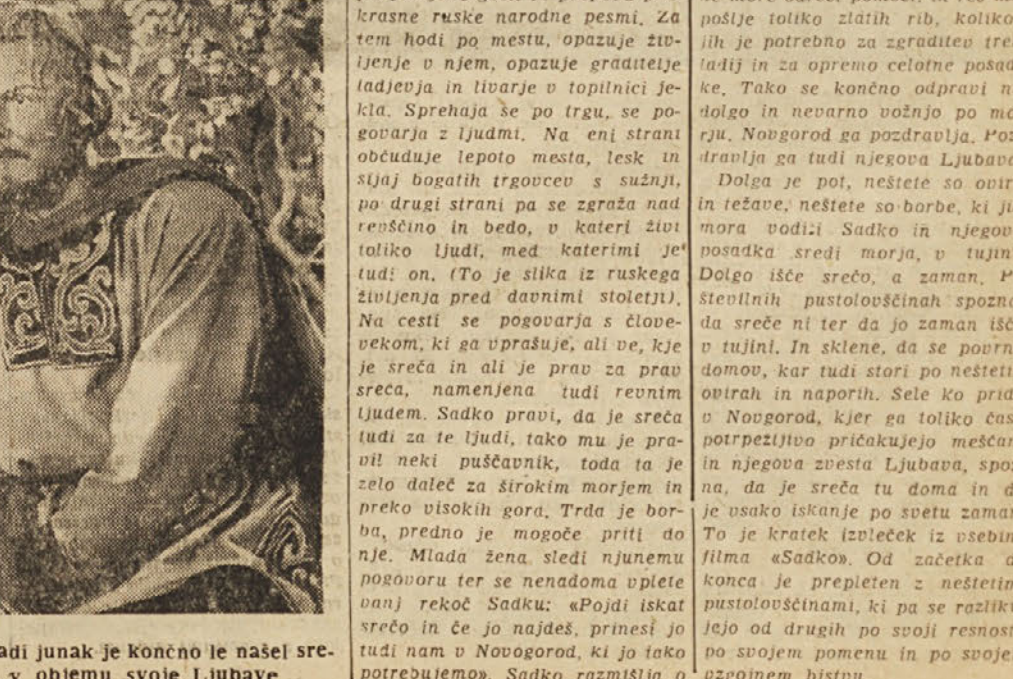
Prizor iz filma »Sadko«. Mladi junak je končno le našel srečo med svojimi ljudmi in v objemu svoje Ljubave

ko ponasa sovjetska umetnost. Njegova značilnost je v tem, da družaj daljno preteklost s sodobnostjo, da je pravljen, a obenem zabaven in vzgojen. Sadko je bil legendarni ruski pomorski človek viteskega značaja, ki je bil ob vsaki priložnosti pripravil tudi v neštete borbe zata, da pomaga ne le sebi, temveč tudi svojim bližnjim. In v filmu ga vidimo, kako pripelje s svojo barko na obrežje Nougordaja ter med tem igra na svoje priljubljene gosti in prepeva proklamirane ruske narodne pesmi. Za to hodi po mestu, opazuje življenje in ljubezni v toplini je lajda. Tako se končno odpravi na dolgo in nevarno vojno po Nougordaja, Nougordaja gozdarstva. Pravljen je tudi njegova Ljubana, slajb bogatih trgovcev s sužnji, in njegova žena Ljubava, spozna, da je usako izstarejo po svetu zamora. To je kratič izrečnik iz zbirke filma »Sadko«. Od začeka do konca je prepleten z nešteti prizori, ki so v razliki, po svojem pomenu in po svojem ozoznem bistvu.