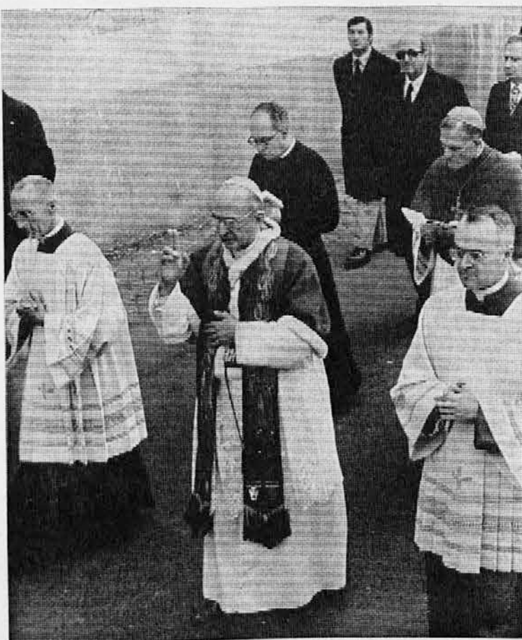
Sv. oče Pavel VI. je odprl postni čas s svojim obiskom v baziliki sv. Sabine

Jugoslovanska vlada je pripravila program za boj proti inflaciji, ki je v letu 1973 zrasla za 20 odstotkov v primerjavi z letom 1972. Kot je izjavil predsednik izvršnega sveta Džemal Bjedić je v letu 1974 pričakovati še nadaljnji porast življenjskih stroškov, kar bo povzročilo še nove zapletene probleme. Po dvehletnih presežkih v plačilni bilanci utegne priti letos do primanjkljaja.