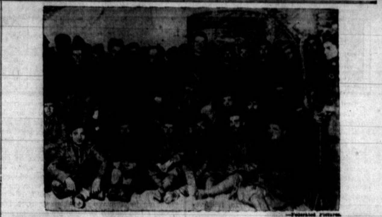
Skupina italijanskih "prostovoljcev", katere so lojalisti ujeli po bitki v bližini Guadalajare, Španija.