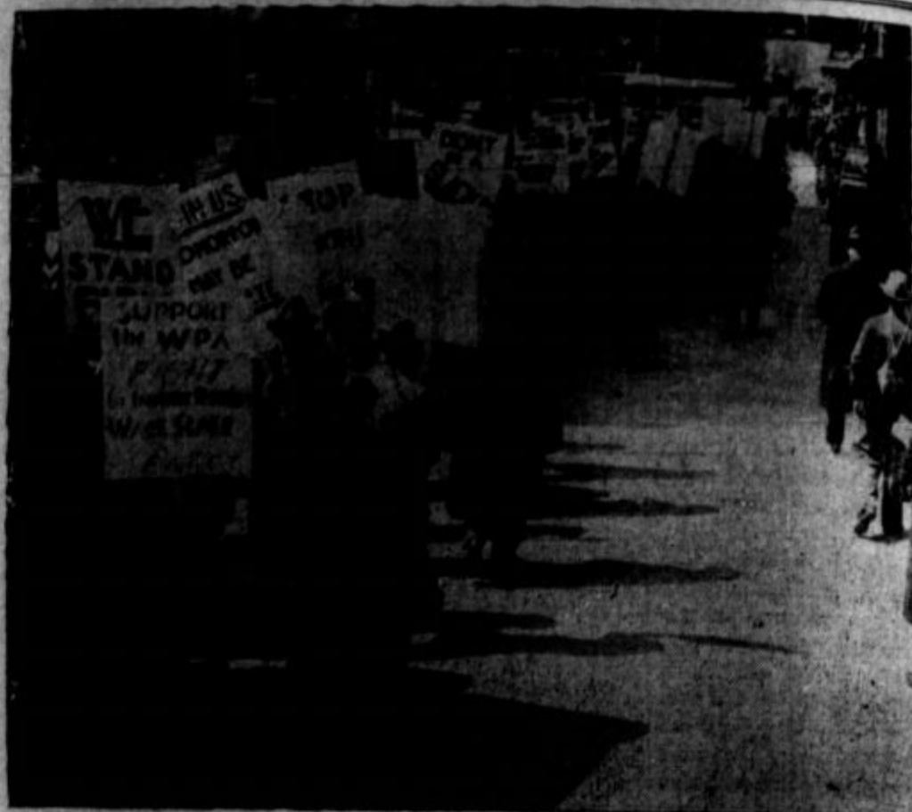
Protestne demonstracije religioznih delavcev v New Yorku proti odslovitvam.

All ste naročili na dnevnik 'Prosveto'? Podpirajte svoj list!