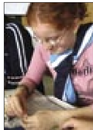
Vsak dan smo delali v drugi delavnici