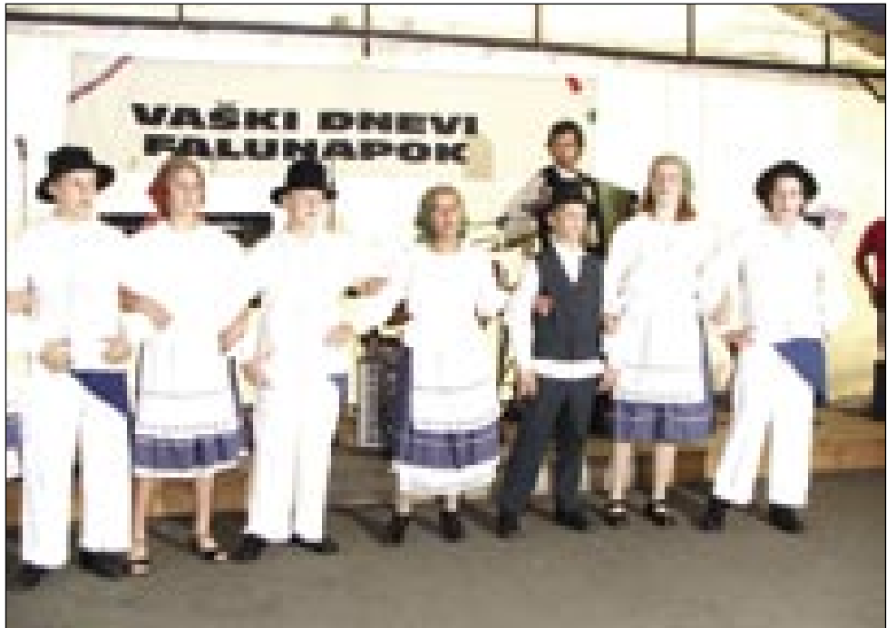
V kulturnom programi je nastopila domanja otroška folklor

V nedelo ob pol deseti se je začnila slovesna sveta meša z domačim