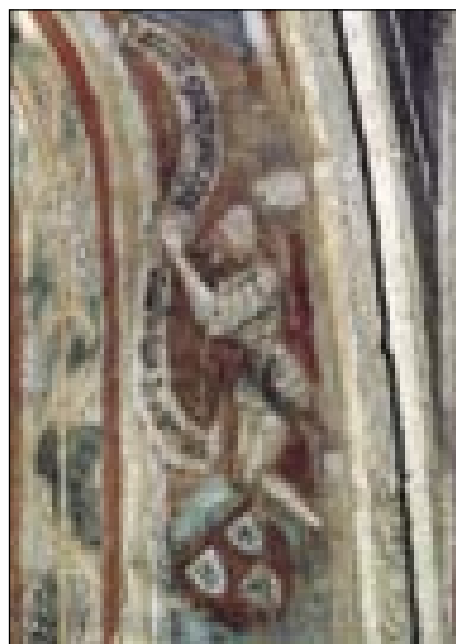
Avtoportet Janoša Aquile, konec 14. veka