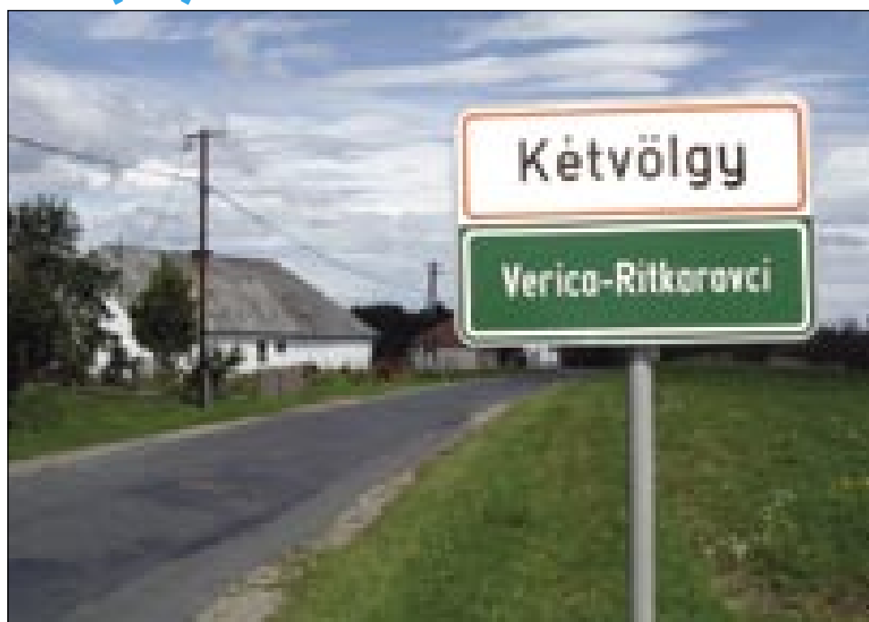
V Porabji bi tö moralo biti dosti več dvojezični napisov (na šaulaj, inštitucijaj, menje ulice ptt.), nej samo krajevne table

O Vojvodini smo vsigdar tak znali, ka je krajina mirnoga sožitja (együttélés). Vej pa v toj krajini je za časa Jugoslavije tö več narodov vküp žive-