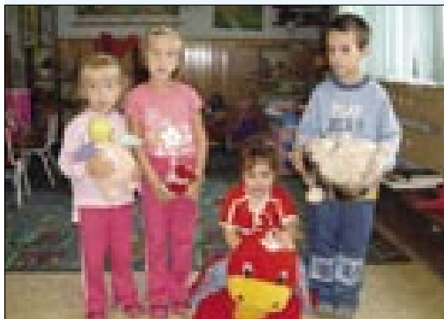
... in podarila veliko zbirko priljubljenih igrač otrokom iz Porabja

Karči je drugi četrtek pripelo štiri žakle špile pa ednoga tak völkoga mackona kak vözraščeni človek. Tistoga ipa so v porabski vrtcaj že počitnice meli, zatok smo nej mogli mlajšom igračke razdeliti. Zdaj, ka se je po vrtcaj pá začnilo delo, smo je razvozili od Števanovec do Gorenjoga Senika.