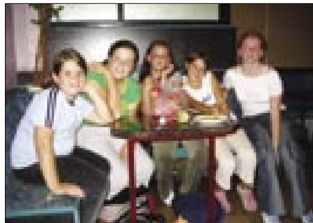
Tau smo seničke dekle!

se samo malo pogovarjali. Hoteli so me peljati tüdi na pico, samo jaz pice ne maram, zato nismo šli.«