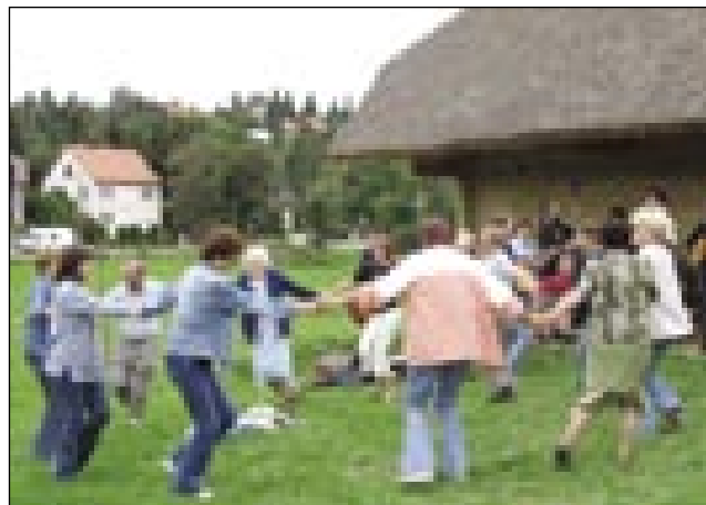
Sombotelčani in Kapelčani pred Slovensko hišo v Skansnu

svojo muziko, pesmi Hrvatke, Ciganji pa Židovge tō. Paulek frančiškanske cerkve v ednom dvorišči pa smo leko spoznali, kak so Rimljani, stari Madžari živali v šotoraj, pa kak so se bojūvali s sablami, kak so strejlali s pušicami (nyilakkal). Nej bilau vse samo za gledat, dosta vse se leko vōsprobalo tō.