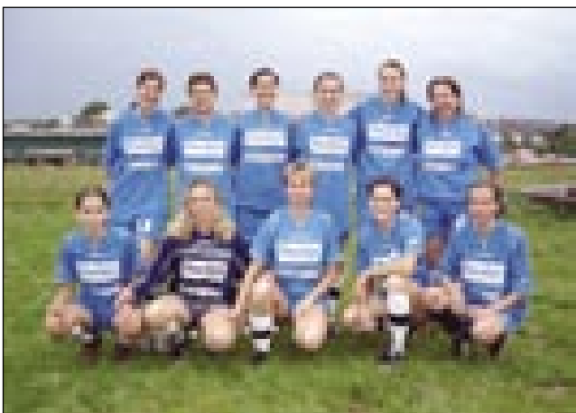
Števanovske deklet v nauvom dresi

vanovci, Dolnji Senik pa OŠ Bakovci. Pri ženski ekipaj so igrале deklet iz Slovenske vesi, Števanovci,