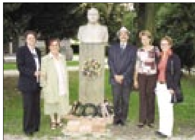
Cankovska delegacija s predsednicama slovenskoga društva in slovenske samouprave v Somboteli