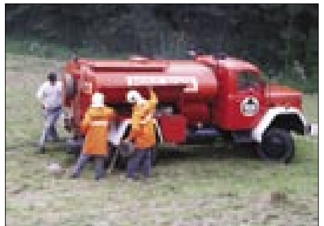
Gasilci so gasili, dapa dež jim je tō pomago

Te cajt so od podneva naprej na šolskom dvorišči postavili za najmlajše igrala, ka so se leko čujskali, skakali. Žao, športni program je vrejmen pokvarilo.