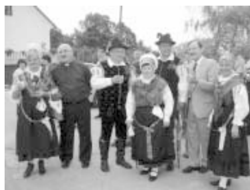
Z narodnimi nošami