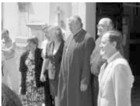
Z nadškofom, bratom in sestrami