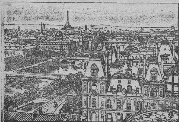
Zur Beschliessung von Paris Panorama der Stadt (im Hintergrunde d. Eiffelturm)

K.-B. Berlin, 9. aprila. Iz velikega glavnega stana se poroča: